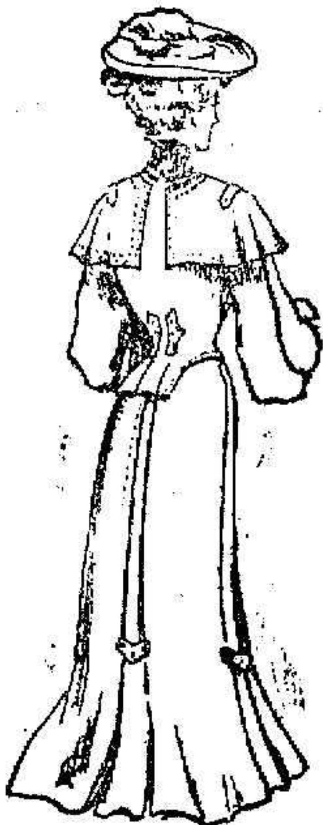
Traje de mañana para señora.

Es de paño color castaña y corte sastrero. Chaqueta corta con aldeta por detras y en el talle unas lengüetas sostenidas por tres botones; gran cuello de pelerina con sobrecuello de terciopelo negro. Falda plogada, abierta en el bajo y cuyos pliegues se sostienen con lengüetas de la misma tela. Mangas anchas con puños de terciopelo,