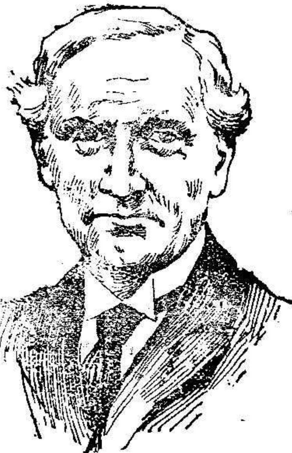
Herbert Henry Asquith

se disputaban el triunfo, el bloque democrático del cual es alma el ministro socialista Lloyd George, con sus reformas económico-sociales, y los unionistas, alentados por José Chamberlain