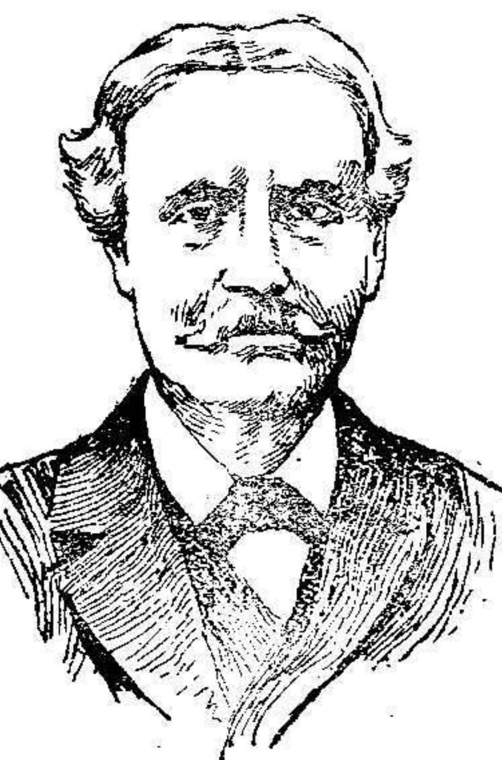
Arthur James Balfour

se disputaban el triunfo, el bloque democrático del cual es alma el ministro socialista Lloyd George, con sus reformas económico-sociales, y los unionistas, alentados por José Chamberlain