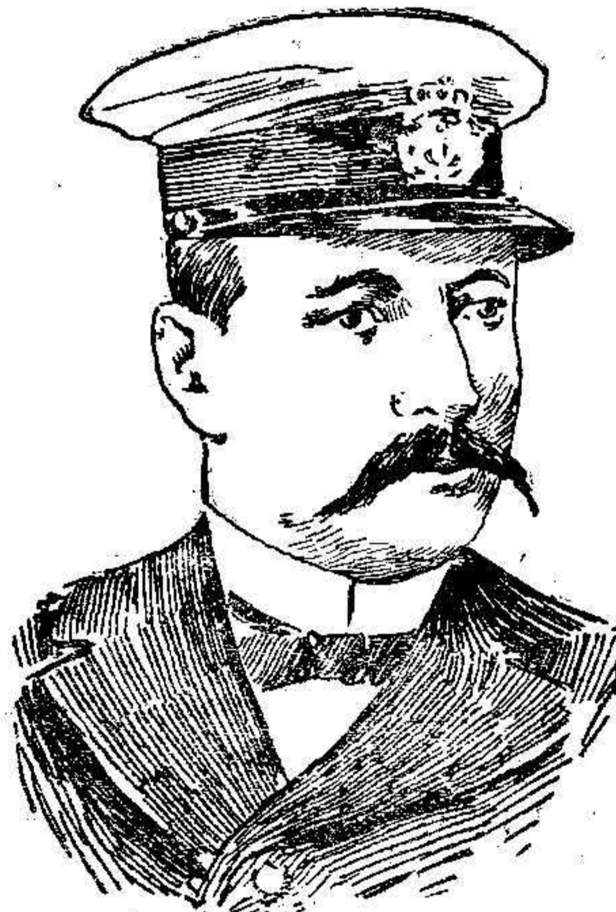
El Vice-almirante Cándido dos Santos, que despues de sublevar la escuadra se suicidó, por creer fracasado el movimiento