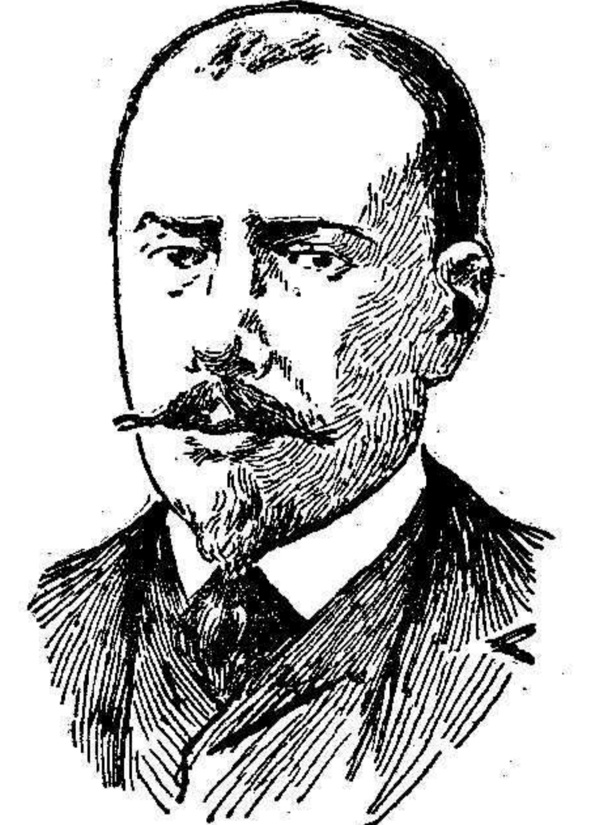
Antonio Luis de Gomes, ministro de Obras Públicas del gobierno provisional portugués