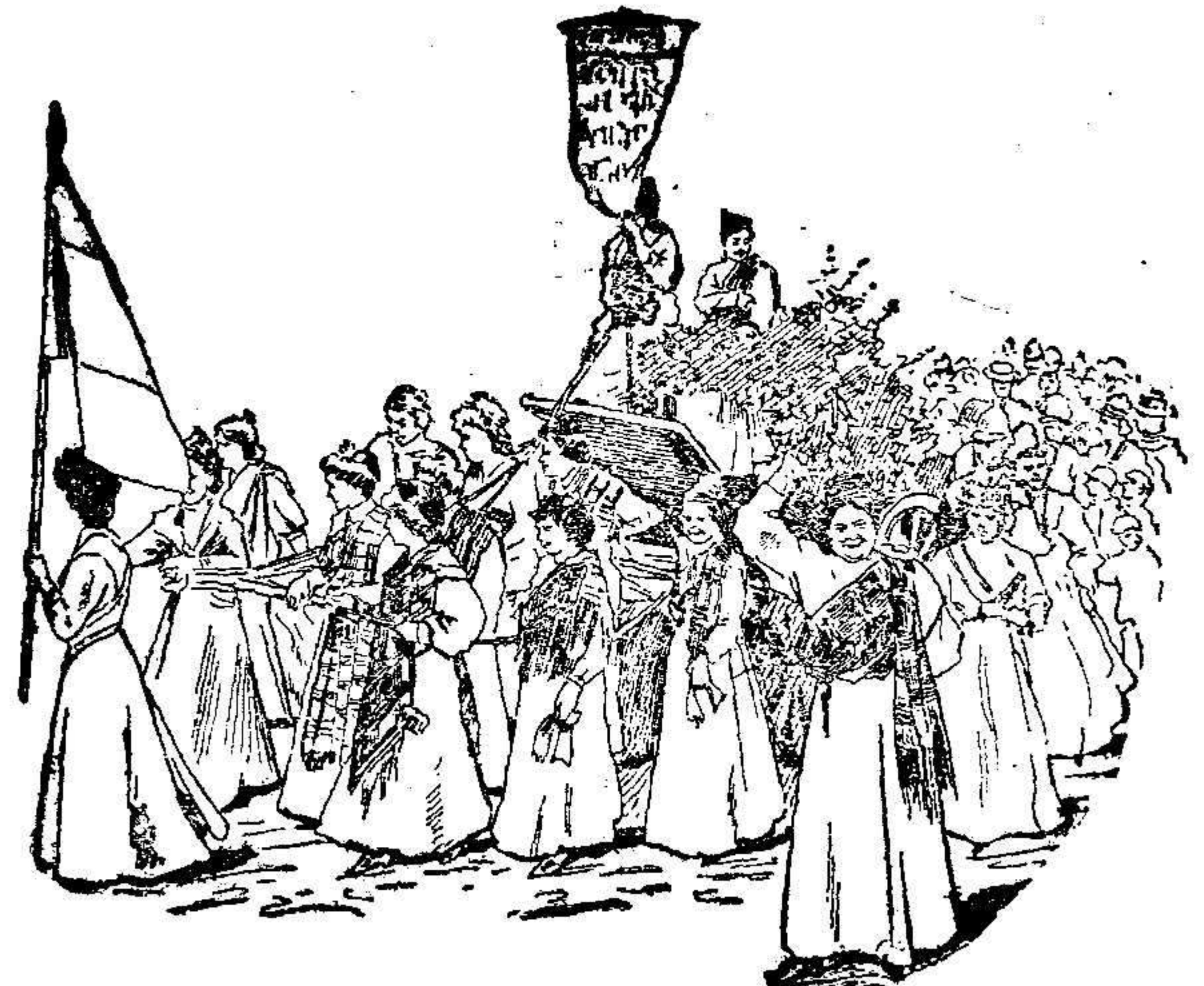
Una manifestación de sufragistas

policias que cambian tiesos y graves á ambos lados de la comitiva. Este es el pan nuestro de cada día en Londres, como también que las sufragistas armen monumentales escádalos por penetrar en el Parlamento ó por asaltar el despacho de un consejero de la Corona.