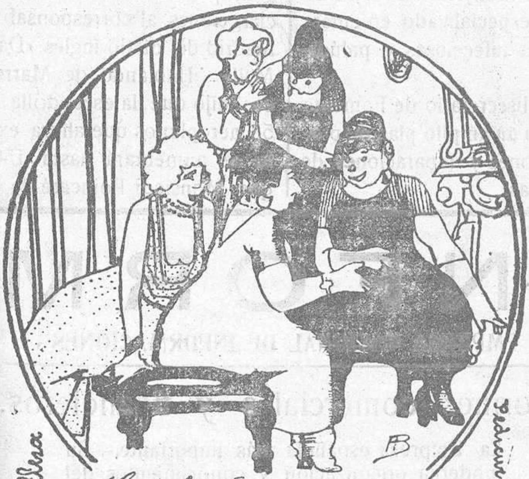
Recreo Salmantino y gallinista de San