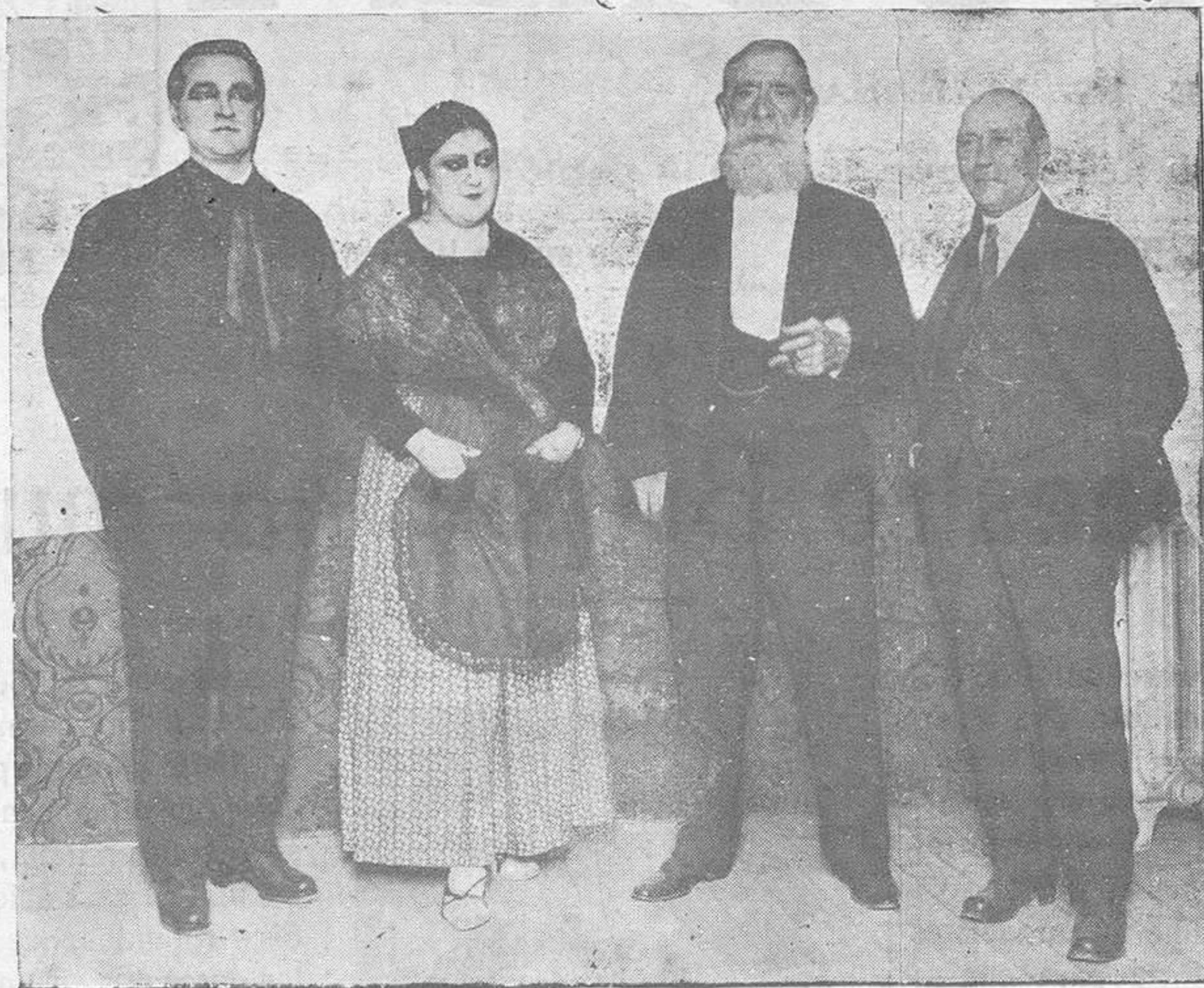
Aparecen en ella junto al insigne músico, el gran tenor Hipólito Lázaro y la notabilísima soprano Ofelia Nieto, instantes después de ser representada en el teatro Real, en homenaje a Bretón, la ópera «La Dolores».

inolvidable para cuantos nos honramos alcanzando la fortuna de asistir a él. Y en aquella noche quedó totalmente consagrado el casi anónimo nombre del salmantino Tomás Bretón, tanto, que si por una irreparable pérdida para la música española, desapareciera ésta y sólo se salvara la partitura de «La Verbena de la Paloma», dicha página reemplazaría sobradamente a nuestro glorioso archivo de los compositores nacionales.