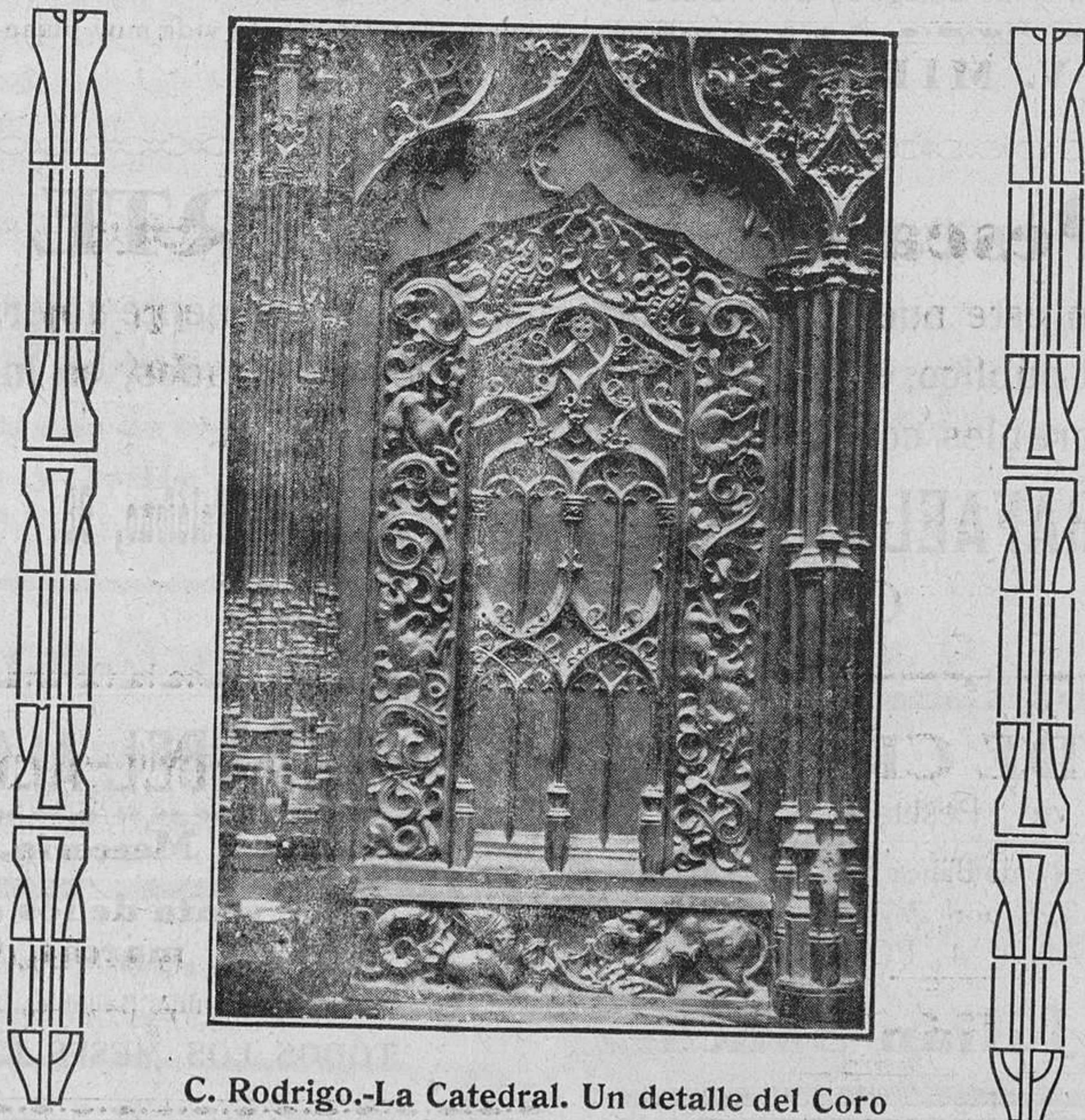
C. Rodrigo.-La Catedral. Un detalle del Coro