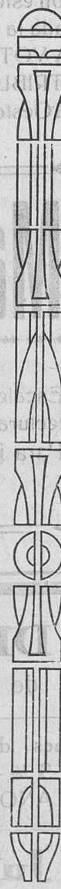
C. Rodrigo.—Altar de Alabastro de la S. I. Catedral