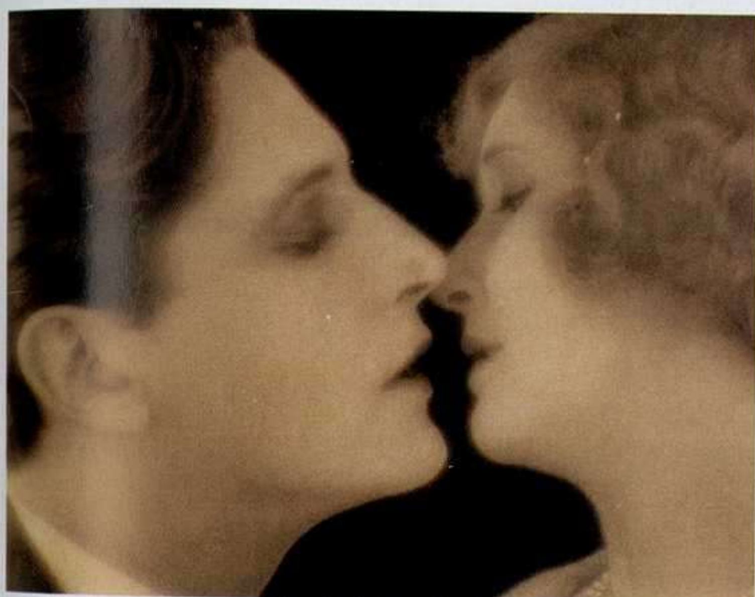
Ivor Novello & June Tripp 1927