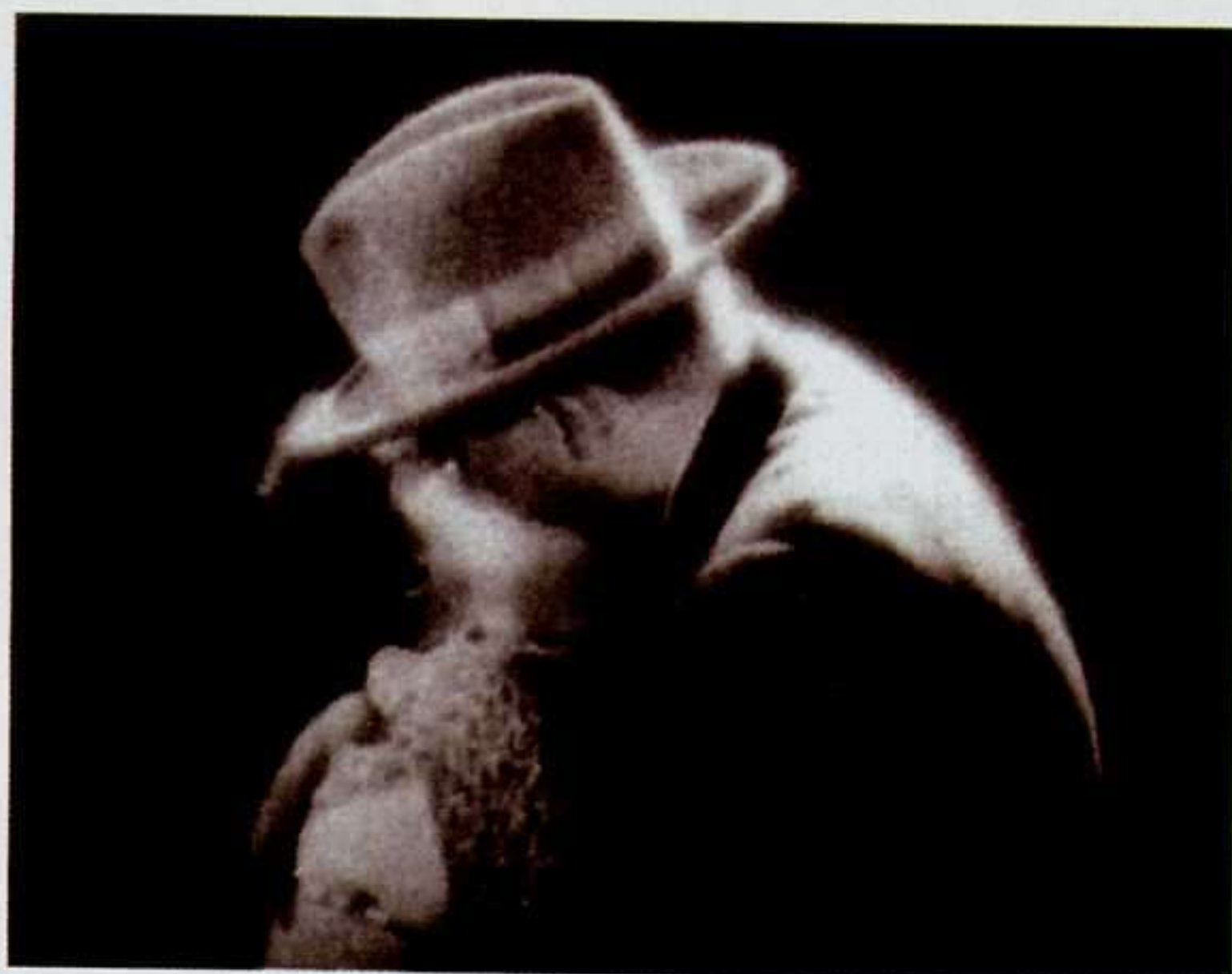
Lillian Hall Davis & Ian Hunter 1927