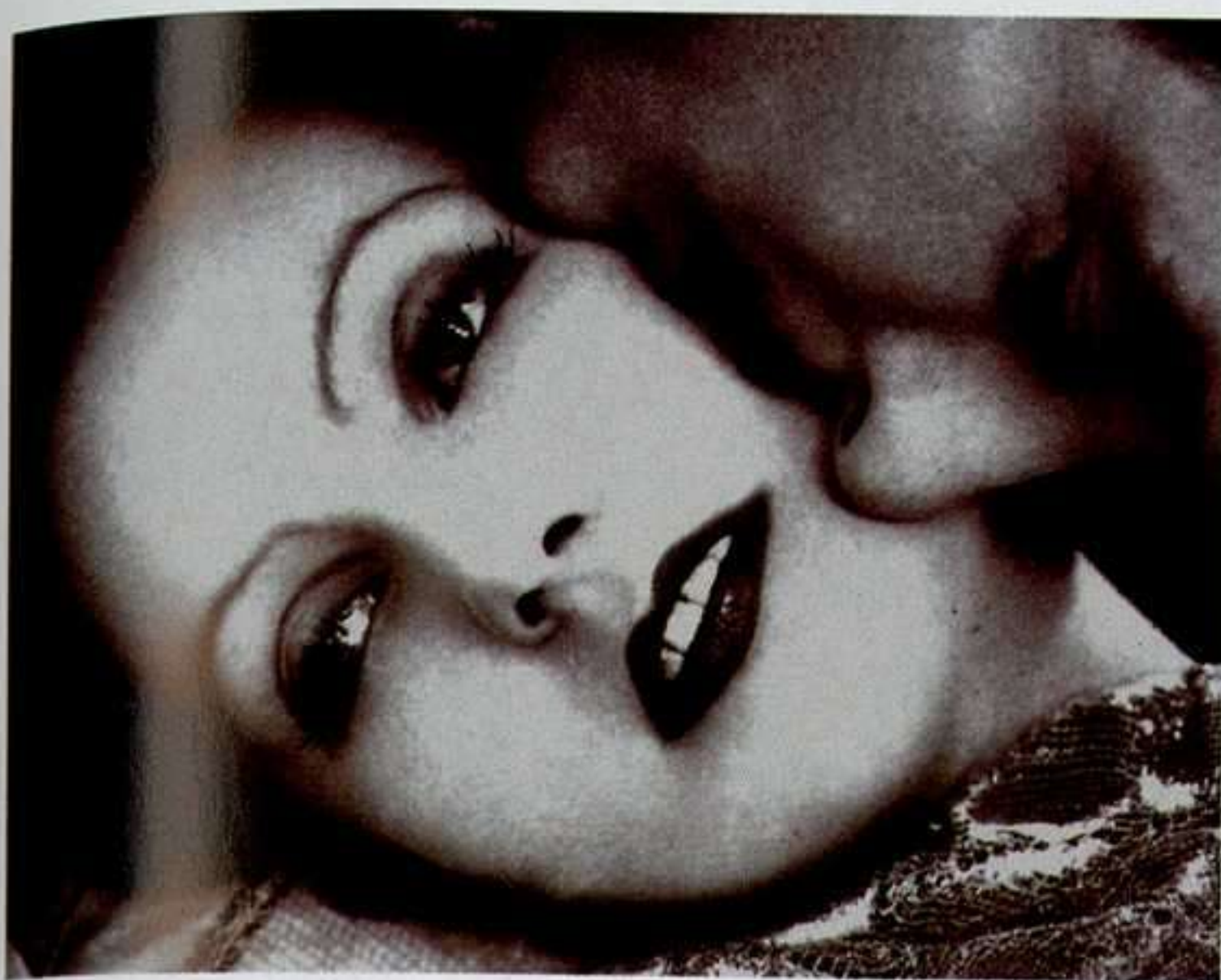
Greta Garbo & John Gilbert 1926