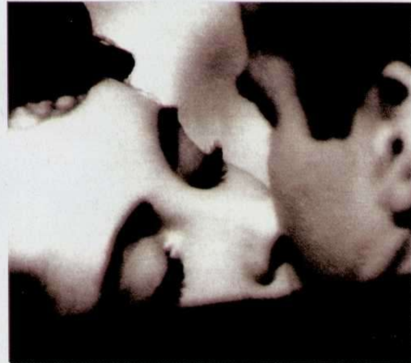
Montgomery Clift & Elizabeth Taylor 1957