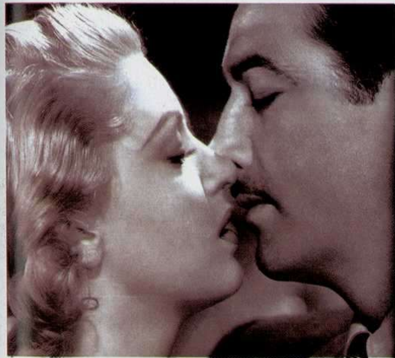
Lana Turner & Robert Taylor 1942