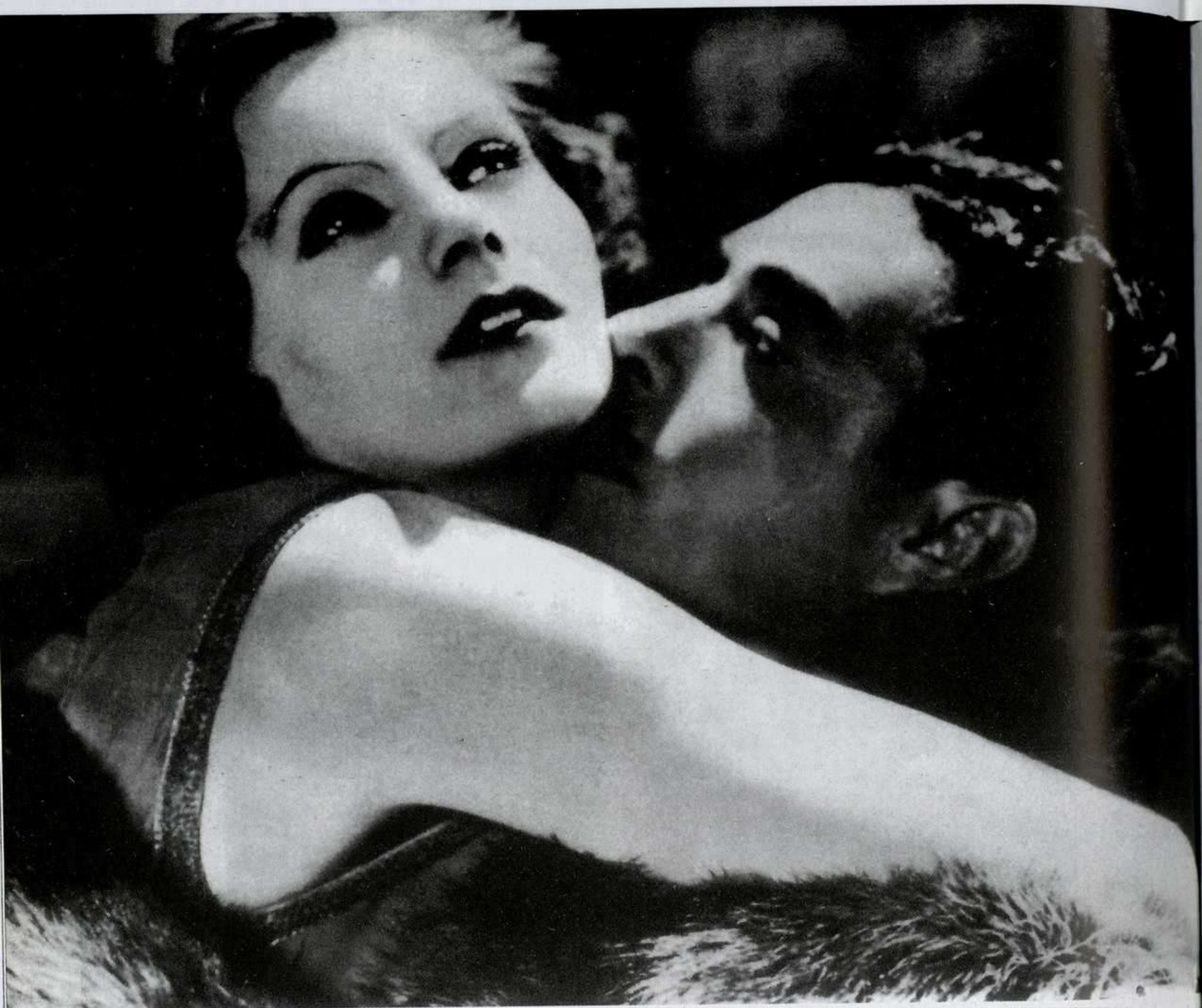
Greta Garbo & John Gilbert 1926

talla el nuevo arte del beso. Ahora ya no importa su mayor o menor duración, lo que importa es que sea artístico. En los estudios Warner Bros-First Nacional, donde Douglas Fairbanks, Jr. tiene su cuartel general, es considerado este joven actor como el más acabado tipo del «beso moderno»; pero sus partenaires femeninas no opinan lo mismo, Loretta Young, que ha trabajado con Douglas en «Su última pelea», asegura que los besos del joven galán son demasiado agresivos.