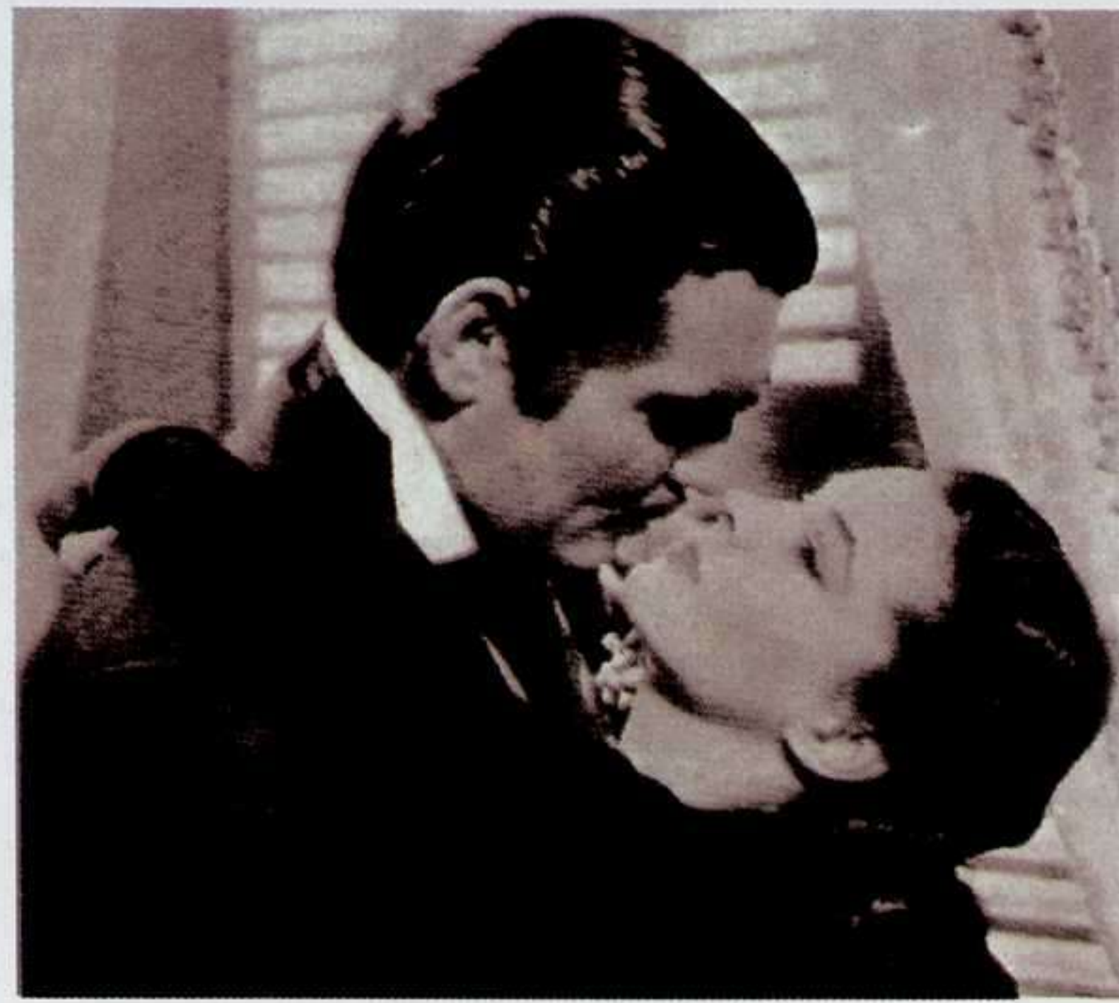
Clark Gable & Vivien Leigh 1939