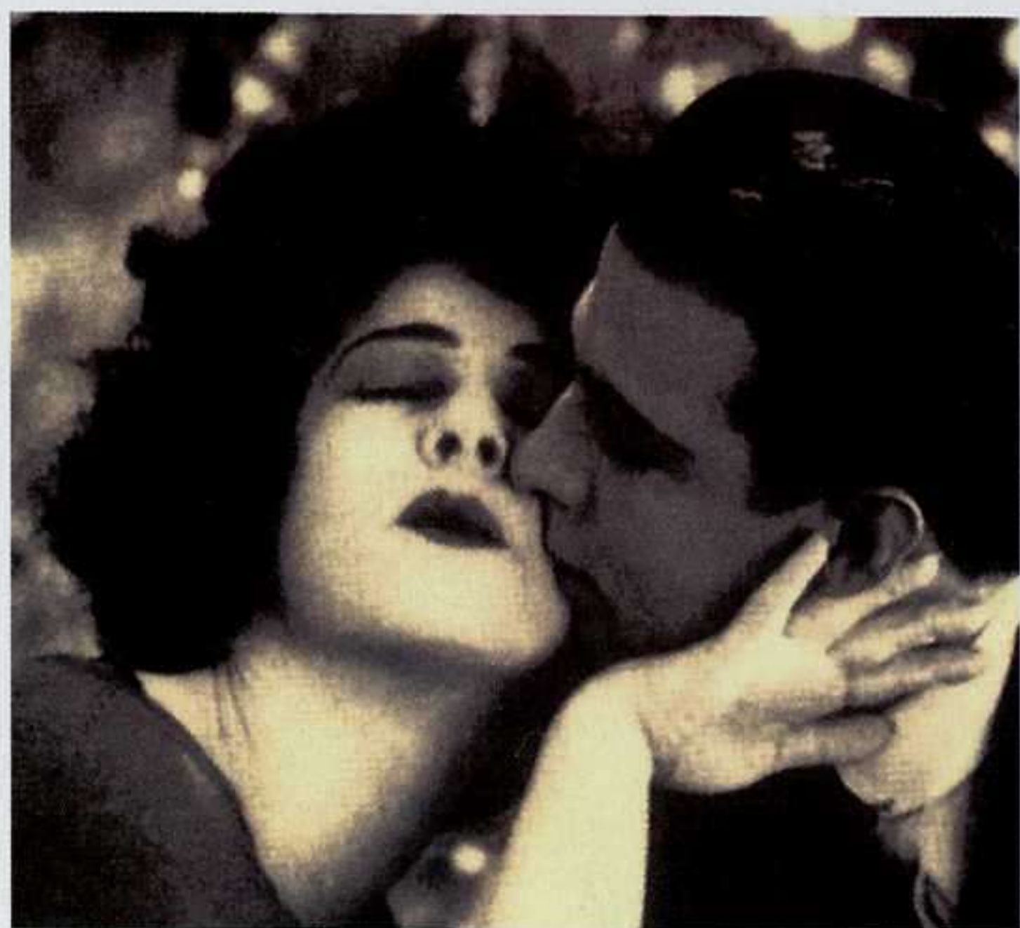
Rodolfo Valentino & Alla Nazimova 1921