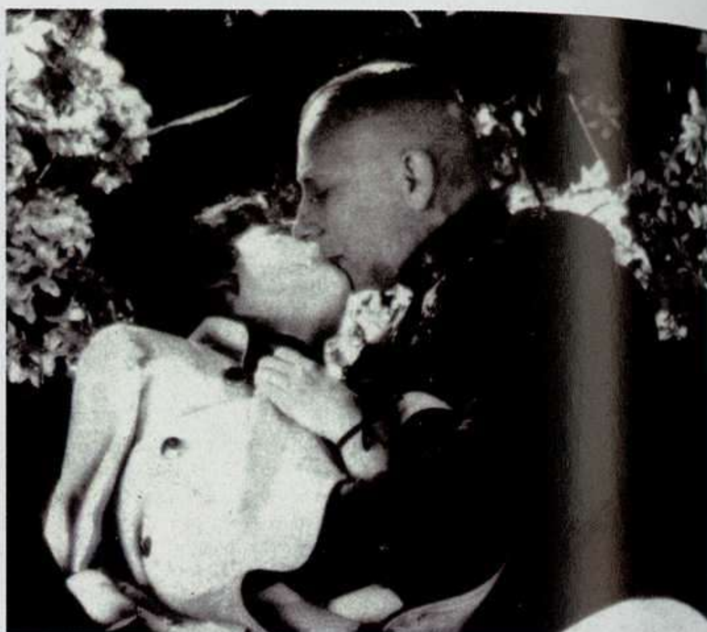
Erich von Stroheim 1918