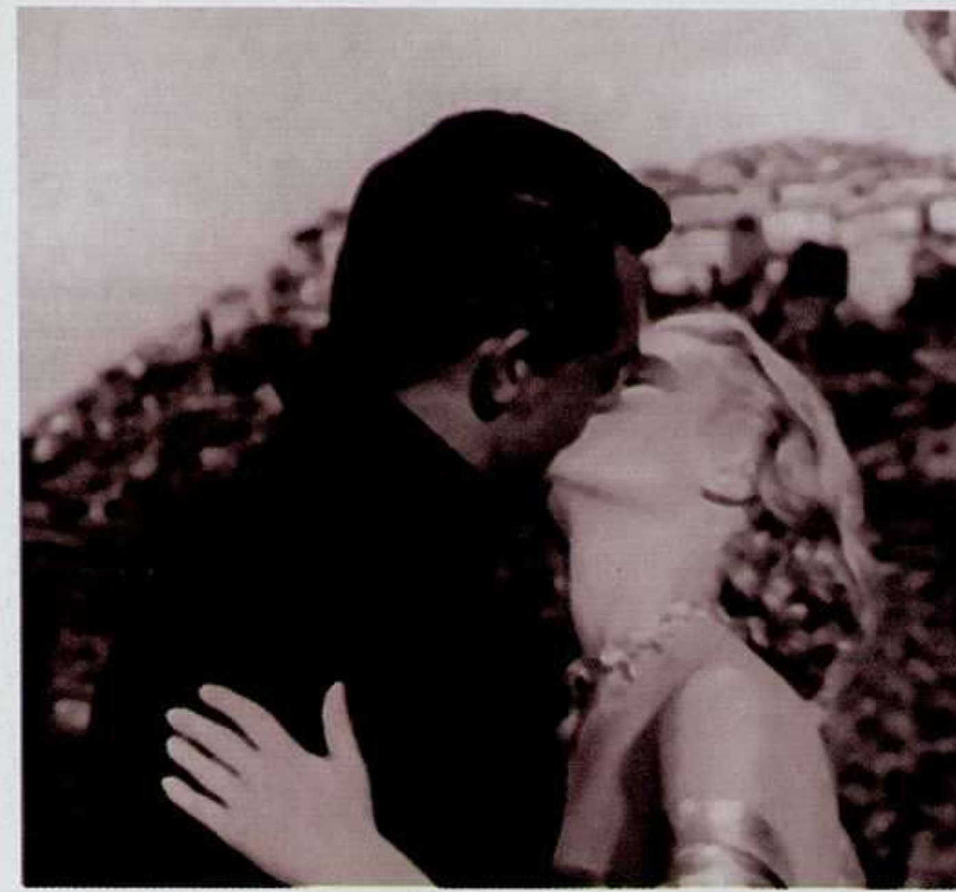
Cary Grant & Eva Marie Saint 1959