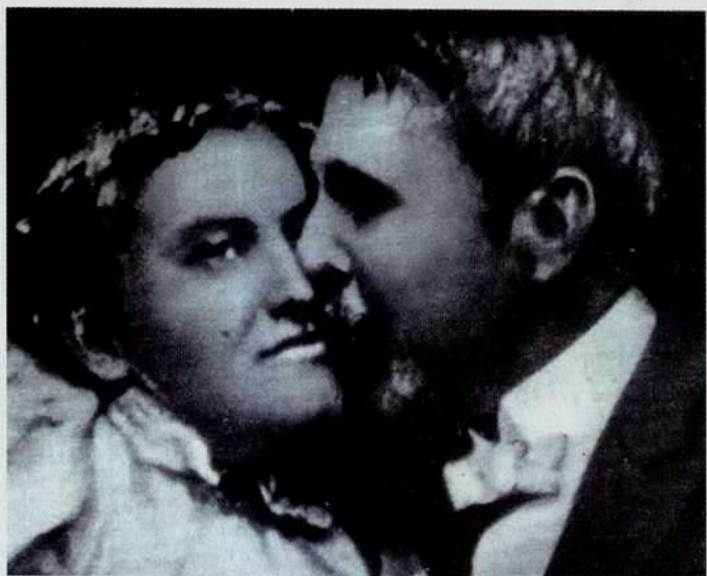
El primer beso en el cine