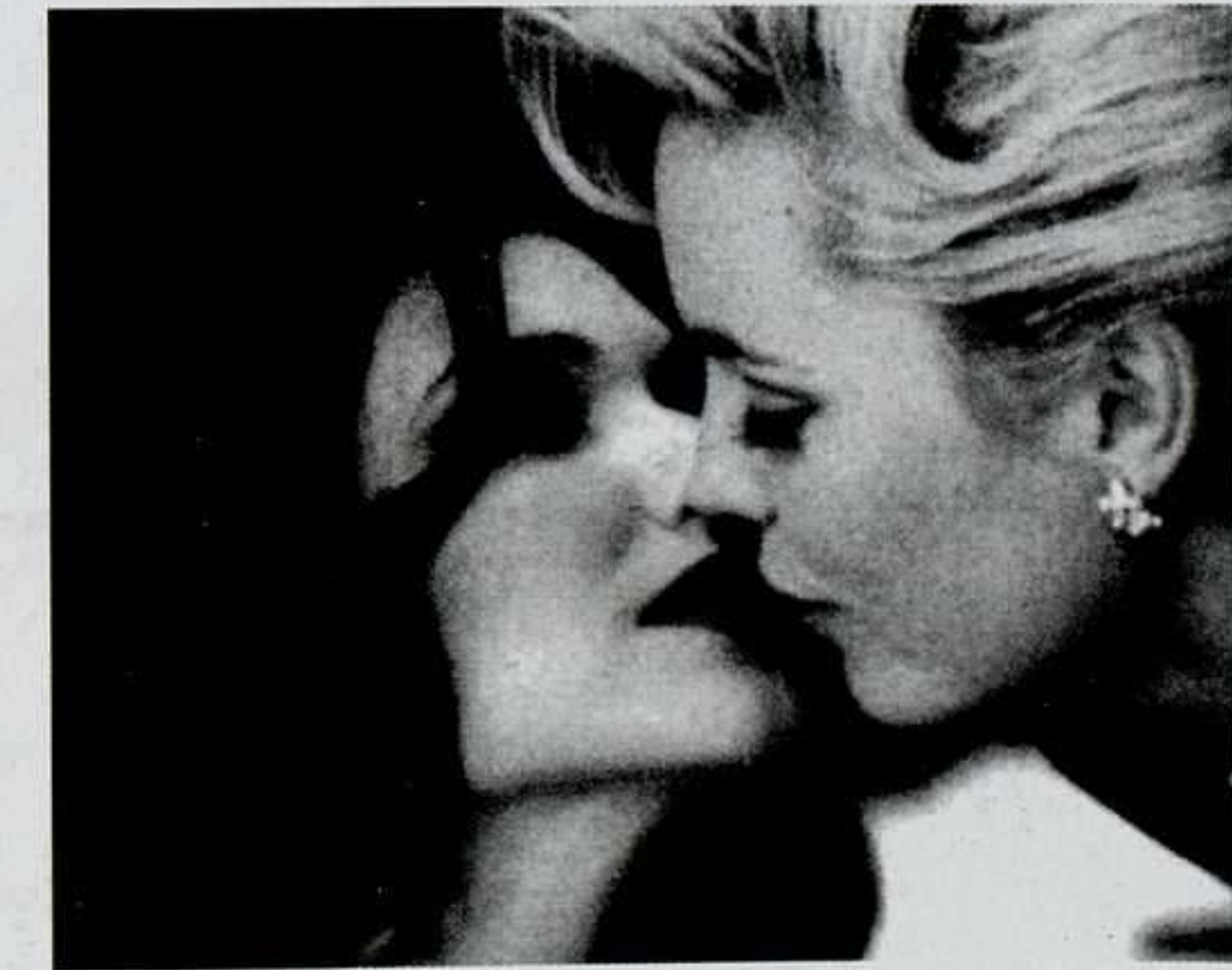
Laura Helena Harring & Naomi Watts 2002