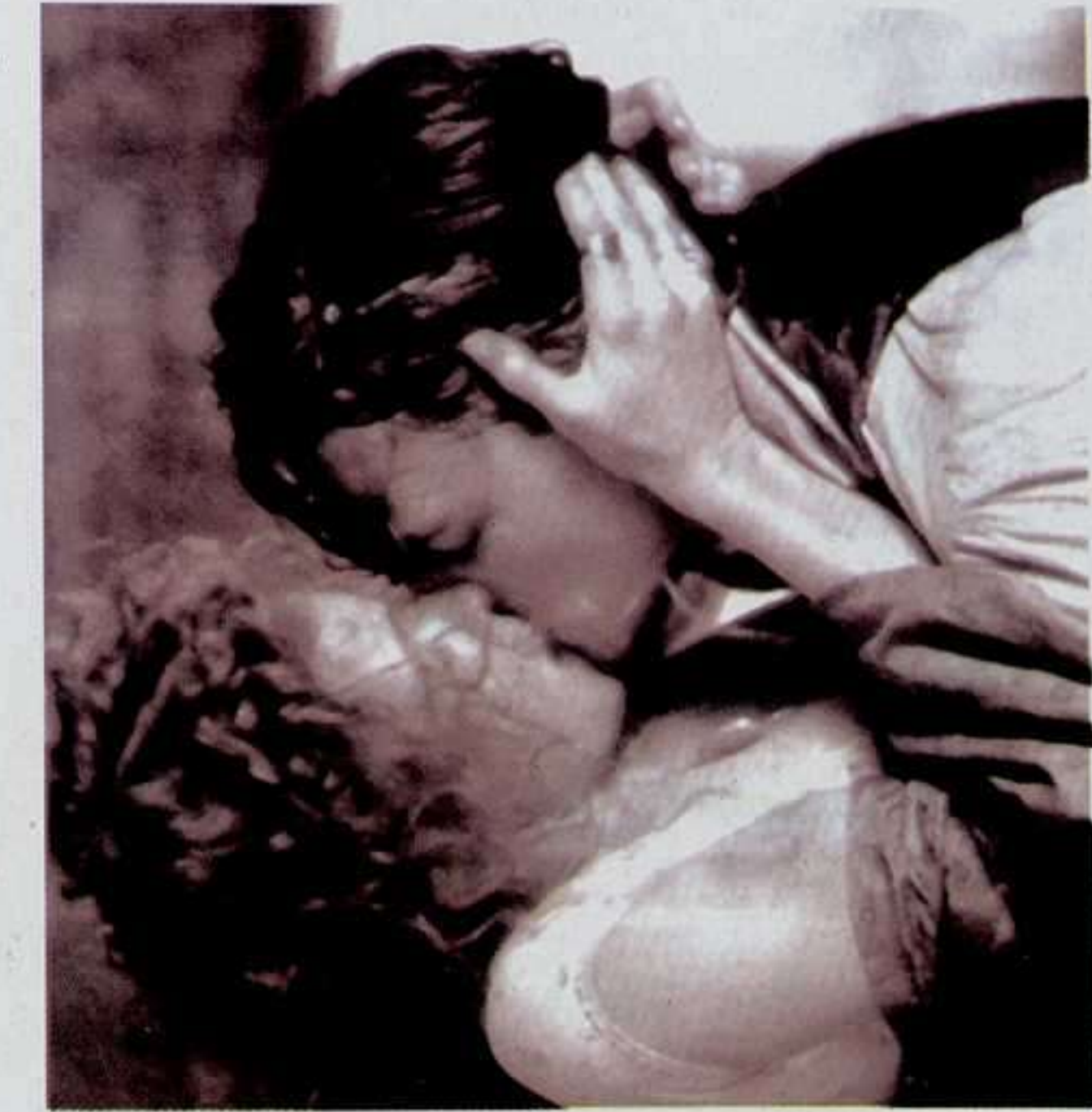
Leonardo Di Caprio & Cameron Diaz 2002