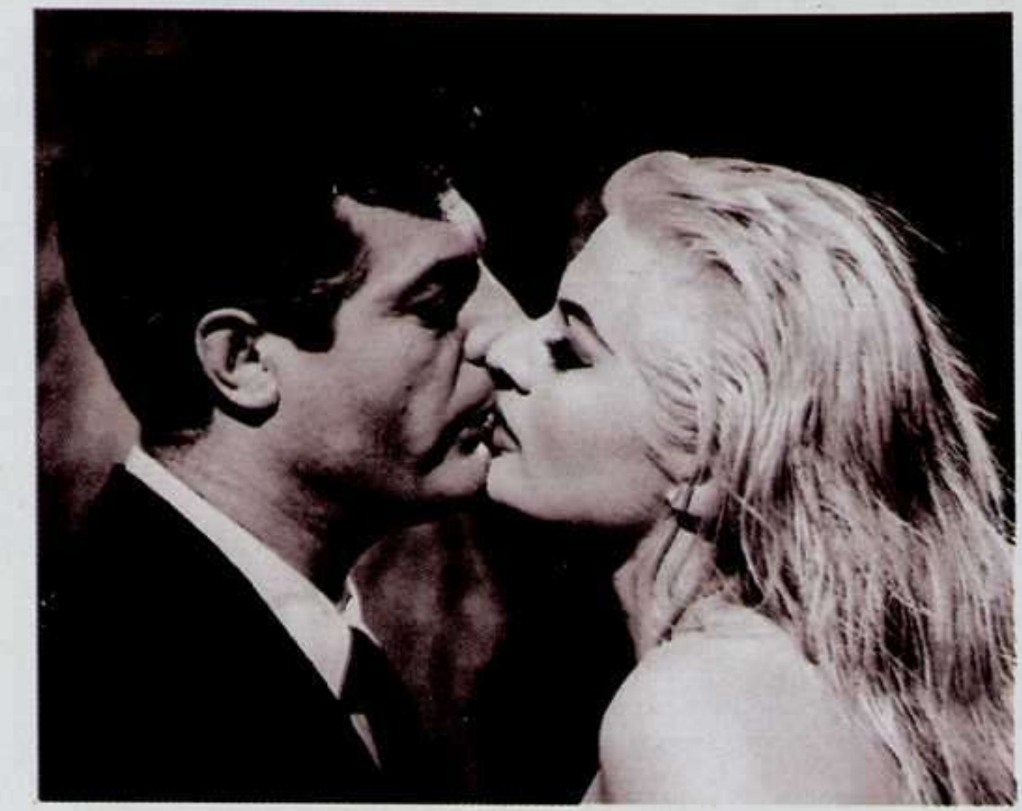
Marcello Mastroianni & Anita Ekberg 1959