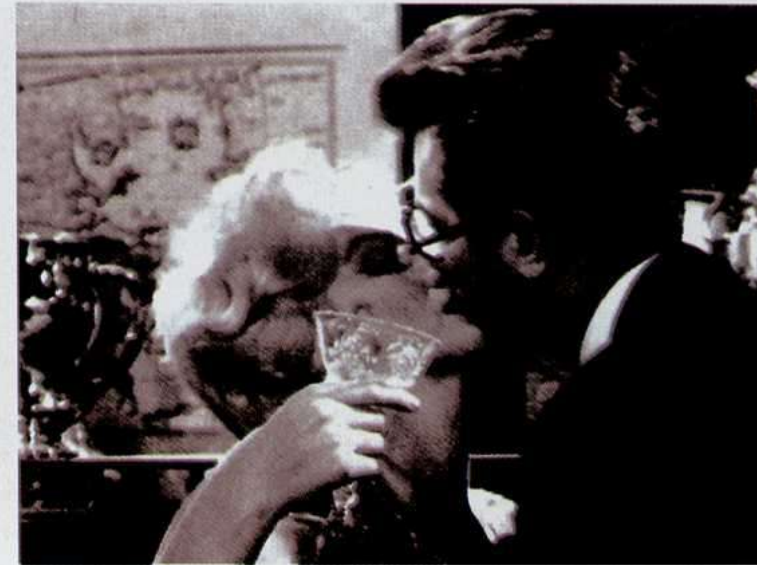
Marilyn Monroe & Tony Curtis 1959