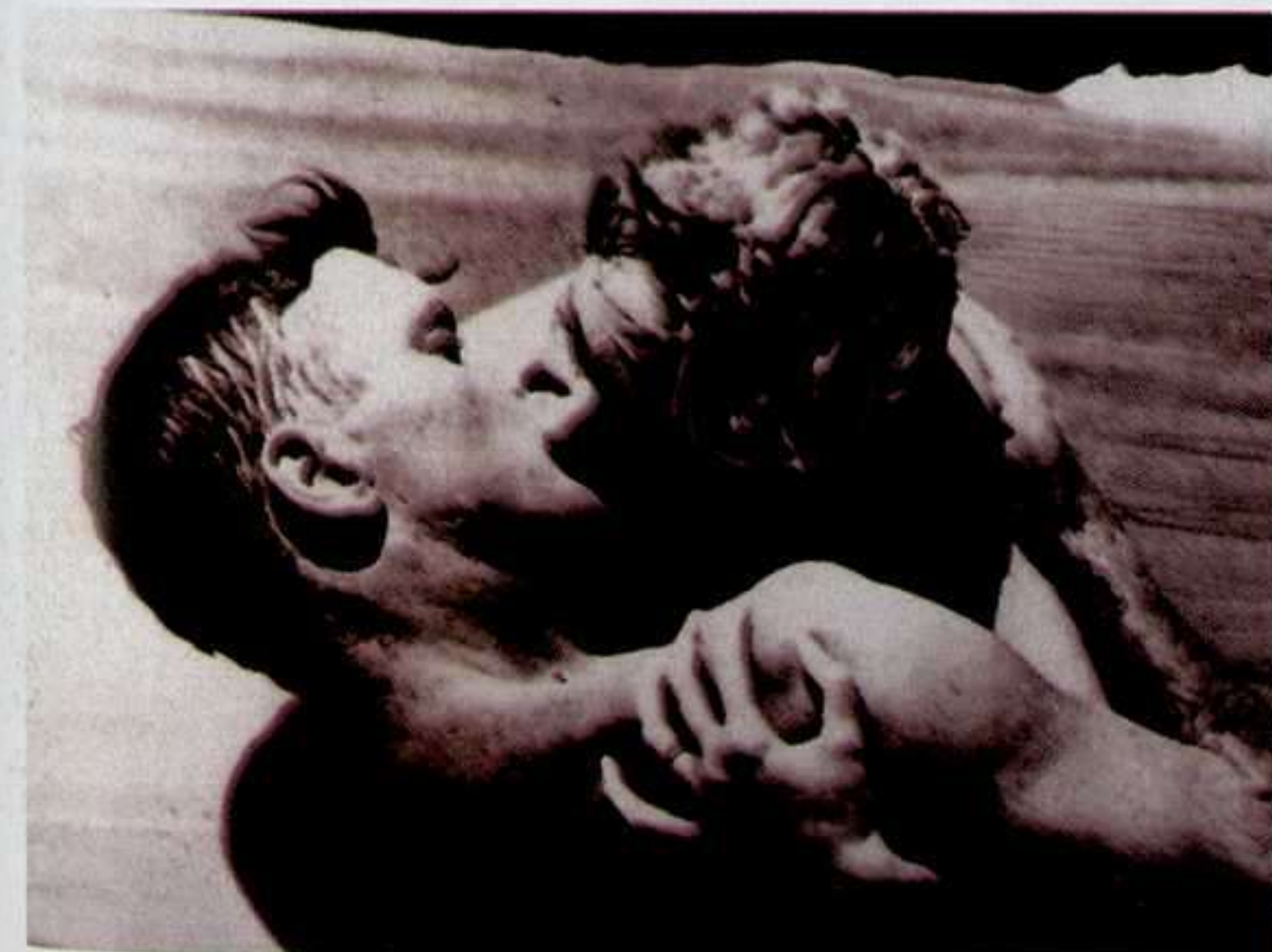
Deborah Kerr & Burt Lancaster 1953