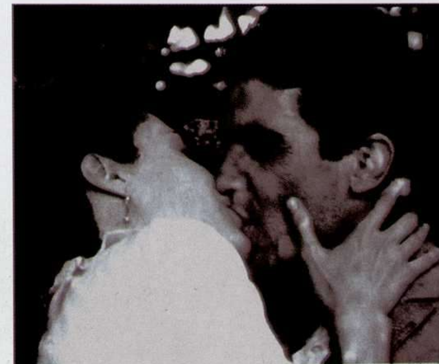
Antonio Banderas & Angelina Jolie 2002