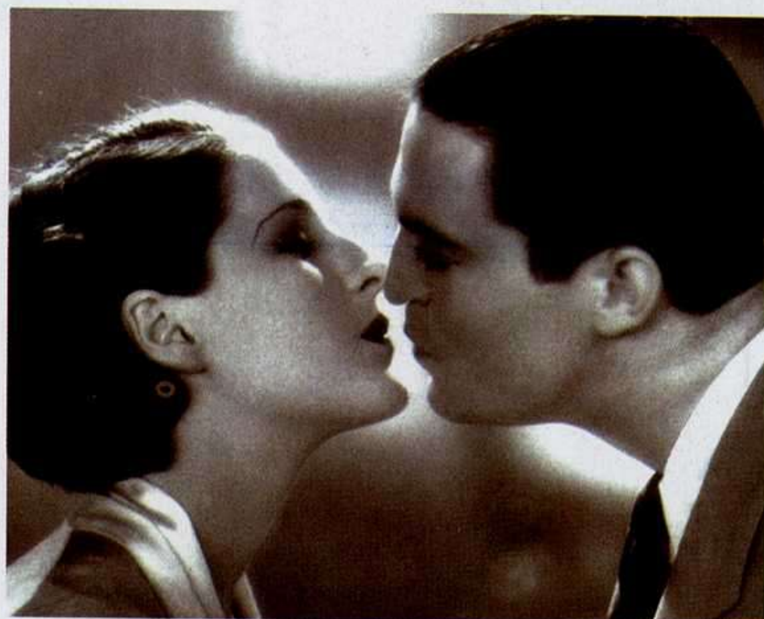
Norma Shearer & Chester Morris 1930

más largo de diez segundos», y cuando una cinta, traía uno de esos besos, clasificados por Mervin LeRoy de besos a «alta presión», la censura cortaba la cinta y se quedaba tan satisfecha de la mutilación.