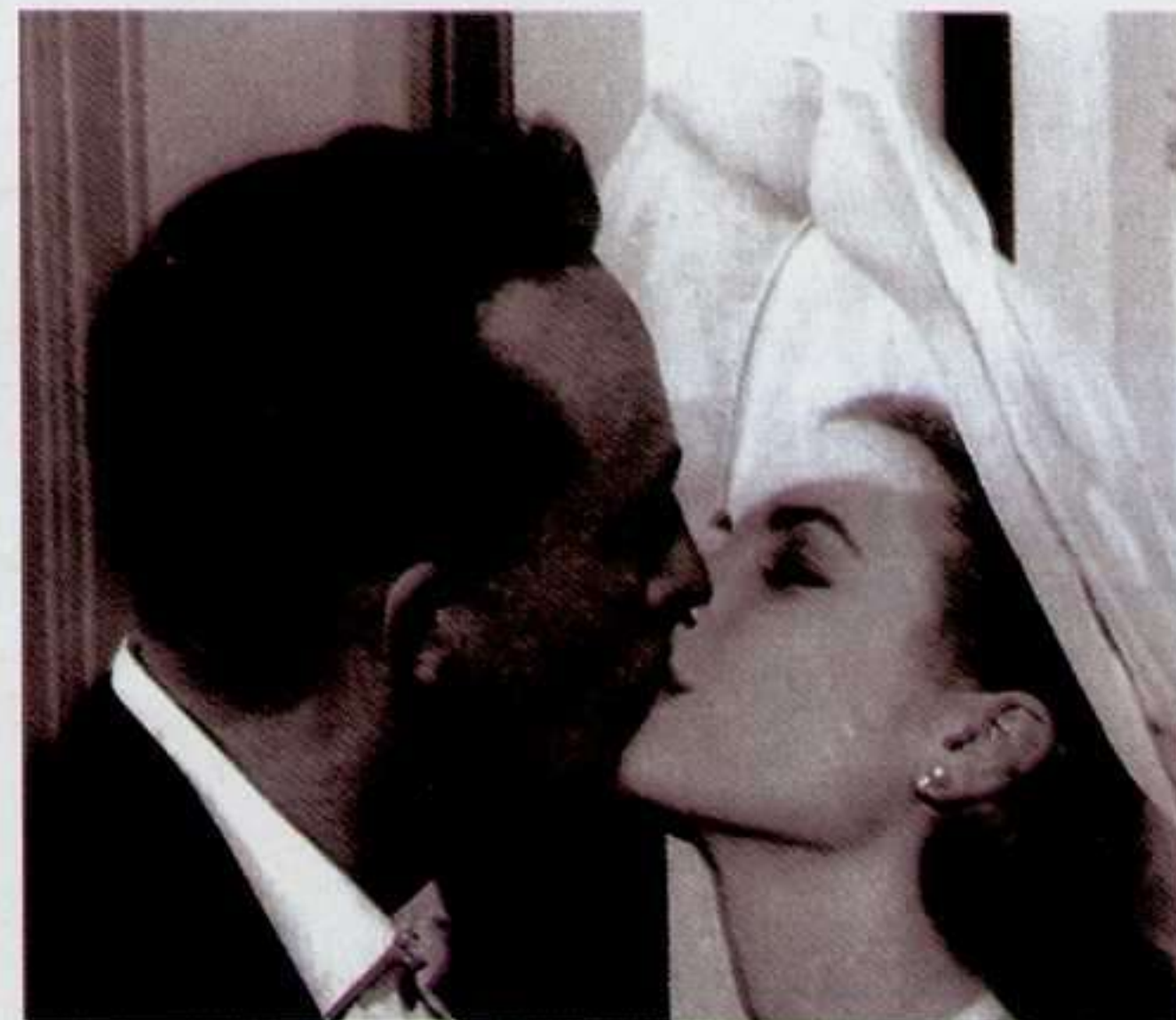
Bing Crosby & Grace Kelly 1956