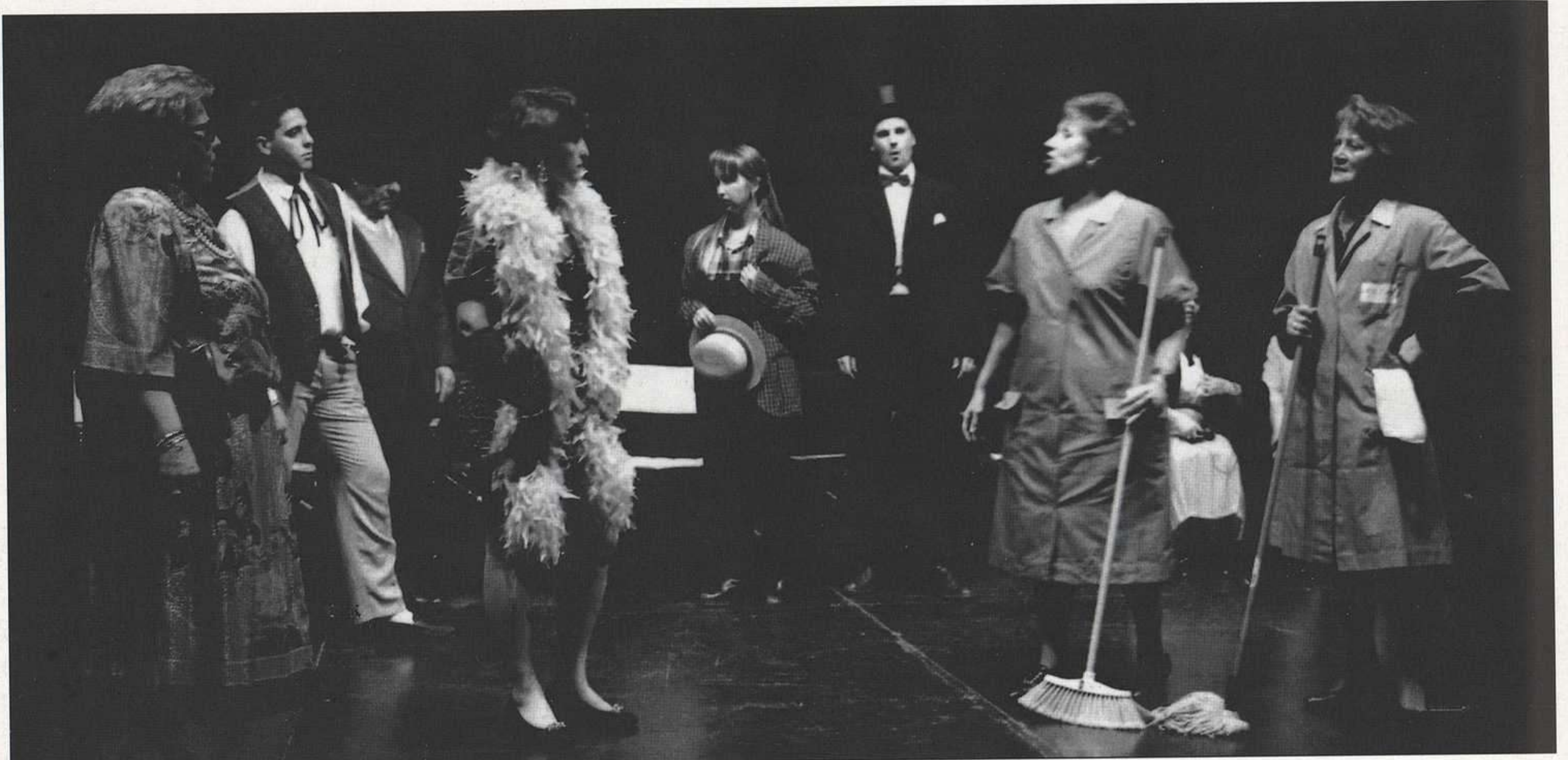
"Pervertimento teatral". Agrupación ONCE «ALAJÚ» de Granada.