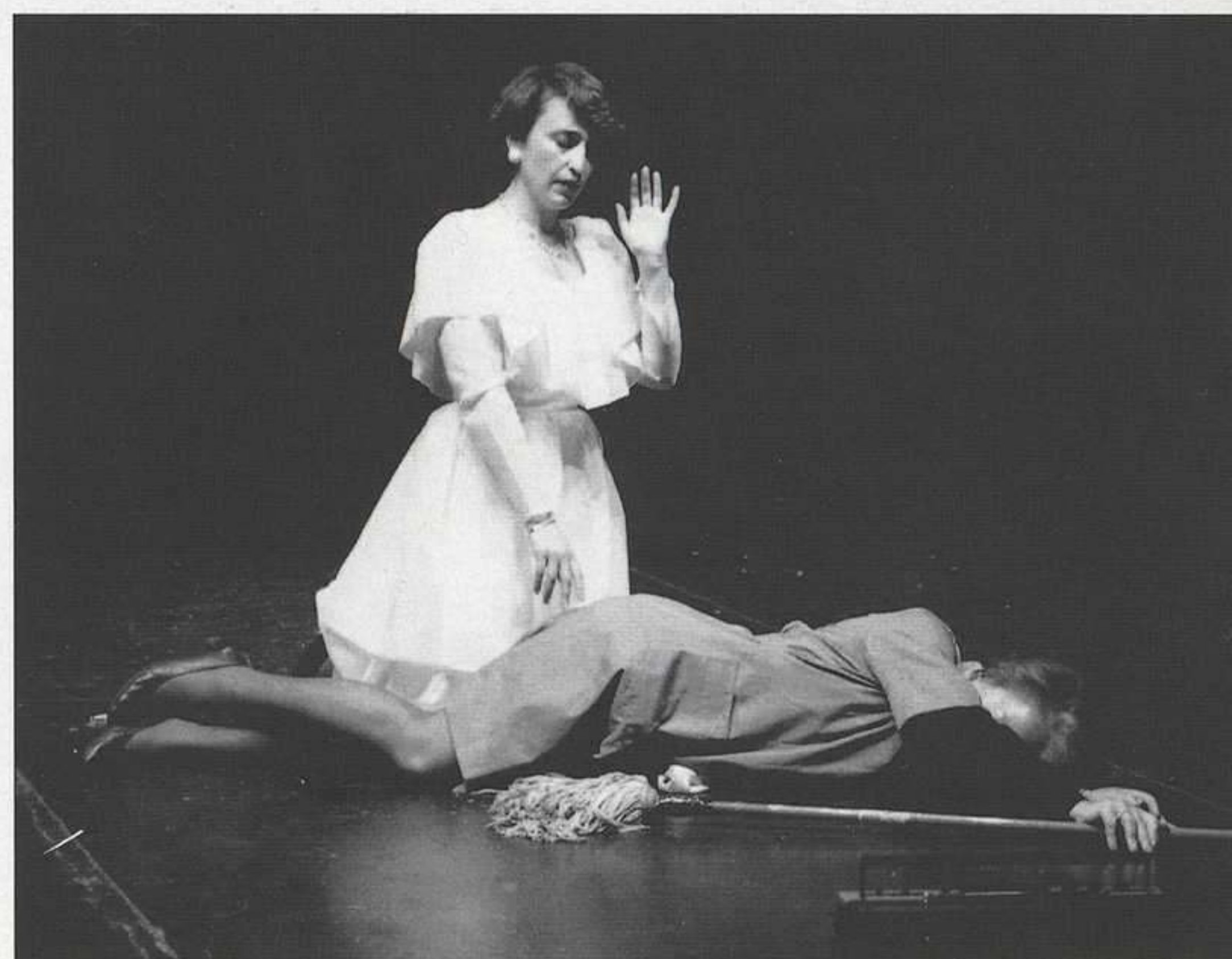
Tres imágenes de "Pervertimento teatral". Agrupación ONCE «ALAJÚ» de Granada