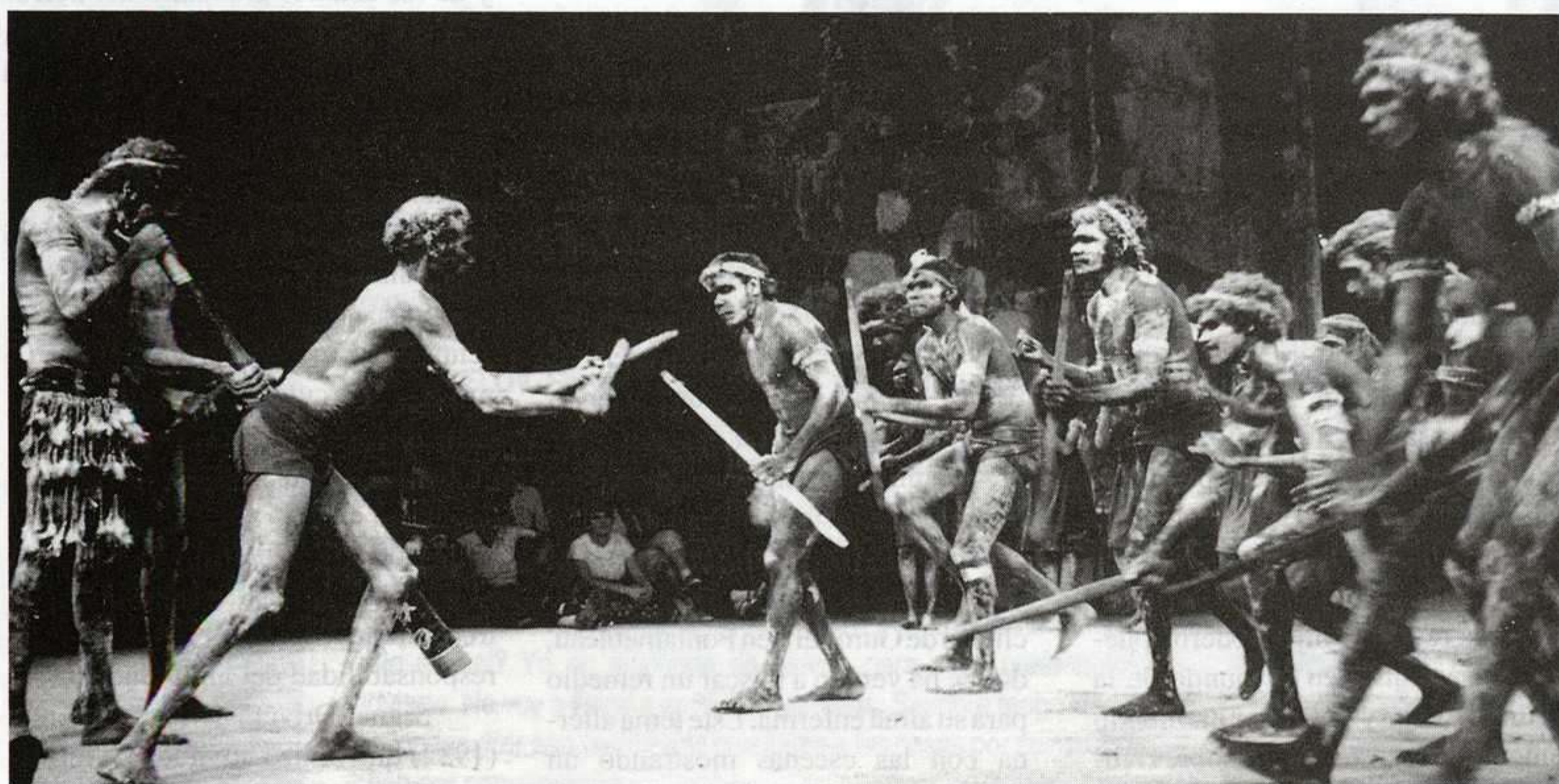
Músicos y actores aborígenes del nordeste de Arnhem Land.

(5) La práctica, común en Australia, del Workshop - taller de trabajo donde se hacen las lecturas, los encuentros, las ubicaciones en el espacio, los ensayos y puestas en escena- significa para los dramaturgos, una oportunidad importante: allí pueden presentar sus nuevas obras, someterlas a discusión, experimentar los primeros ensayos escénicos y, eventualmente, ser tenidos en cuenta para la reducción de la versión definitiva del texto.