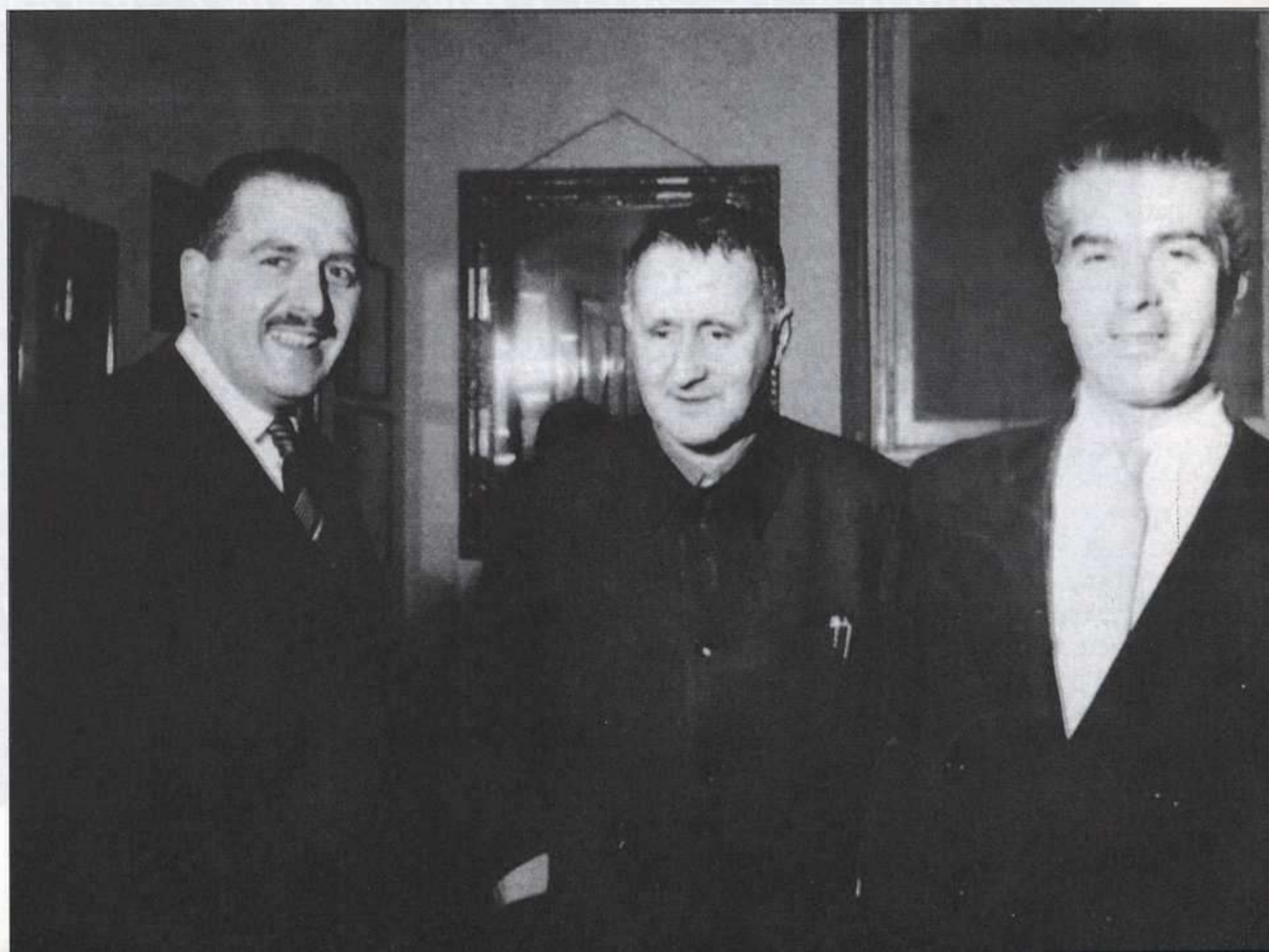
Paolo Grassi y Giorgio Strehler con Bertolt Brecht, en febrero de 1966.