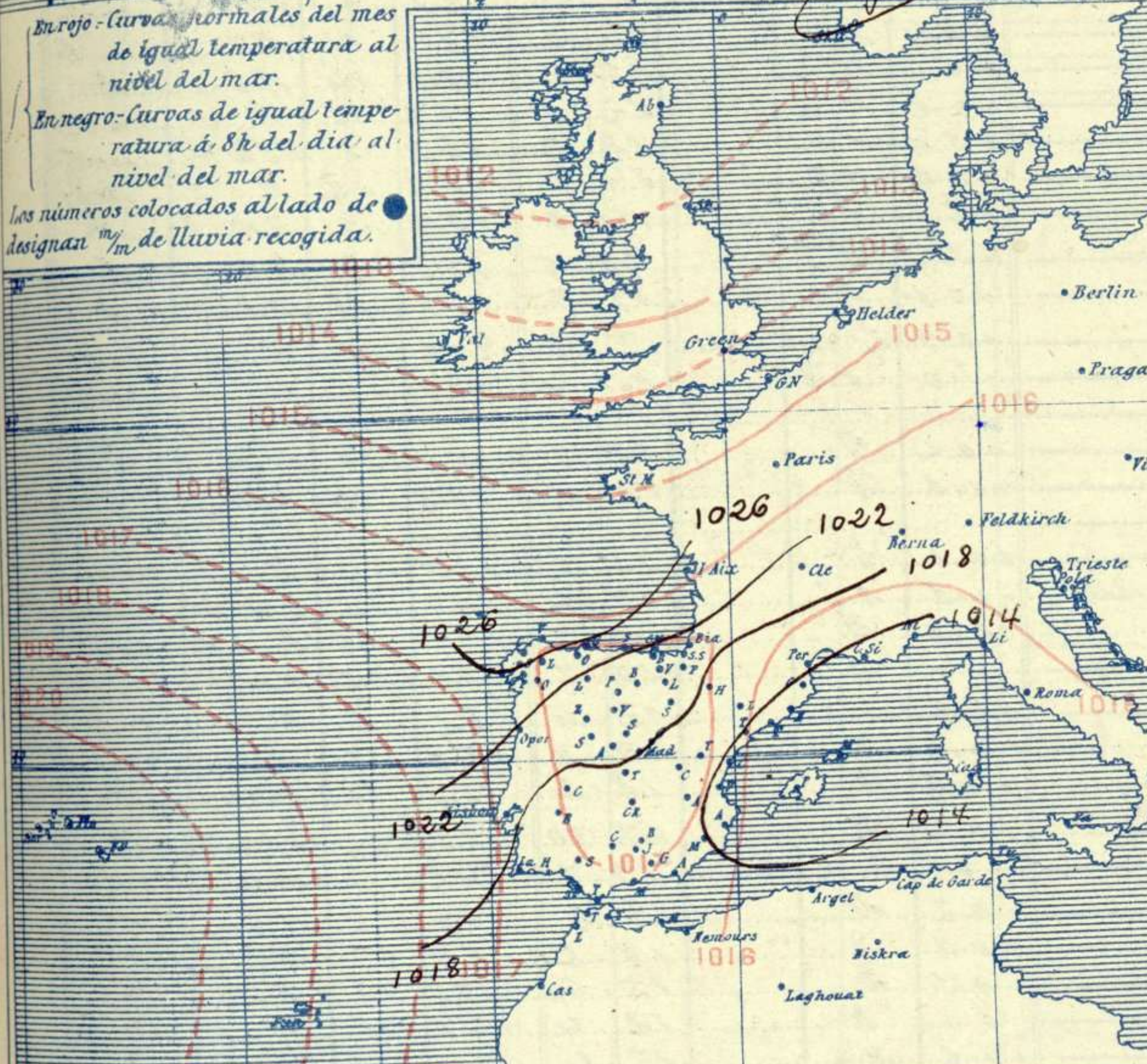
Estado atmosférico de la vispera (Por la tarde)

En rojo - Curvas normales del mes de igual temperatura al nivel del mar. En negro - Curvas de igual temperatura á 8h del día al nivel del mar. Los números colocados al lado de las designan mm de lluvia recogida.