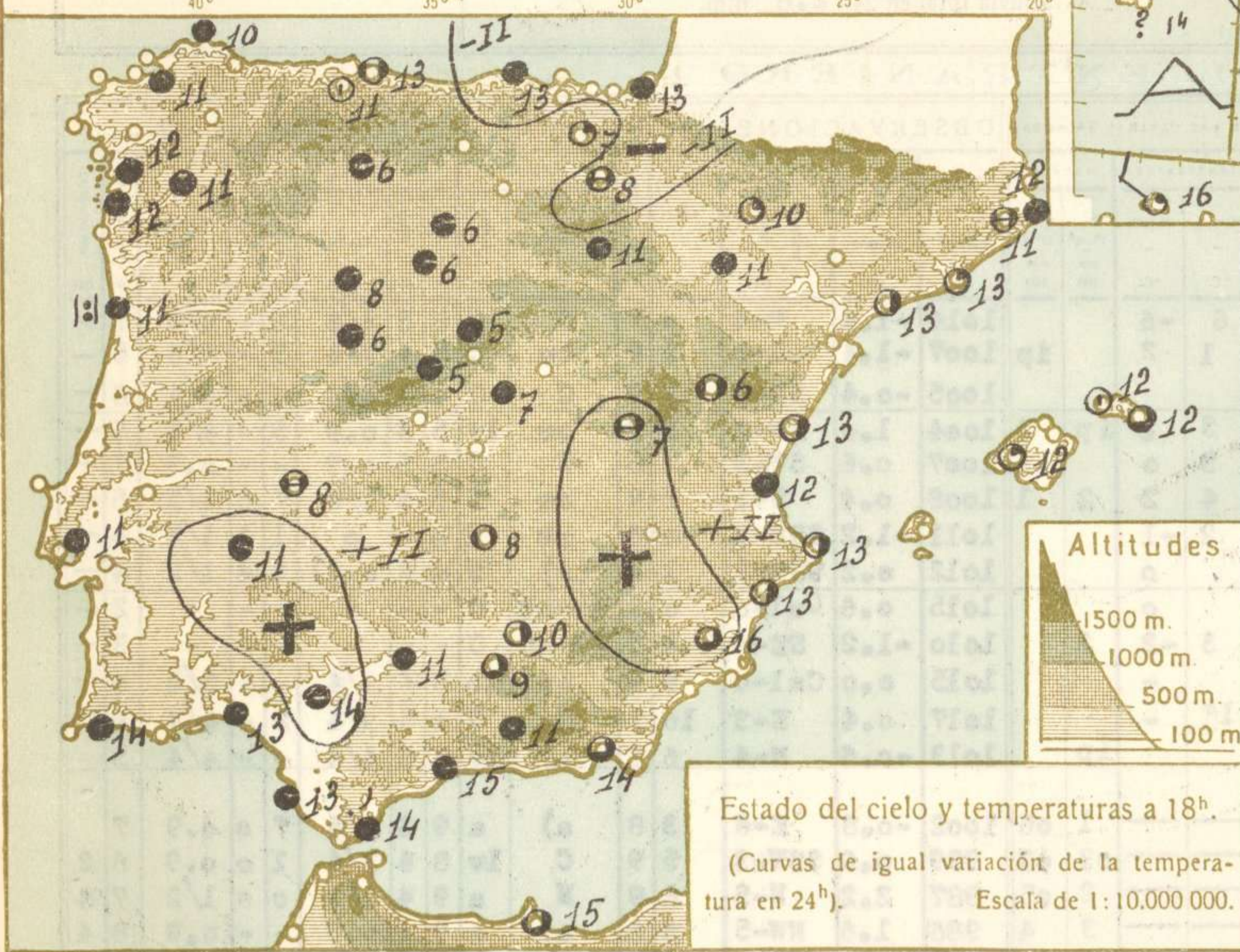
Estado del cielo y temperaturas a 18 h . (Curvas de igual variación de la temperatura en 24 h ). Escala de 1:10.000.000.