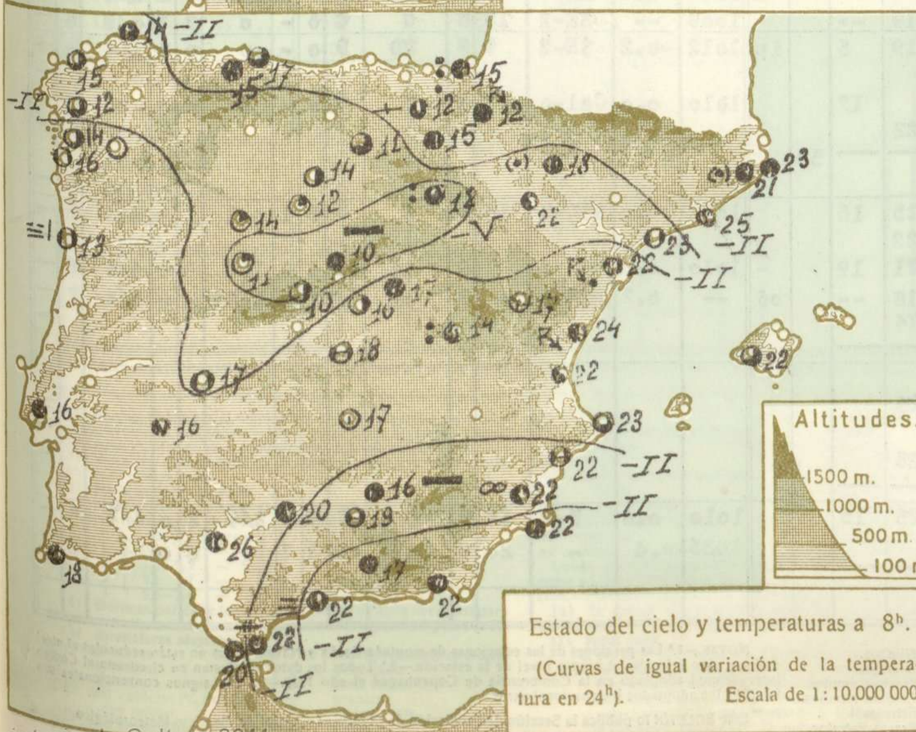
Estado del cielo y temperaturas a 8 h . (Curvas de igual variación de la temperatura en 24 h ). Escala de 1:10.000.000.