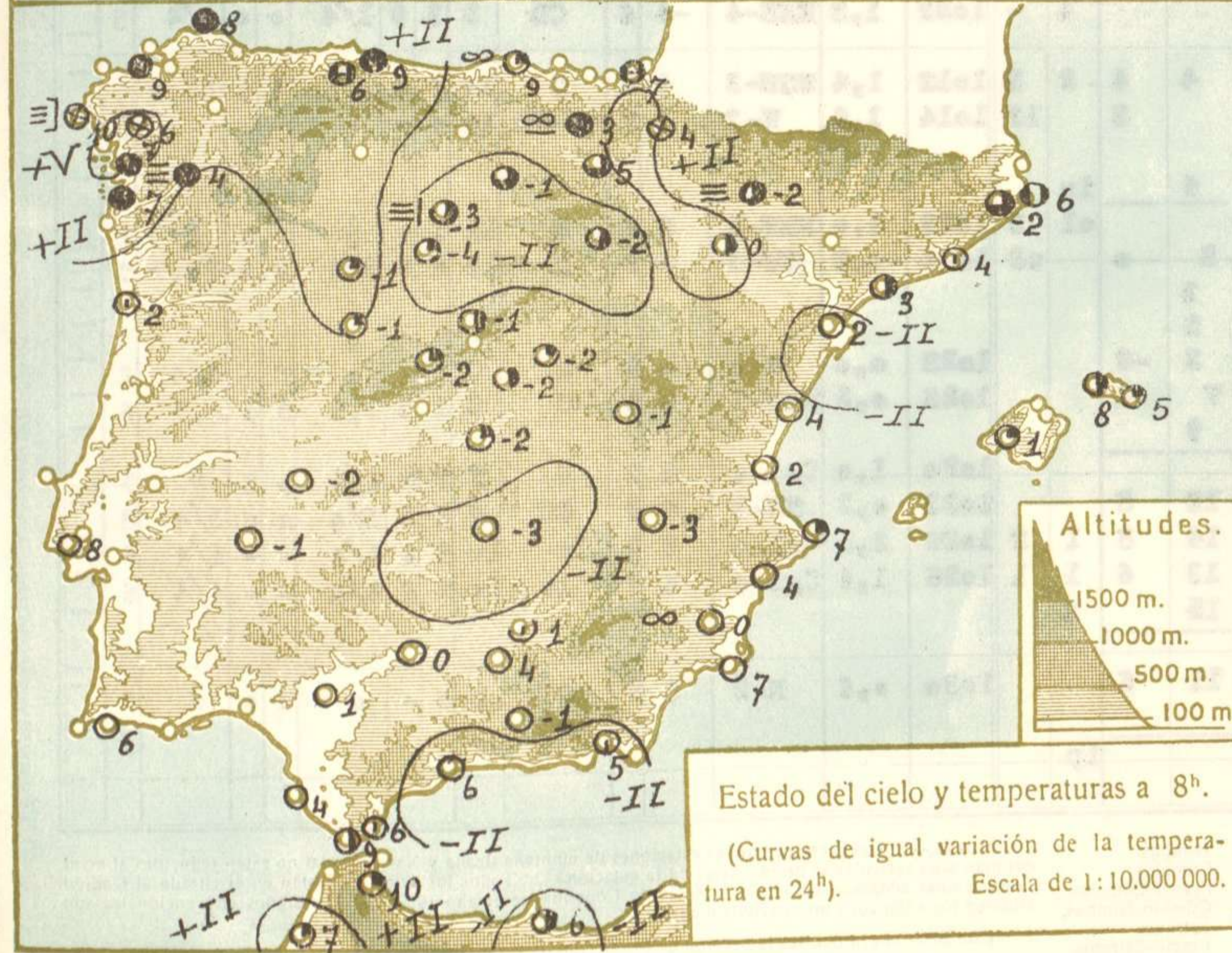
Estado del cielo y temperaturas a 8 h . (Curvas de igual variación de la temperatura en 24 h ). Escala de 1:10.000.000.