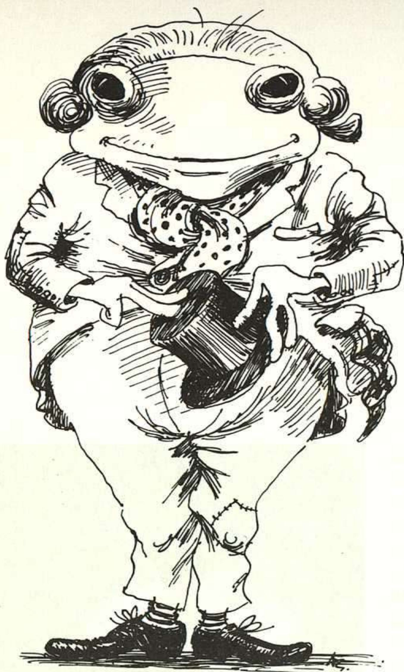
A. SANCHA, EL PAQUETE PARLANTE, ALFAGUARA, MADRID, 1987.

bres salpican por igual las páginas de sus textos.