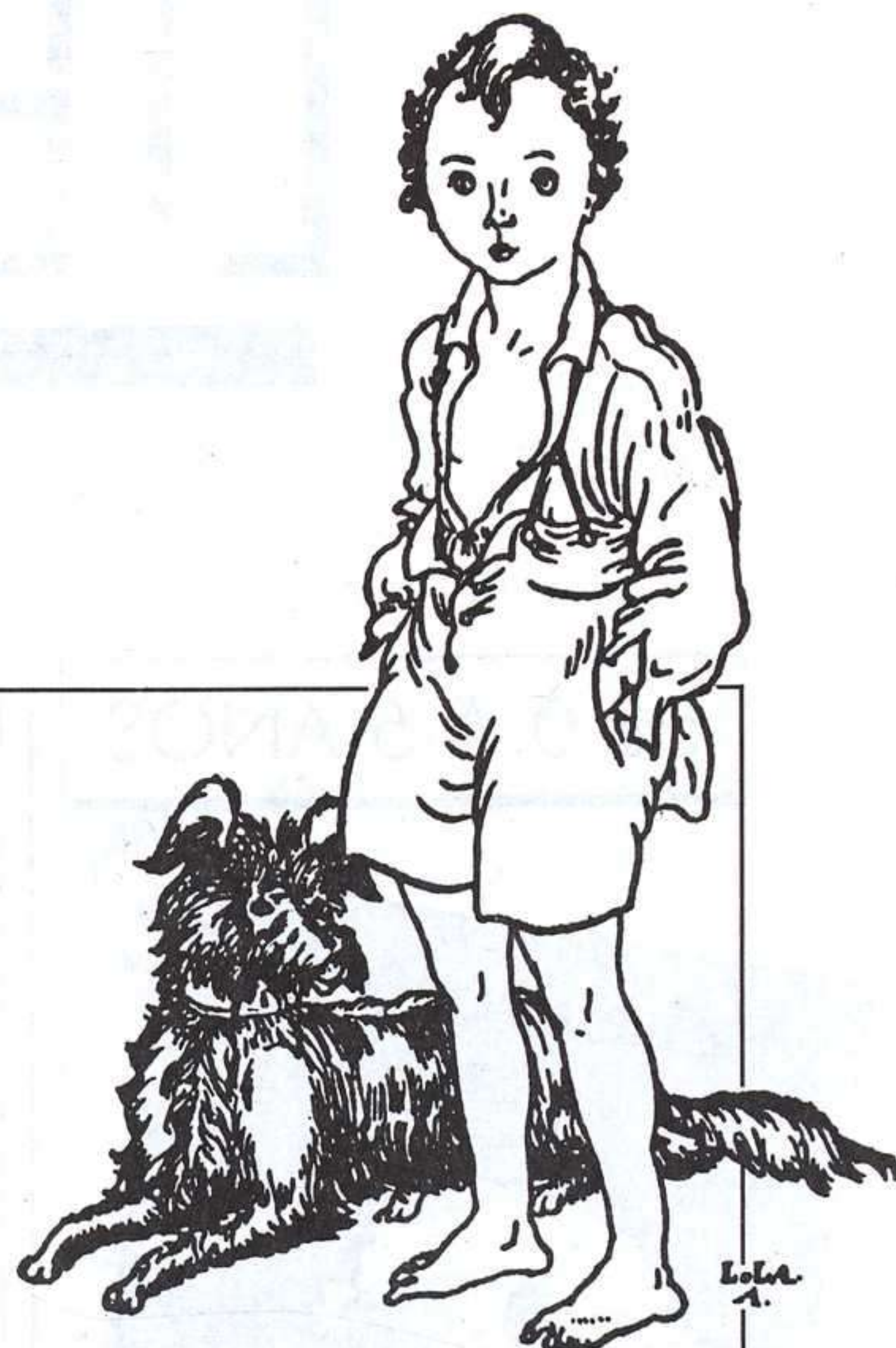
LOLA ANGLADA, EN PERET, BARCELONA: ALTÉS, 1927.