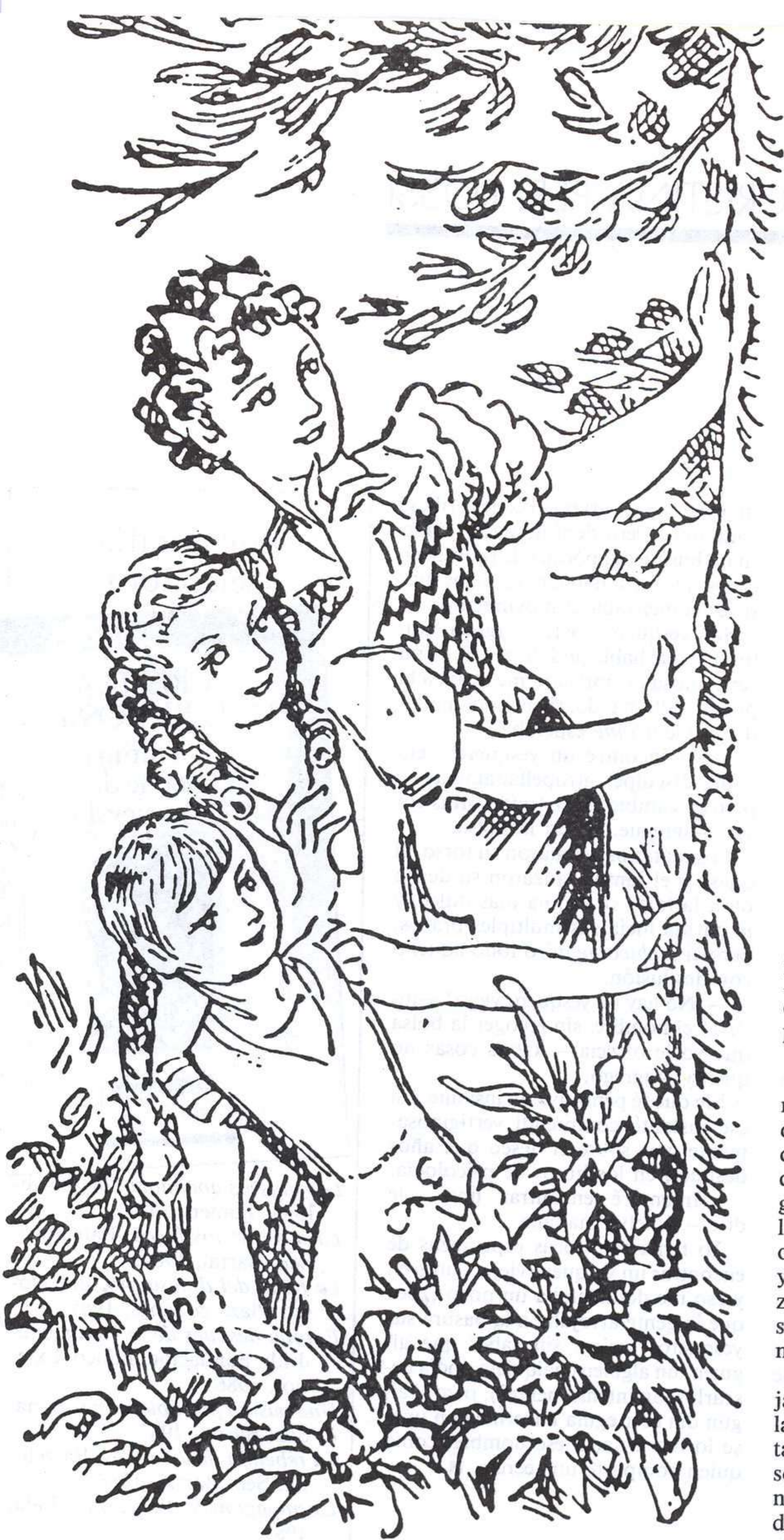
J. JUNCEDA, LES MEMÒRIES DE MARIA VALLMARÍ, BARCELONA: BAGUNYÀ, 1937.

dormían, era el tiempo de la libertad y de la fantasía. Liberada de la presencia de los adultos, llenos de leyes, de normas y de prohibiciones, me sentía una exploradora, una investigadora, dispuesta a conocer el ancho mundo, y a hacer frente a los riesgos y peligros de tal empresa. Por eso, no