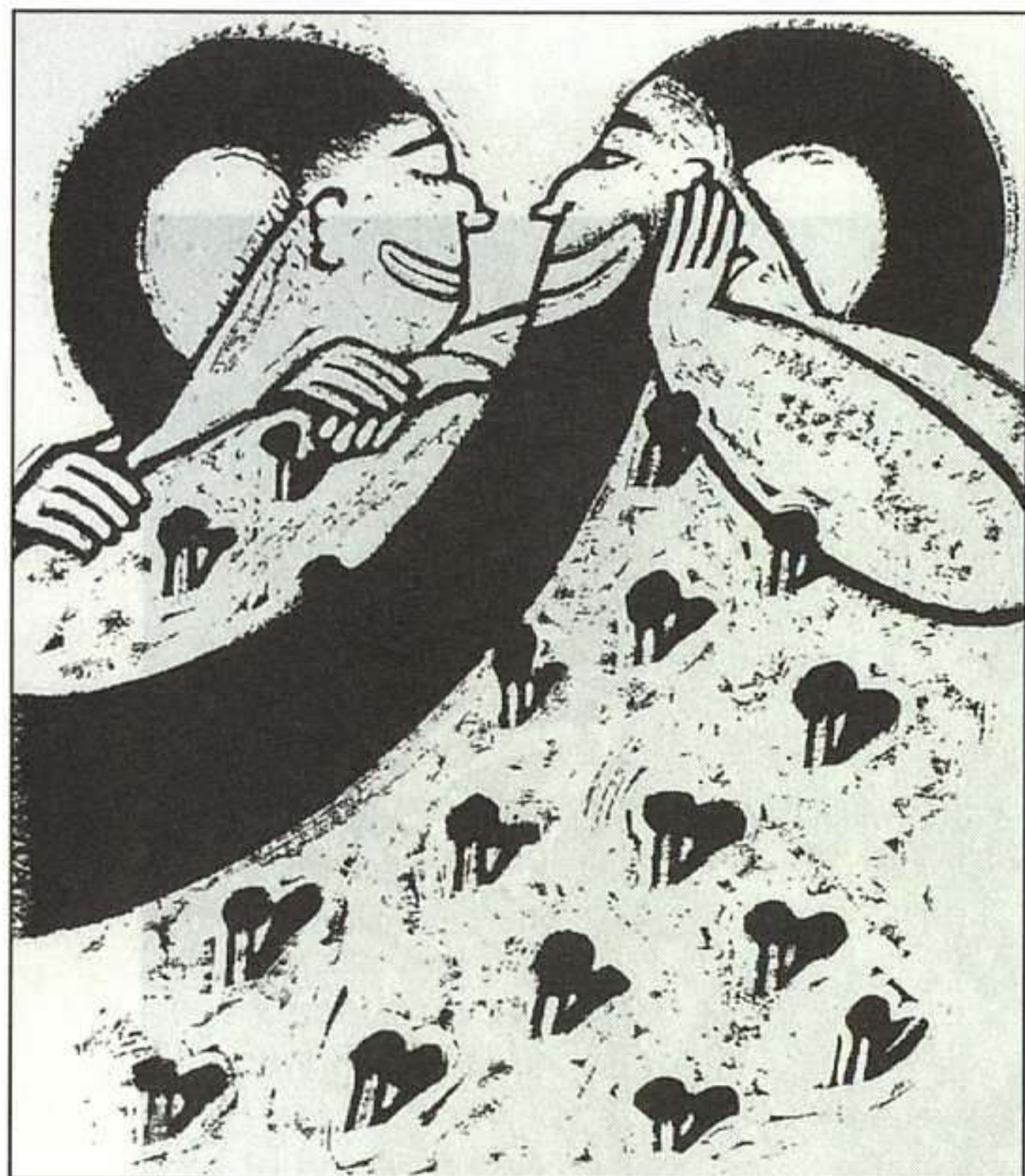
PEP MONTSERRAT, AIXÒ ERA UN GEGANT, LA GALERA, 1994.

puntos de vista. Una niña de 8 años, totalmente cautivada por las desventuras de la desdichada Flordecol, se alegró de «ver» en el último dibujo del libro cómo a la protagonista ya le habían vuelto a crecer las trenzas. Para un adulto es realmente difícil ver esas trenzas, lo que confirma e valor de unas ilustraciones abiertas a la imaginación de sus verdaderos destinatarios. Más que hacer hipótesis y conjeturas sobre si realmente los niños entienden estas ilustraciones, hay que darles la oportunidad de adentrarse en las historias, descubrirlas y disfrutarlas.