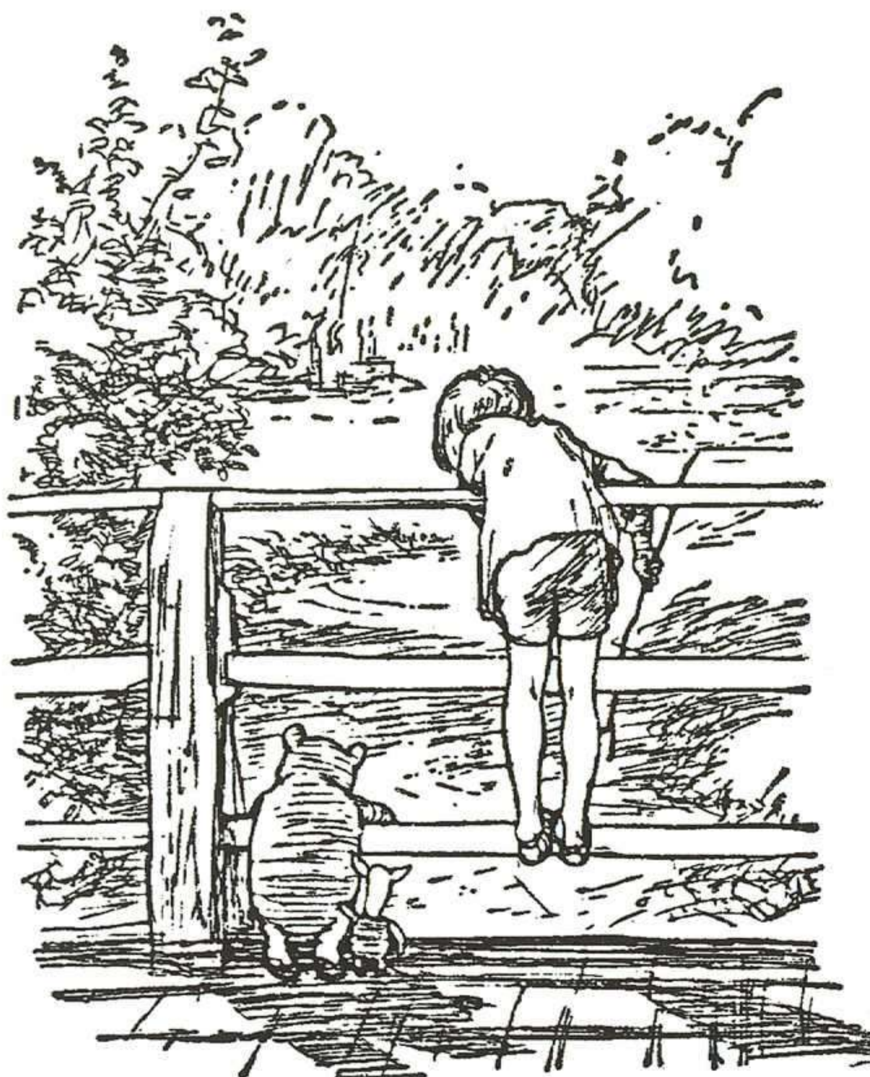
E.H. SHEPARD, LA CASA AL PASSEIG D'EN PU, LA MAGRANA, 1993.

A parte de escribir los pequeños ensayos humorísticos para Punch y de producir un número considerable de obras de teatro, el padre de Winnie-the-Pooh también fue un importante escritor de novelas de misterio, de cuya producción destaca, sin duda, The red house mystery (1922), obra que contribuyó al establecimiento de las características del género detectivesco en lengua inglesa entre la I y la II Guerra mundial. La importancia del libro tiene una doble vertiente. Por un lado, Milne lo escribió con el único objetivo de crear algo que satisficiera las necesidades de aquellos seguidores que, hartos del artificio y el simplismo de la novela de detectives decimonónica,