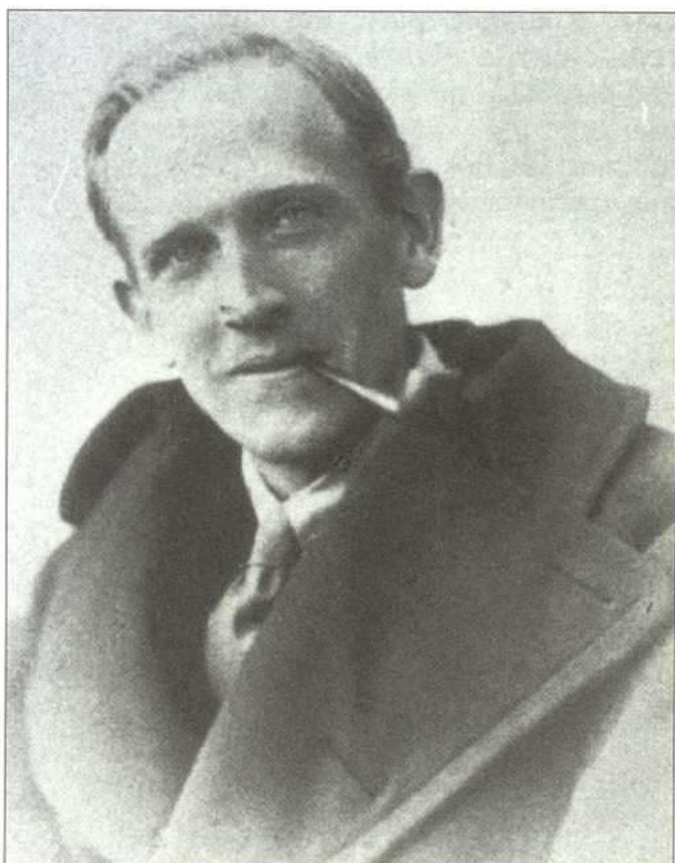
Foto de Milne que apareció en los diarios americanos con motivo del estreno de Mr. Pim Passes by

se editarían en cuatro volúmenes independientes en 1910, 1912, 1914 y 1921.