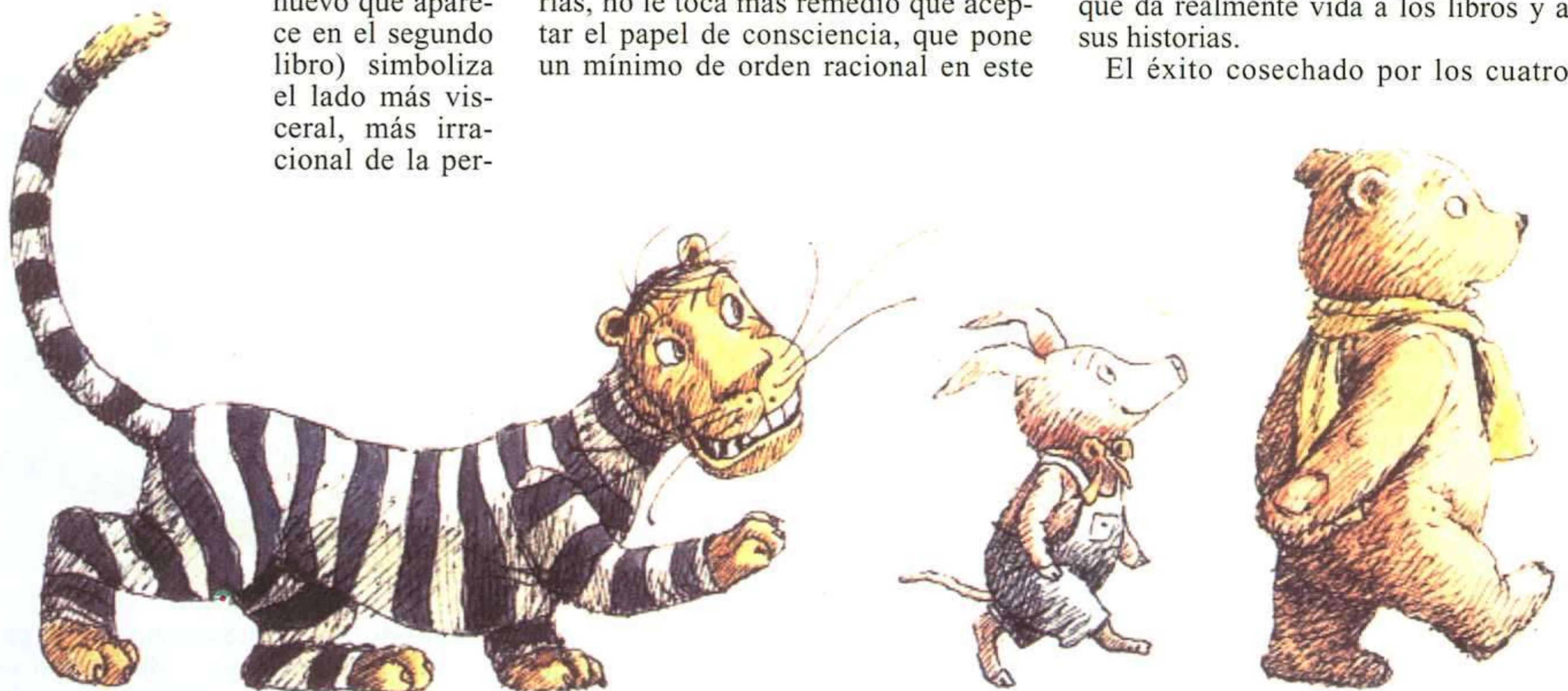
BORIS DIÓDOROV, EL MUNDO DE PUFF, ANAYA, 1989.