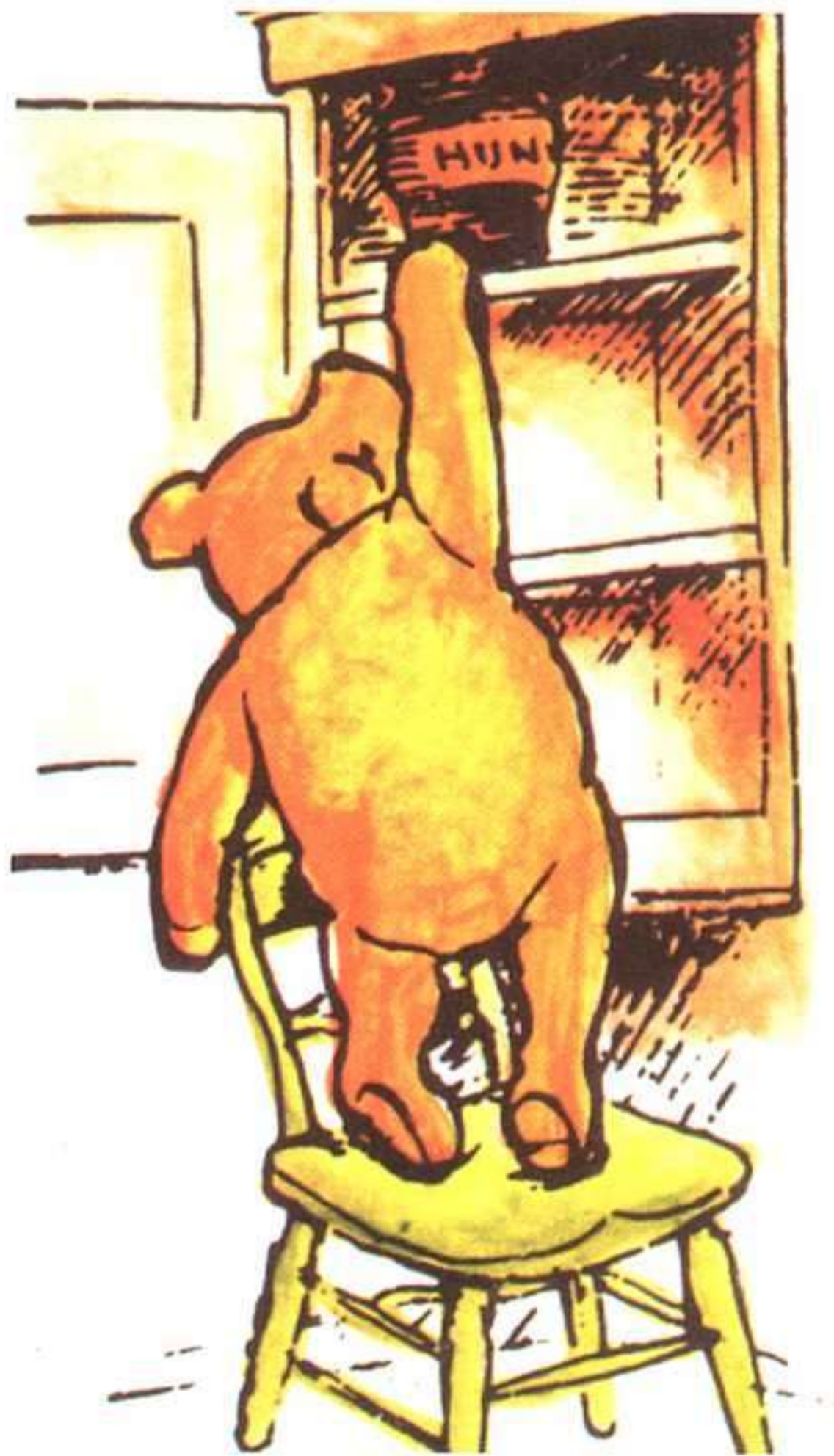
E.H. SHEPARD, THE HUMS OF POOH, METHUEN CHILDRENS BOOKS, 1983.

único personaje nuevo que aparece en el segundo libro) simboliza el lado más visceral, más irracional de la per-