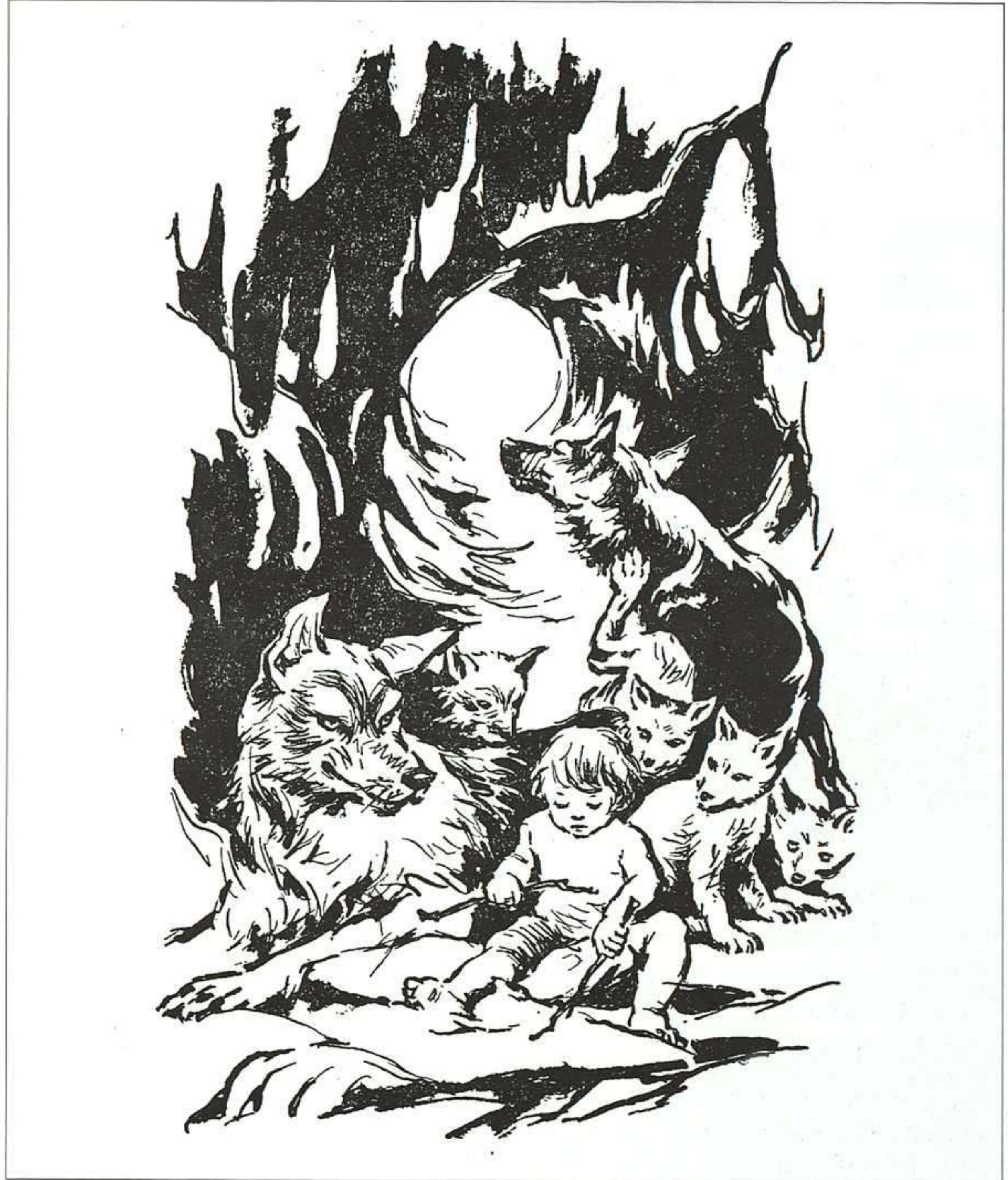
FRANCESC ALMUNI, PRIMER LIBRO DE LA SELVA, SELECTA, 1962.

metió el año siguiente, y no sólo para los mayores (aunque no contaría en ella el matrimonio de Mowgli, sino sólo su marcha de la selva hacia el mundo del hombre), se dedicó a las aventuras marineras con The seven seas y Capitanes intrépidos .