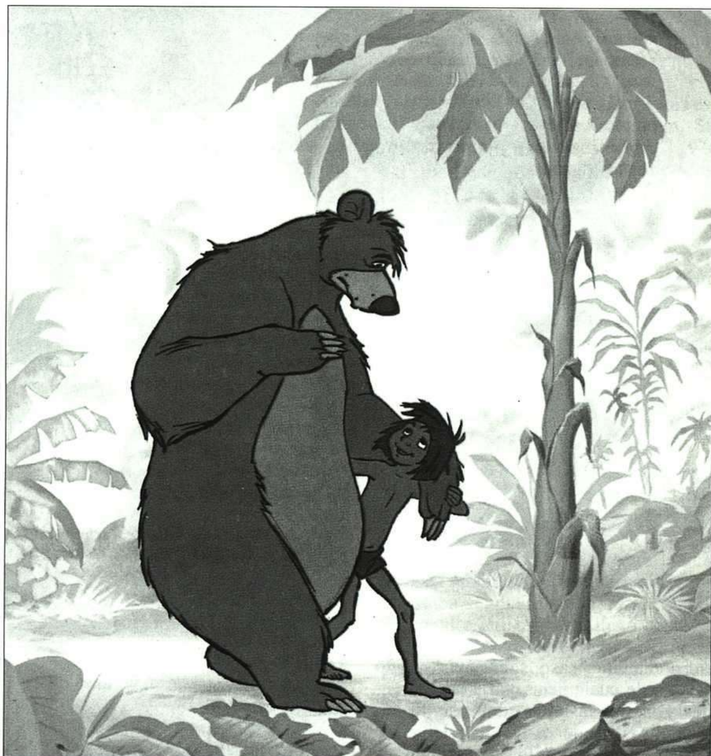
WALT DISNEY, EL LIBRO DE LA SELVA, GAVIOTA, 1986.

Una obra que es sátira, es cantar de gesta, es música y poesía, es fábula sobre una selva que es el mundo. Pero, ¿es una novela? Los críticos lo han discutido. Algunos consideran que sólo escribió una, Kim , o quizá dos, si concedemos a En tinieblas el derecho a llamarse así. Realmente, no alcanza uno a comprender a qué otro género literario pue-