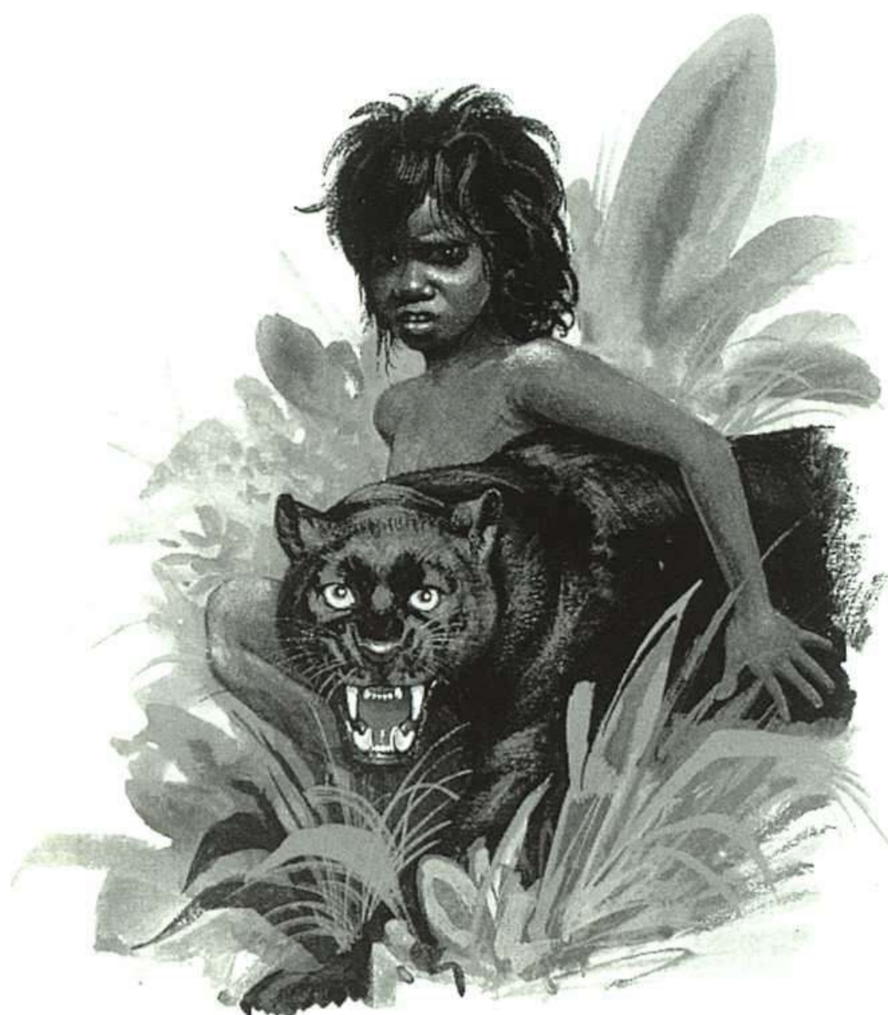
CHRISTIAN BROUTIN, EL LIBRO DE LA SELVA, SM, 1996.