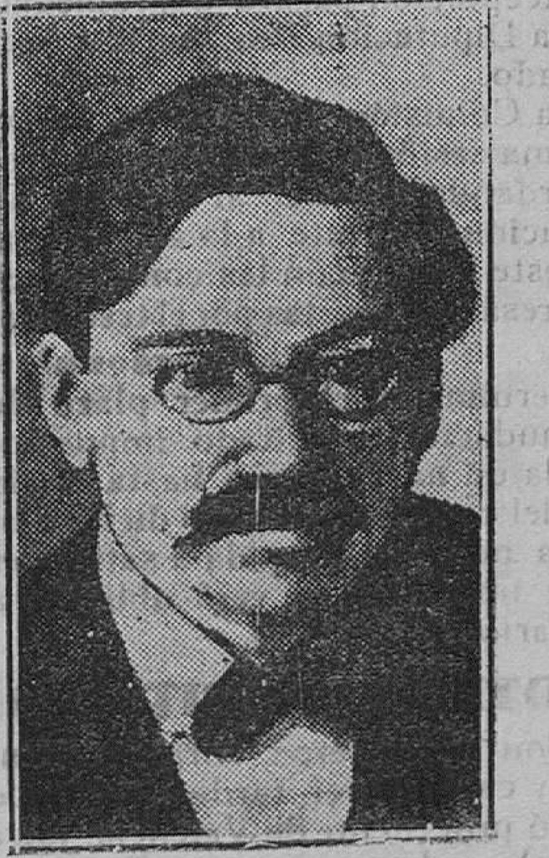
Mejinsky, jefe de la Guepen, que con Rykoff y Borochilow dirige el movimiento revolucionario contra el dictador rojo Stalin

Sigue sin solucionar la crisis del Gobierno francés. El senador demócrata Mr. Steeg, Residente General que fué de Francia en Marruecos; ha sido llamado por Doumergue para conjurar la situación y aun cuando las últimas impresiones no dan detalles de las gestiones realizadas, es probable que no logre lo que Mr. Laval no ha podido conseguir.