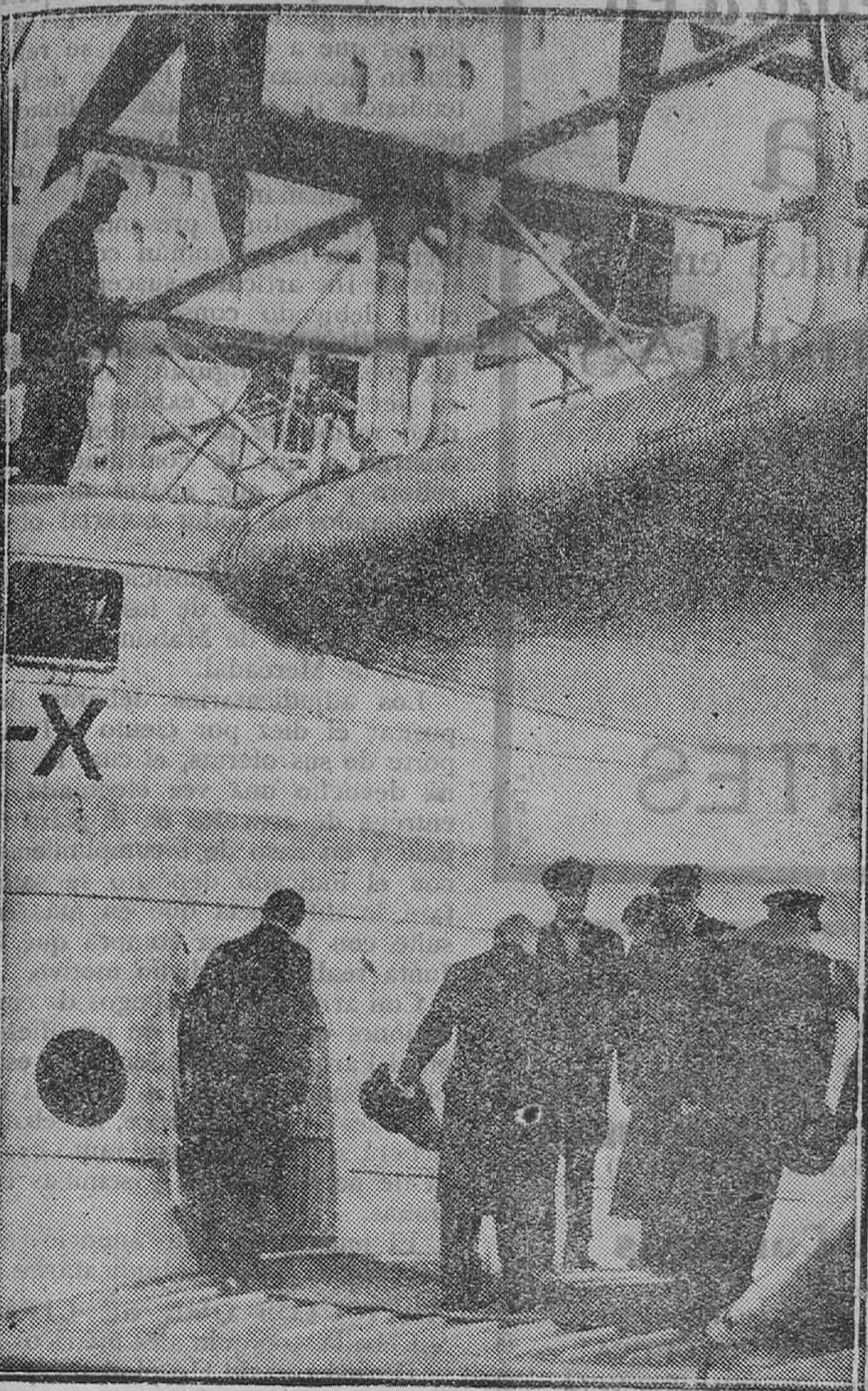
La avería que ha tenido en Lisboa el «Do. X.» y su reciente paso por España siguen dando actualidad a cuanto se refiere con este gigantesco aparato. La fotografía nos muestra al Príncipe de Gales embarcando en Calshot en el hidroavión en que voló por espacio de más de media hora.