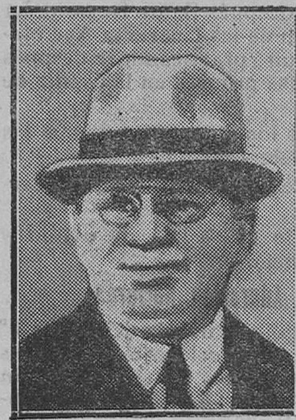
EXTRANJERO. — El Comisario del Pueblo, Litvinof, que en representación de la U. R. S. S. asiste a la reunión del Comité que prepara la Conferencia del desarme