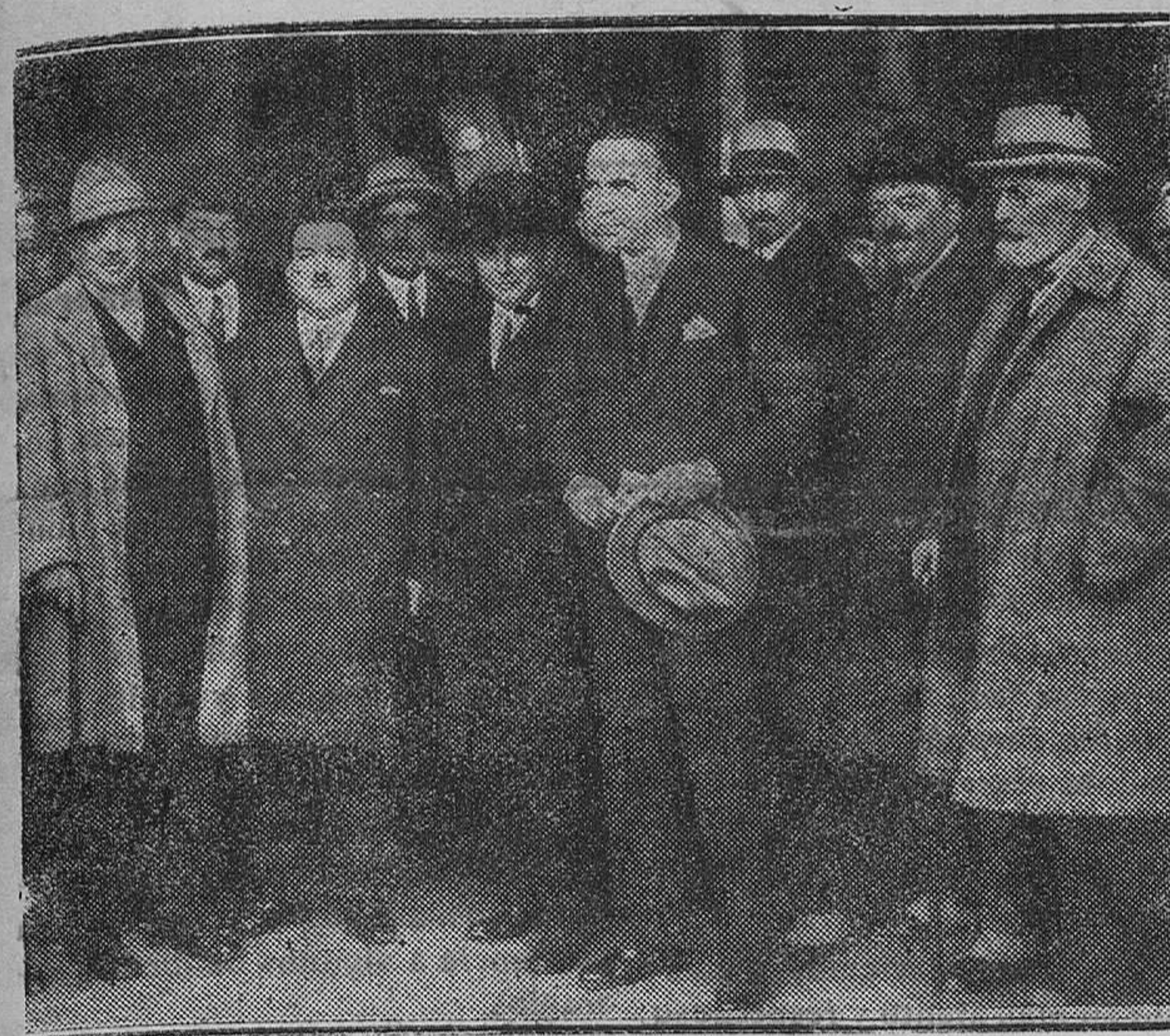
MADRID.—Grupos de periodistas franceses llegados días pasados a esta Corte