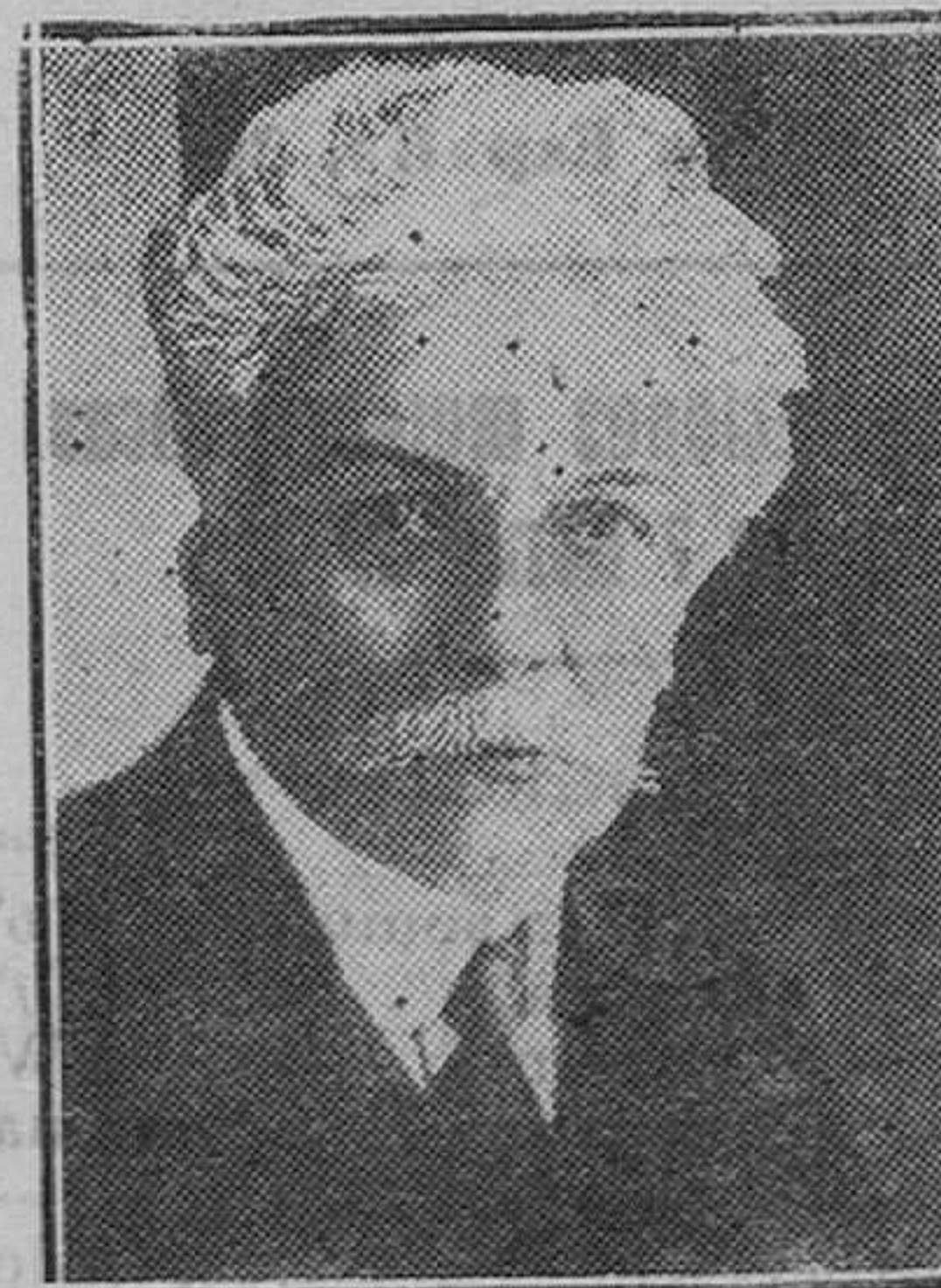
BRUSELAS.—M. Jaspar, primer ministro belga que recientemente ha presentado la dimisión de su Gabinete