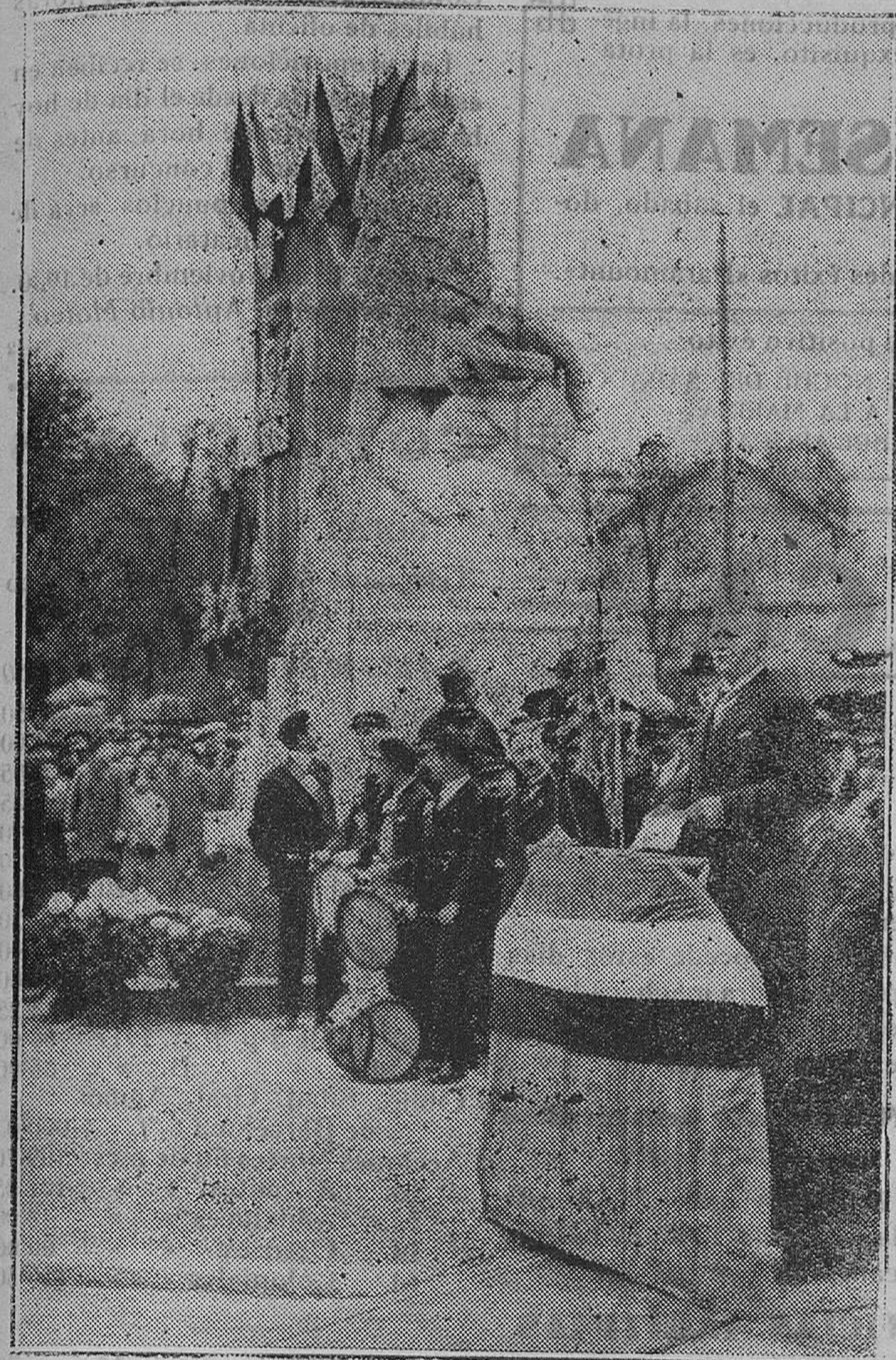
En Auscense se ha levantado un monumento al «veterano» más viejo del Ejército francés. Al acto asistió representando al Gobierno el subsecretario de Estado de Guerra, señor Ricalfi, que se ve en la foto pronunciando un discurso inaugural

que la Nación esté integrada por esos voceros que con sus gritos y necias amenazas intentan dar una sensación completamente ficticia. El país, el pueblo no lo integran únicamente los que gritan y actúan de espantados que contra la acción perturbadora y estéril de estas gentes, se levantan murallas mucho más sólidas y con más firmes basamentos que los egoísmos o ambiciones que animan a los «valientes de ahora» que mañana volverían a ser los de ayer.