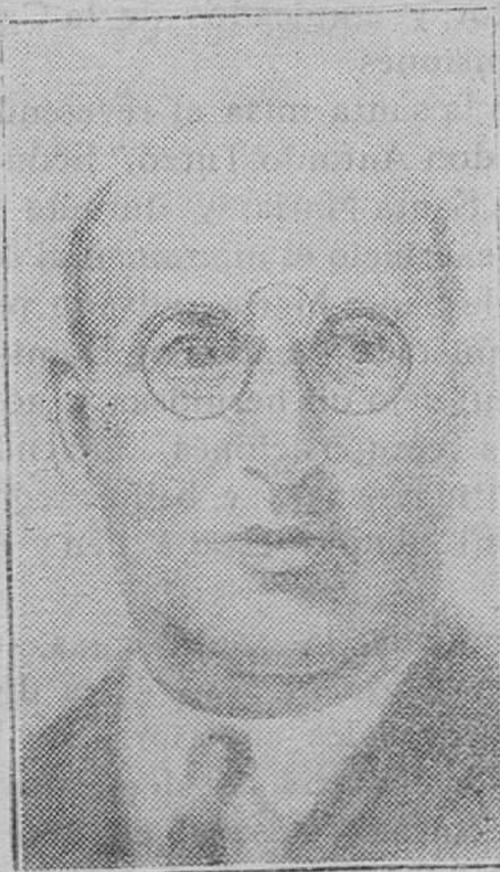
El excelentísimo señor don Enrique Martínez, ex Vicepresidente de la República argentina, que ha presentado la dimisión del cargo

Por desgracia, es muy cierto que el comunismo se filtra, sobre todo en esos pueblos a medio civilizar; más no es menos cierto que «desde hace quince años la industrialización rápida de las colonias francesas, británicas, holandesas y belgas ha introducido en ellas abusos».