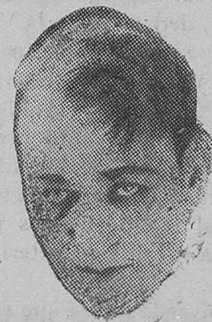
Lon Chaney cuyo verdadero nombre era Harry Campbell, contaba en la actualidad cuarenta y siete años de edad, pues vió la luz en Colorado Spring (Estados Unidos) el día 1.º de Abril de 1883

Dado en Santander a 20 de agosto de 1930.—Alfonso.—El ministro del Ejército: Dámaso Berenguer y Fusté.