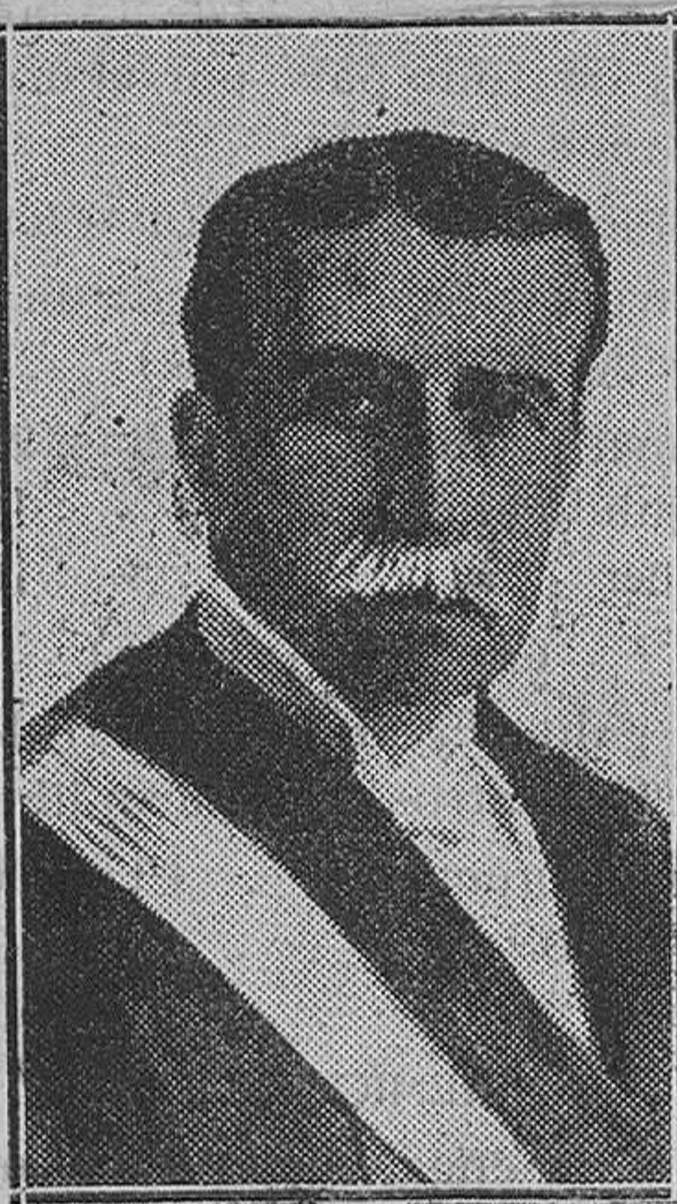
El ex Presidente de la República del Perú don Augusto. B. Leguía, depuesto por un golpe de Estado

No está el mundo ni aún después de los horrores de la última guerra, preparado para concebir propósitos de paz. El fermento de odios que parecía extinto burbujea en el fondo de las conciencias y en lo íntimo de los regímenes gobernantes. Y harto es ya acallarlos y tratar de extirparlos como se viene haciendo para que pretendamos lo que es aun prematuro y acaso perjudicial como la guerra misma.