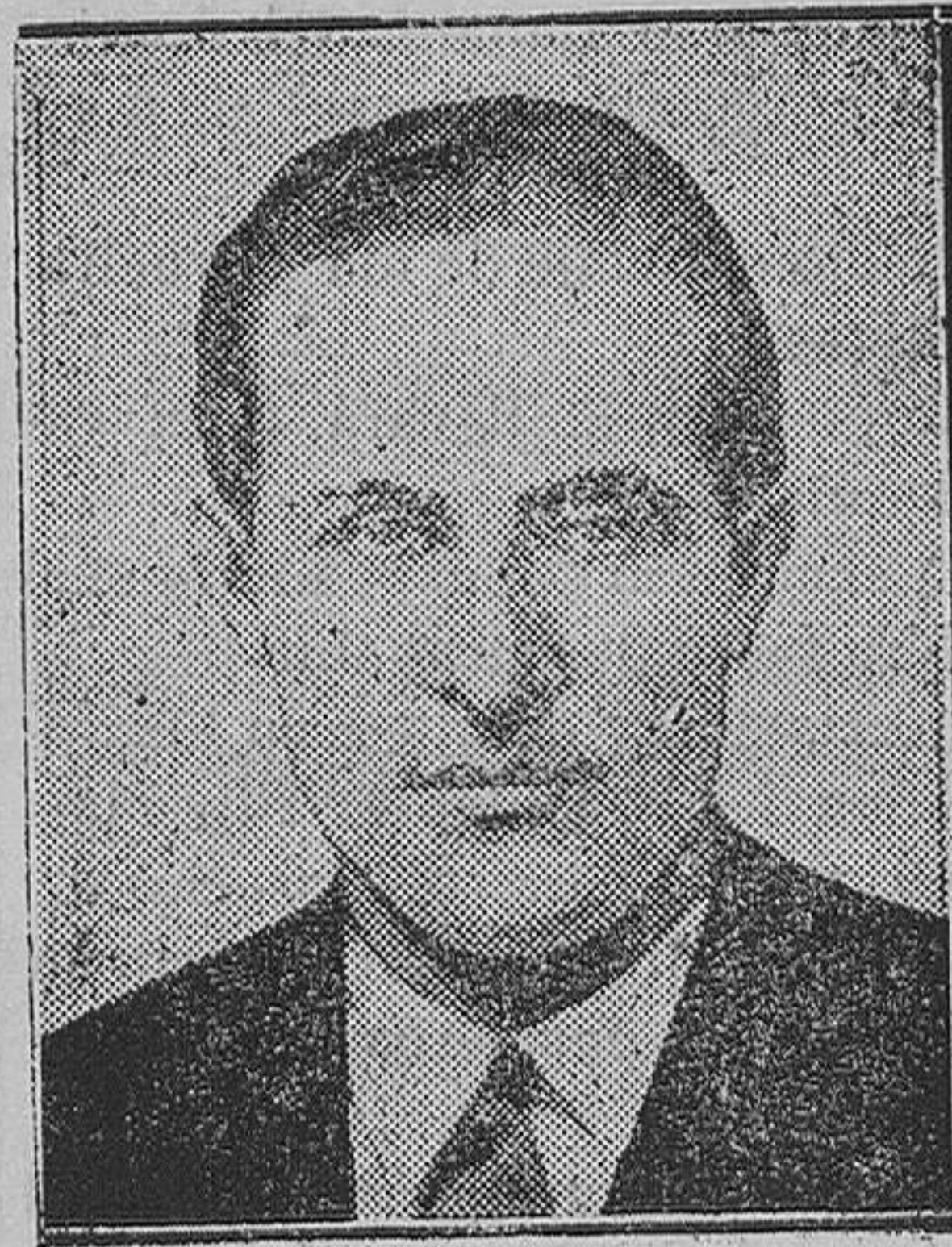
EXTRANJERO.—Mermoz, aviador francés que al intentar la travesía del Atlántico Sur, se vió precisado a amarar en pleno mar

Hotel An-onia, Nueva York, julio de 1930.