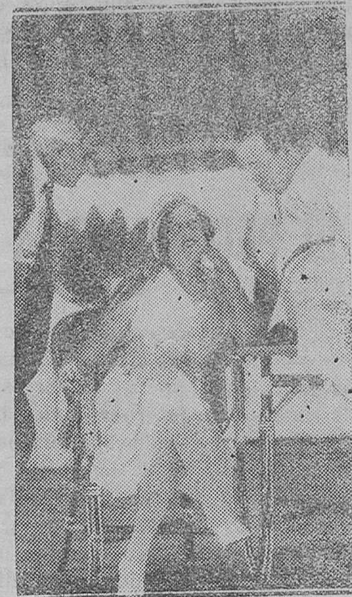
MADRID.—Teatro de la Comedia.—Una escena de la obra «La mar y sus peces» que se estrenó en dicho teatro