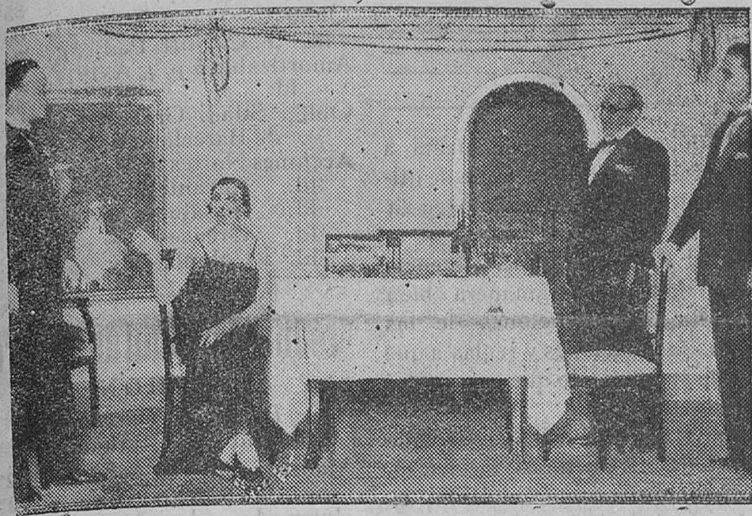
TEATRO BARCELONA.—Compañía del teatro «Infanta Isabel» de Madrid, en una escena del segundo acto de la obra «La noche loca», de Honorio Maura, estrenada en España