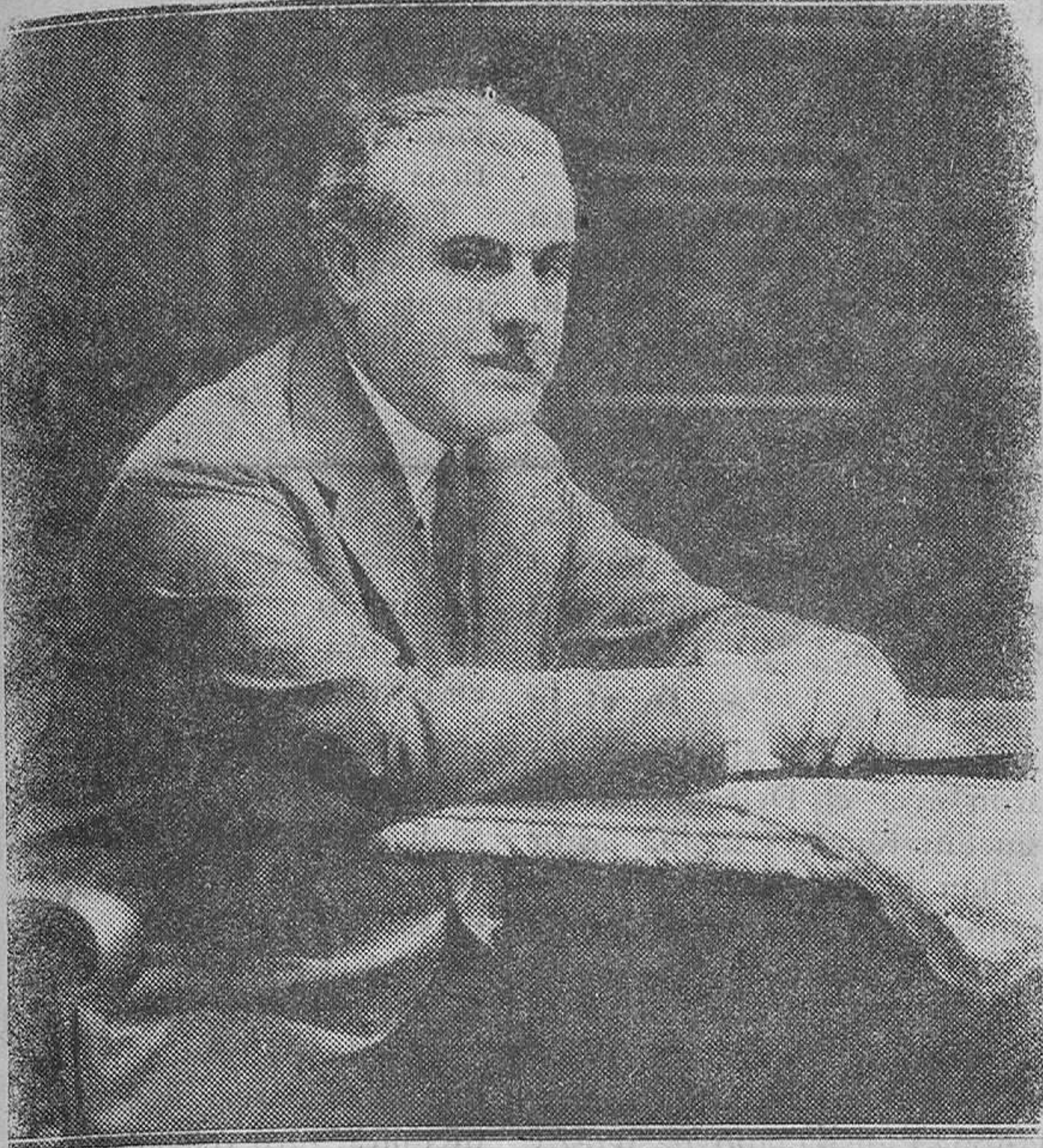
MADRID. — El ex ministro conde de Guadalhorce, proclamado jefe del partido de Unión Monárquica Nacional