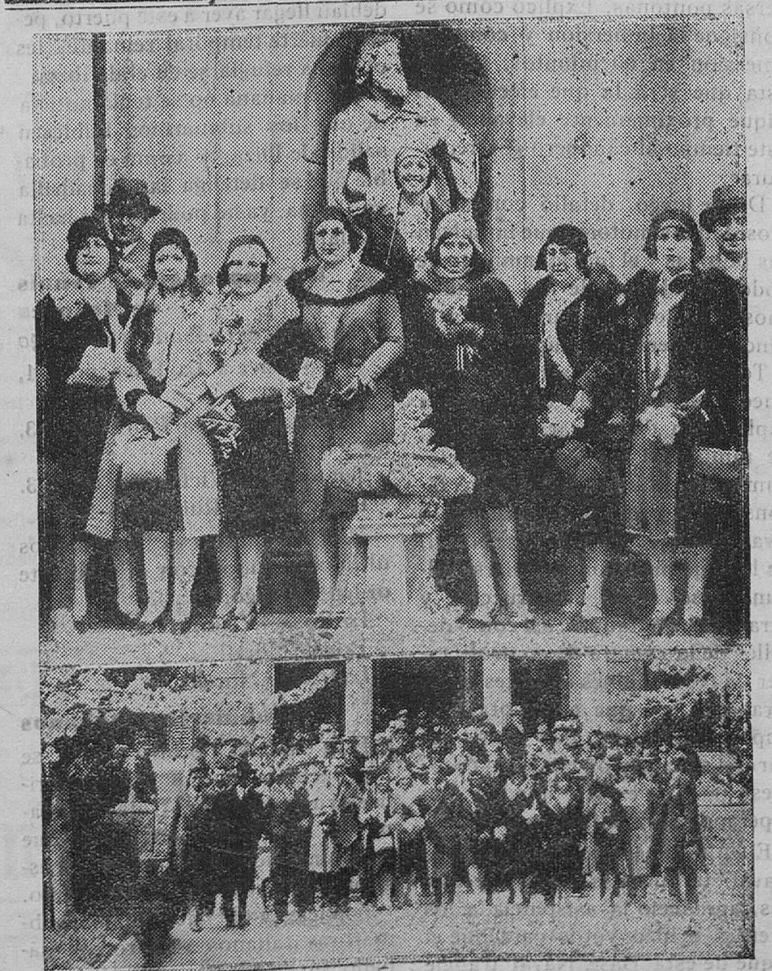
DESPEDIDA A LOS PERIODISTAS HISPANOAMERICANOS. — Arriba: grupo de bellas señoritas, acompañantes de los periodistas hispanoamericanos en el patio de los Evangelinos, durante la visita que hicieron a El Escorial. — Abajo: Los excursionistas al salir de la Casa del Príncipe

España es, como muy acertadamente dice en su declaración ministerial el Gobierno del general Berenguer, la que reclama, la que exige, la que nos impone a todos un deber, la que demanda el máximo esfuerzo de la ciudadanía y por el buen nombre de la Patria, inspirador de tantos y tantos heroísmos, de tantas y tan nobles gestas, los españoles sabrán plétóricos de amor y fe, encendidos por el más noble entusiasmo, aprestarse a la lucha y luchar con denzaco para obtener