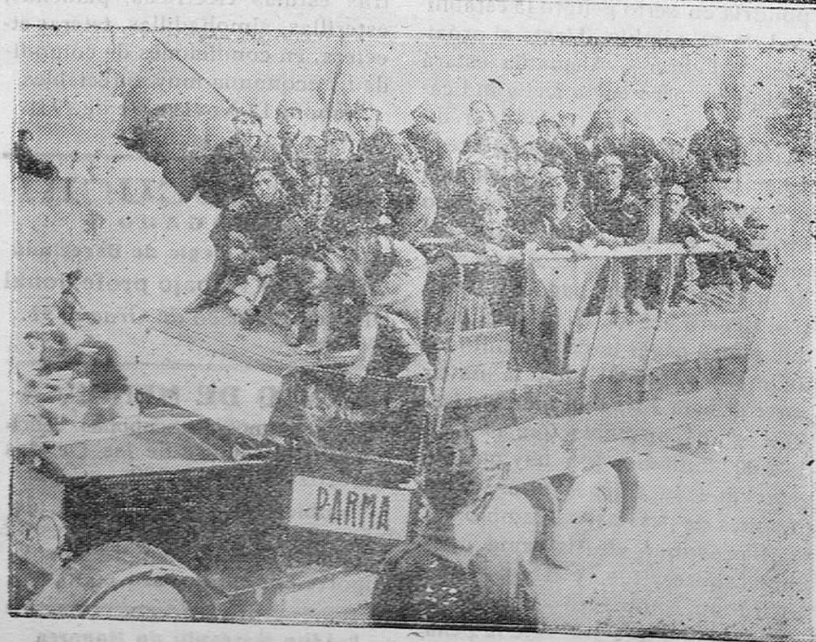
EXTRANJERO. — Detalles de la excursión de 40 000 jóvenes fascistas a Roma. — Momento de la llegada de uno de los autobuses al campamento establecido en Via Nomentana