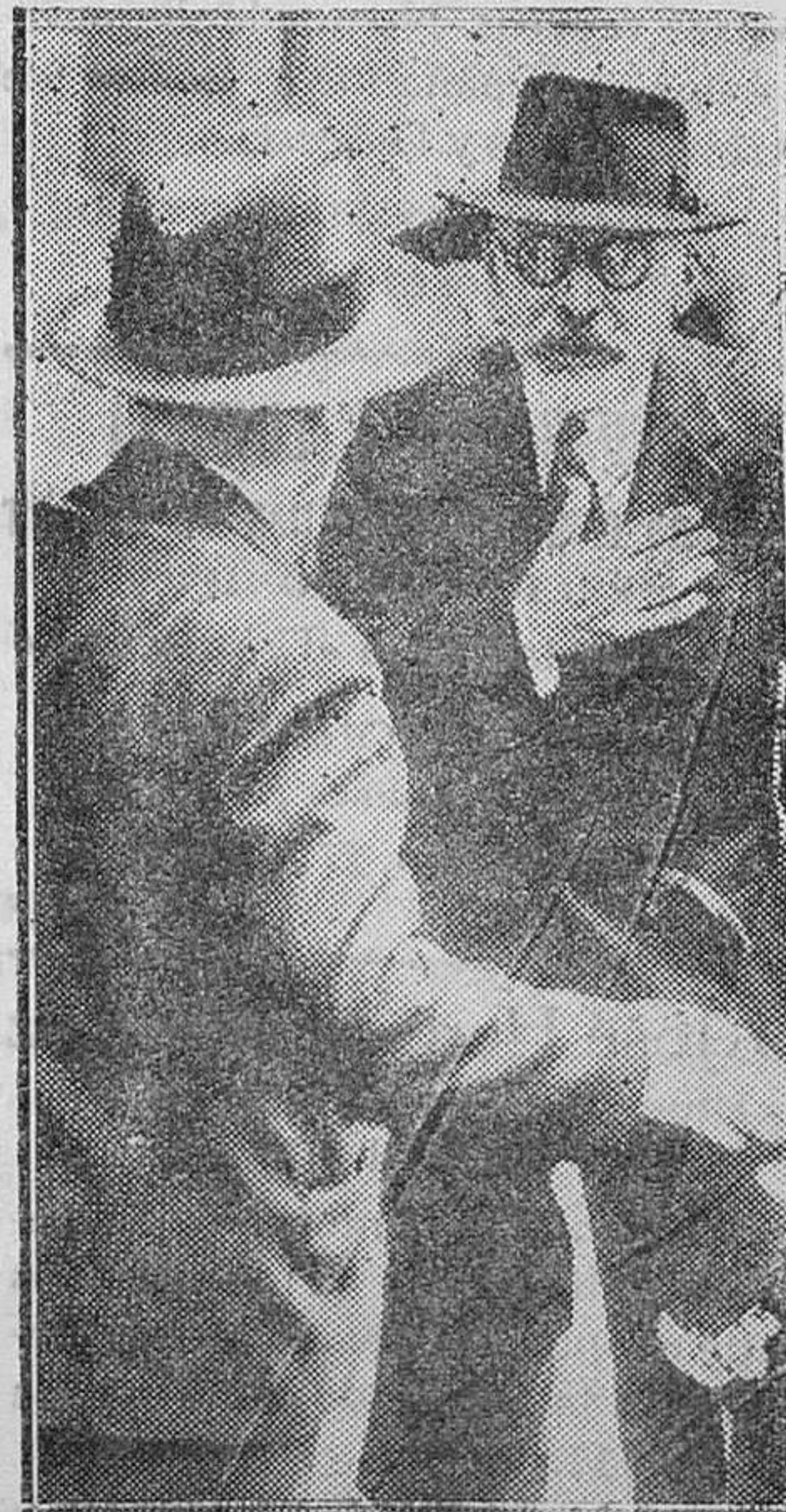
El presidente del Gobierno húngaro, conde Julio Karolye, conversando con los periodistas al salir del Palacio de Reichsverweser, después de constituir el nuevo Gobierno que se presentará en breve al Parlamento

TARRAGONA. — Puede decirse que comprende esta Provincia