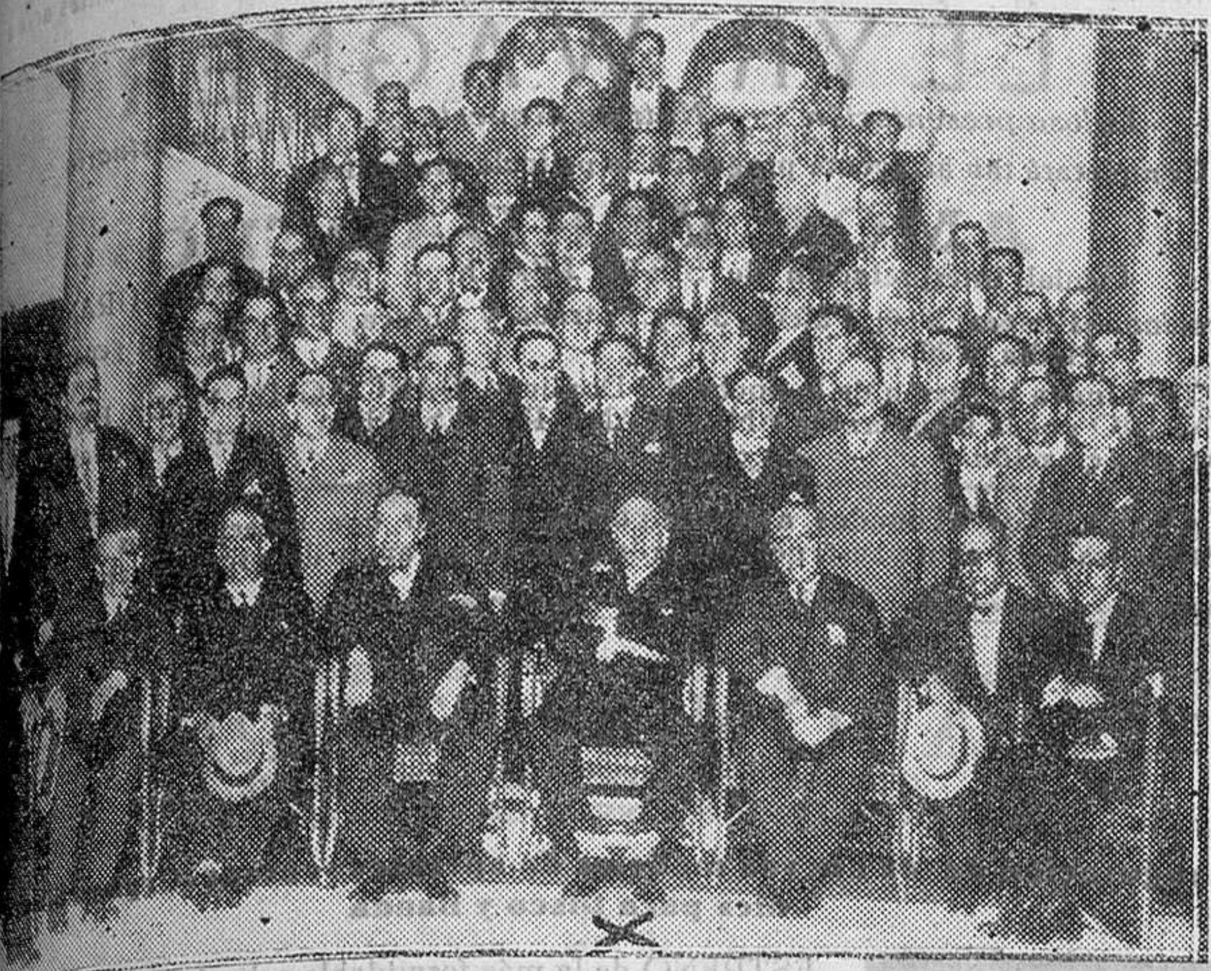
Asistentes al banquete celebrado en Madrid por la colonia tinerfeña en honor del señor Lerroux