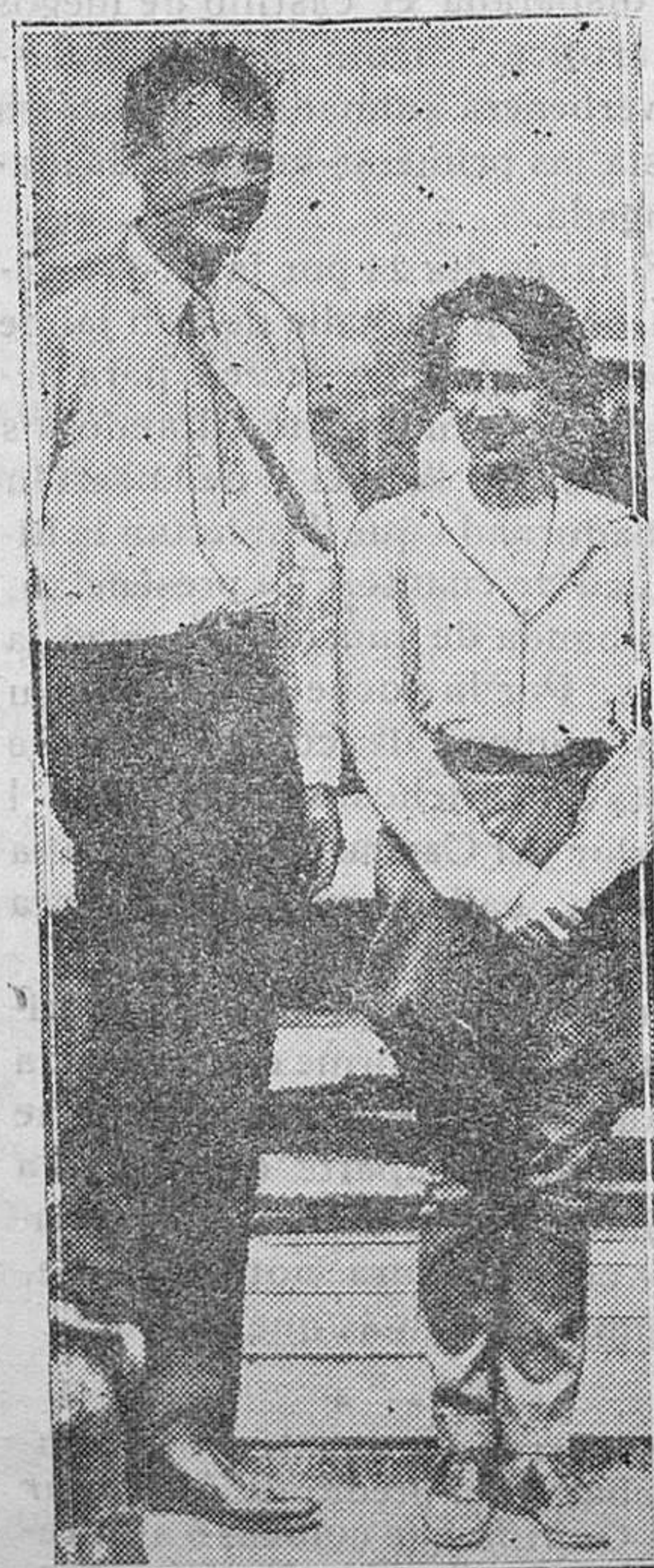
EXTRANJERO.—El célebre aviador norteamericano Lindberg y su esposa en el aeródromo de Alaska

No hace aún quince días comentábamos un editorial de «La