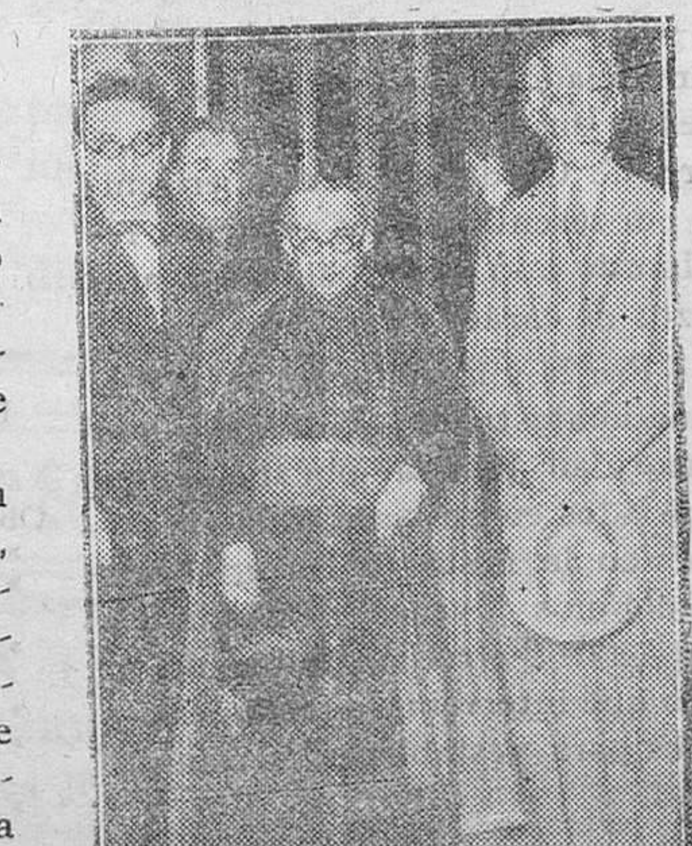
AVILA.—El presidente de la Generalidad de Cataluña señor Maciá, con el ministro de Economía, el obispo de Avila y el gobernador civil, visitando la sala donde se reunieron los comuneros de Castilla, en la Catedral

Pero somos afortunados. Don Niceto, hombre de pelo en pecho, para salvar este colapso, y ha declarado que el Gobierno ni ha claudicado ni claudicará. Excelente ejemplo español. Pero el pesar de sus tragedias, cree recordarse los sucesos que se oponen a esa declaración de energía. Recuerdanse, por ejemplo, que en Gerona se sublevaron los sindicalistas del puerto, y el Gobierno metió en la cárcel al agitador Durruti; pero