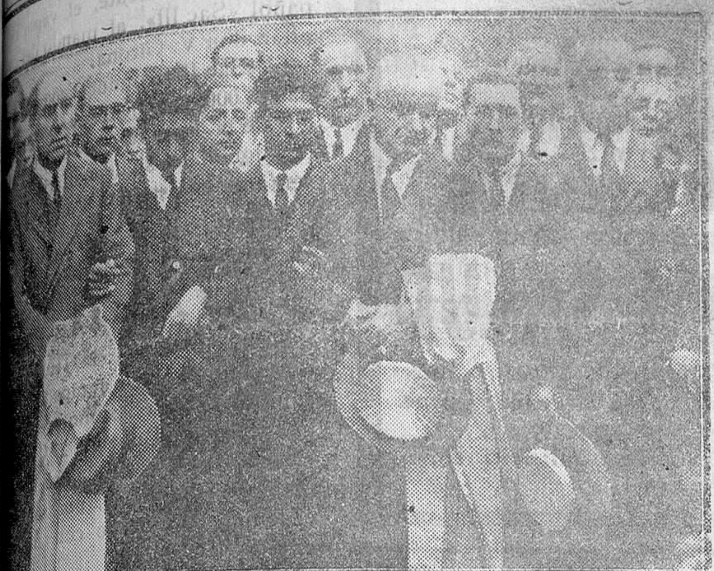
ENTIERRO DE GITANILLO DE TRIANA.— Los familiares, con el apoderado y Vicente Pastor, en la presidencia del duelo