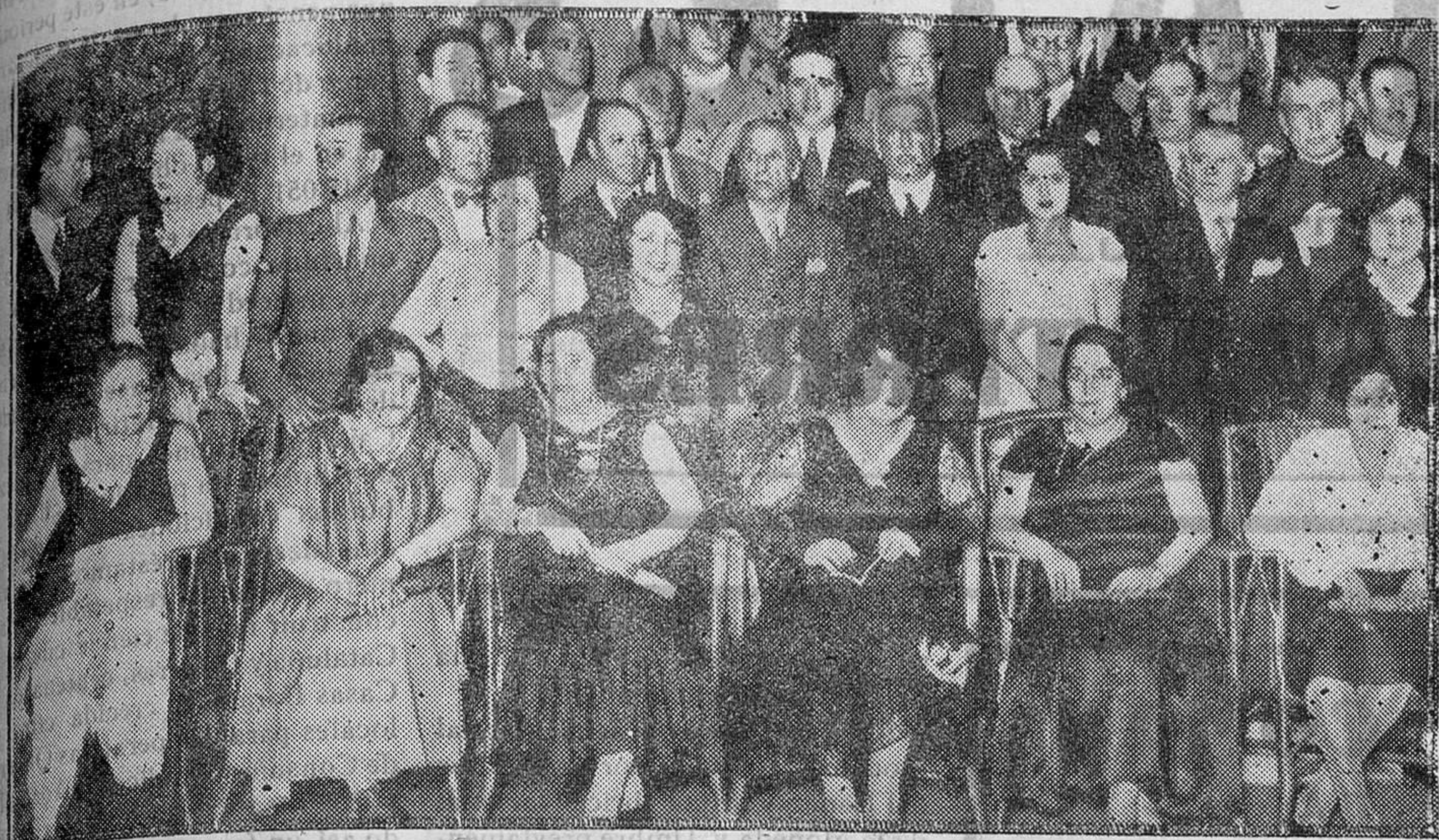
Un grupo de concurrentes al banquete organizado por la Casa de Aragón en honor de los diputados elegidos por las tres provincias de Zaragoza, Huesca y Teruel, entre los que figuran el Presidente del Gobierno provisional señor Alcalá Zamora y el ministro de Fomento señor Albornoz