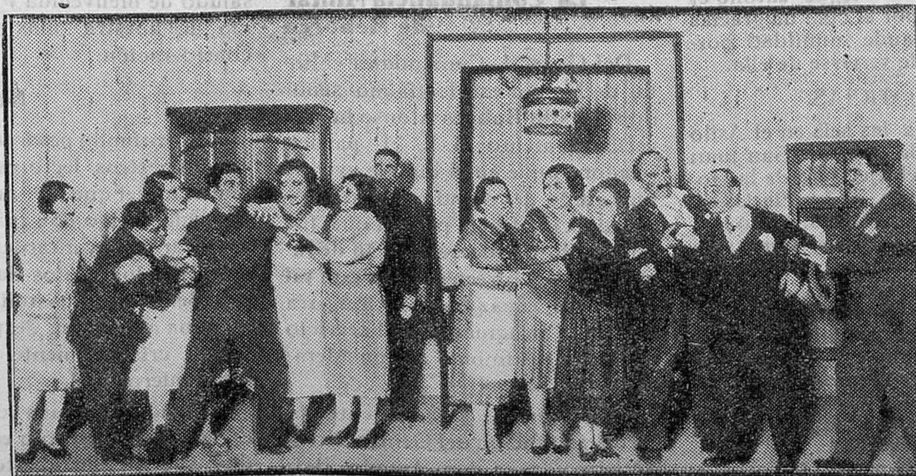
MADRID.—Lyceum Club.—Velada conmemorativa de Mariana Pineda, durante la cual dió una conferencia don Luis de Zulueta

No deben emprenderse obras al azar sólo para salir del paso. Mejor es acabar las empezadas, y a toda velocidad. Para las nuevas hace falta un plan de conjunto que cada provincia o Municipio emprenderán en la debida coordinación con el plan general.