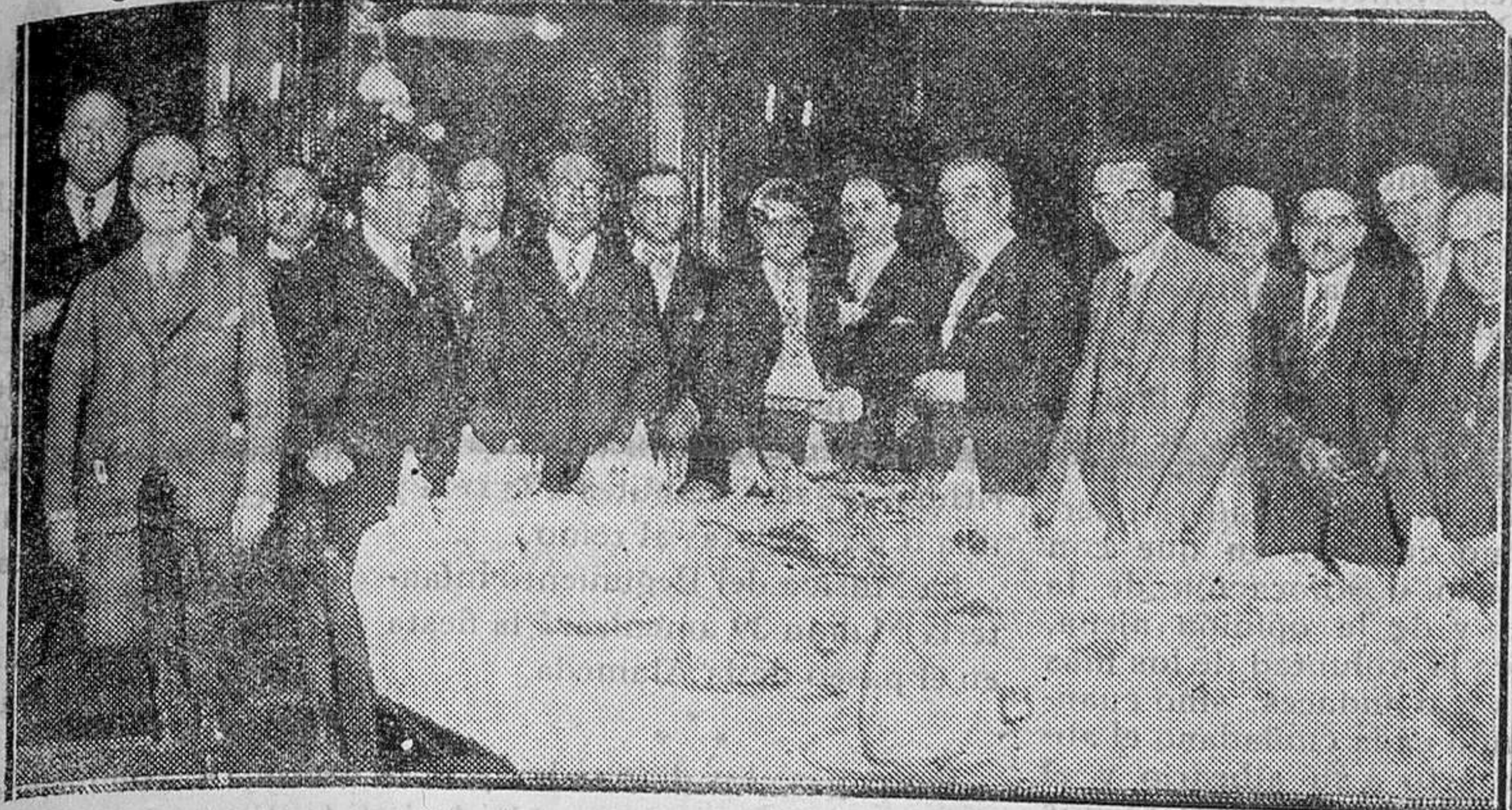
MADRID.—Banquete ofrecido al ministro de México por un numeroso grupo de amigos con motivo de marchar a su país.

PRECIOS DE SUSCRICION En la Isla al mes..... 2,00 ptas. Resto de España al mes 2,50 Extranjero al año..... 60,00 Número suelto..... 10 céntimos Número atrasado..... 20 Anuncios: PAGO ANTICIPADO