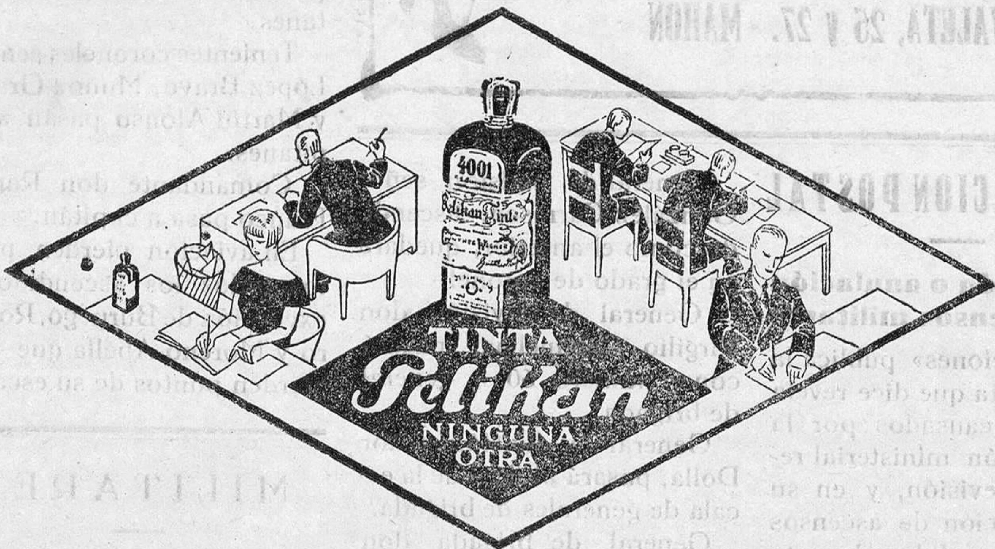
De venta en la Librería de Manuel Sintes Rotger, Plaza del Príncipe 17, Mahón

EDITORIAL CASTRO, S. A. Aduana Diez, 5. — Telegramas: CASTROLO CARABANCHEL BAJO. — (Madrid) Si Ud. es amante de la lectura, si desea adquirir una interesante novela SUSCRÍBASE A EL HIJO DE LA OBRERA. POR EL AMOR DE UN HOMBRE. LOS GOLFOS DE LAVAPI. S. EL DIABLO EN PALACIO. o pida un catálogo para elegir entre los 300 títulos disponibles. También contamos con un vasto catálogo de LIBRERÍA GENERAL; obras de Filología, Historia, Ciencias, Artes, Literatura, y servimos cuanto se nos pida, pertenezca o no a nuestro fondo. SE PRECISAN CORRESPONSALES. ¡GRANDES DESCUENTOS!