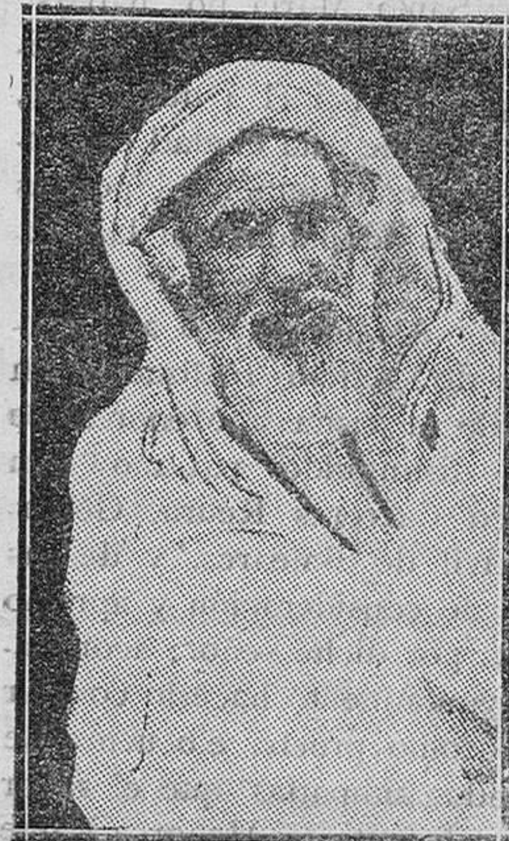
TETUAN.—El gran visir Mohammed-Ben-Azuz, fallecido recientemente

No se arregla quemando conventos, no; de esta manera no se arregla esta cuestión, se envenena la serenidad de la justicia, y la majestad del Poder legislativo republicano resolverá el problema dentro de los términos del Derecho, sin necesidad de cometer ninguna violencia, sin necesidad de que la República se desacredite y sin dar armas a los enemigos, que están deseando decir que somos el desorden y la confusión.»