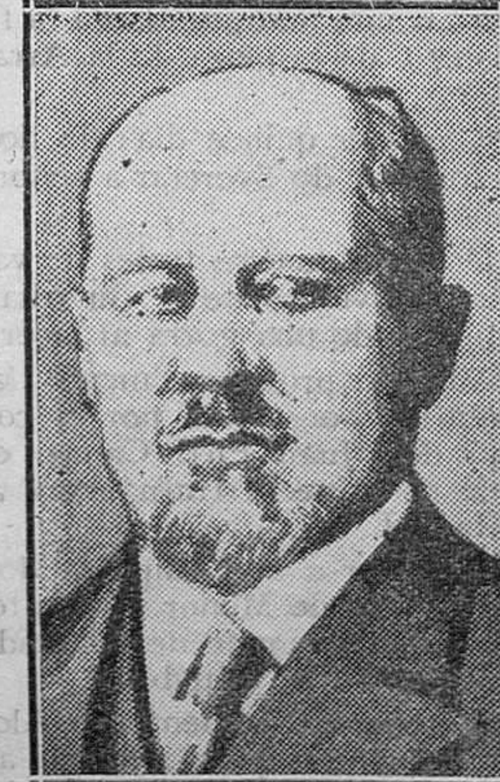
EXTRANJERO.—Piysor, ministro de Comercio e Industria en el Gabinete polaco dimisionario que presidia Slawek, que se ha hecho cargo de la Jefatura del nuevo Gobierno