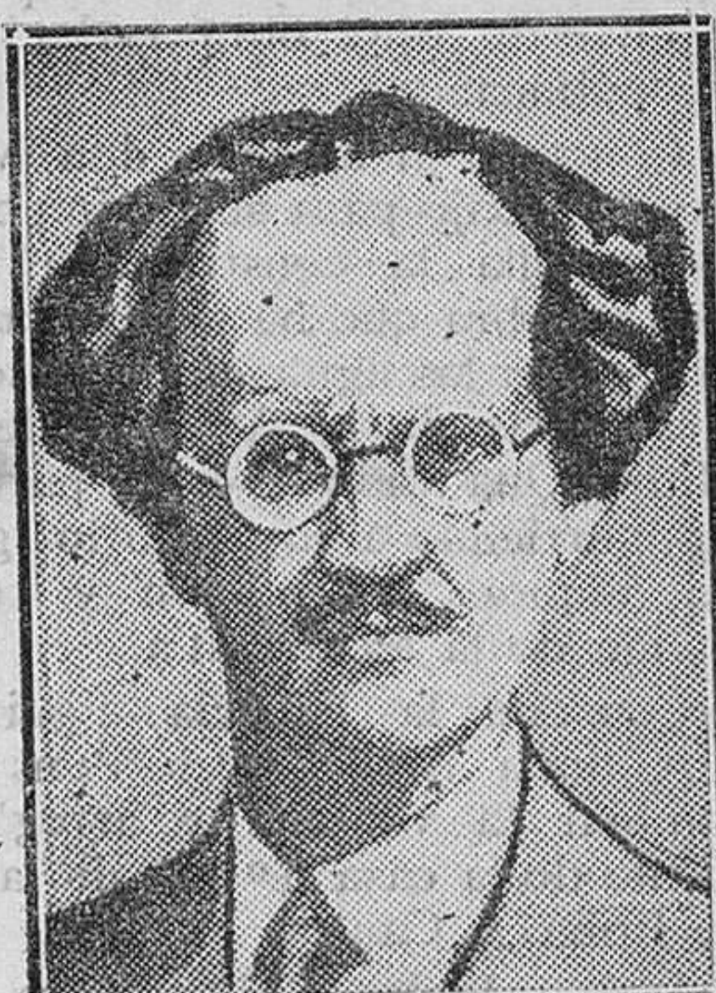
EXTRANJERO.—El experimento del profesor Picard.—El sabio suizo consiguió elevarse con su aerostato a 16.000 metros.

Continúa abierta esta suscripción durante el corriente mes en esta Depositaria de fondos. Mahón 6 de Junio de 1931.—El Alcalde, Pedro Pons Sitges.