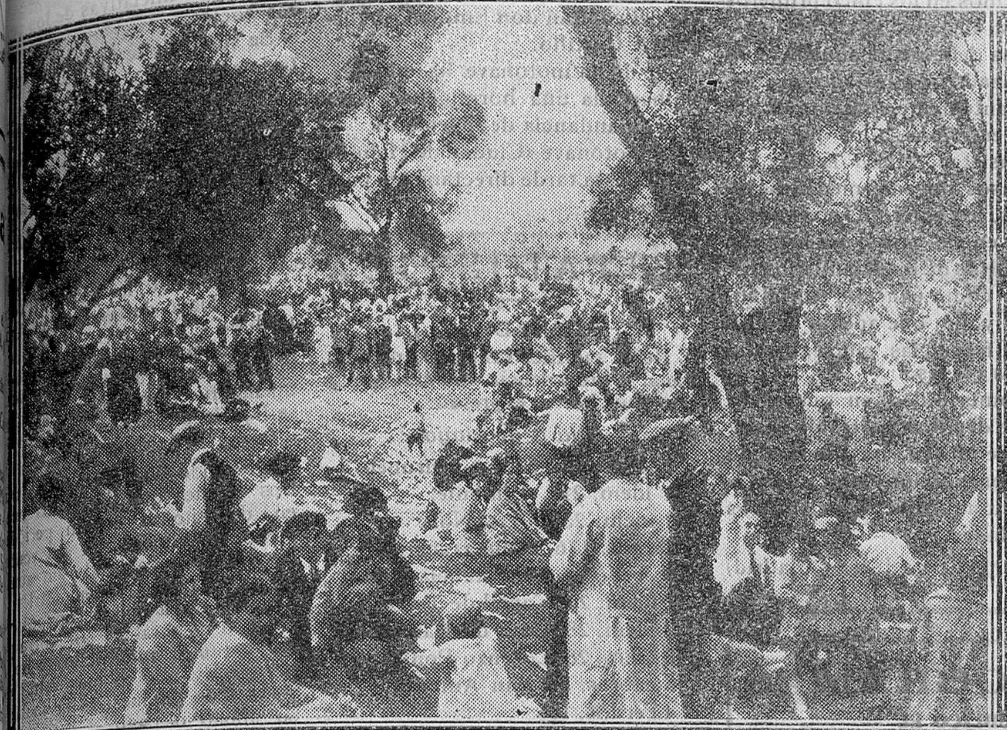
MADRID.—La Fiesta del Trabajo.—Un aspecto de la Casa de Campo durante el día 1.º de Mayo