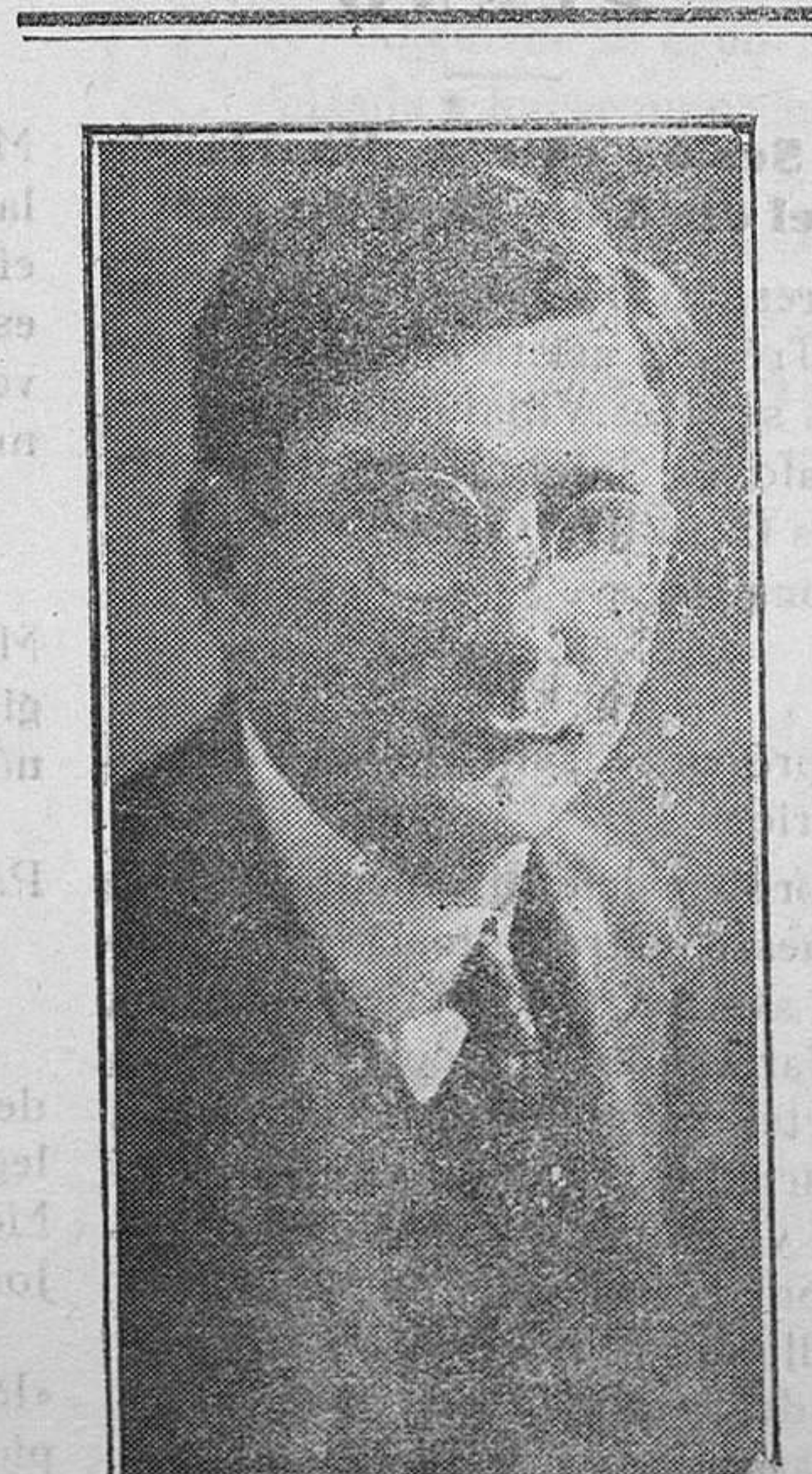
Don Gregorio Marañón, al que se indica para el cargo de Embajador de España en Francia

La Enciclopedia Sopena es, realmente, un gran tributo a la cultura hispánica. Si la sola contemplación de sus dos volúmenes, comprensivos de tres millares de páginas, tamaño cuarto mayor, produce verdadero y atrayente halago visual, el estudio detenido de sus elementos, del método depurado que ha precedido a su redacción, de la admirable proporcionalidad que se da a los artículos, etcétera, viene a proclamar sus méritos sobresalientes, hoy día insuperados. Comprende todas las voces del idioma sancionadas por el uso y por la autoridad de los buenos hablantes y numerosos americanismos, tecnicismos, neologismos y artículos enciclopédicos de biografía, bibliografía, geografía, historia, arqueología, etnografía, mitología, literatura, bellas artes, etcétera, etc., llevando además como apéndice de suma utilidad los principales paradigmas de los verbos españoles y la lista alfabética de éstos, con expresión del modelo a que en su conjugación se ajus-