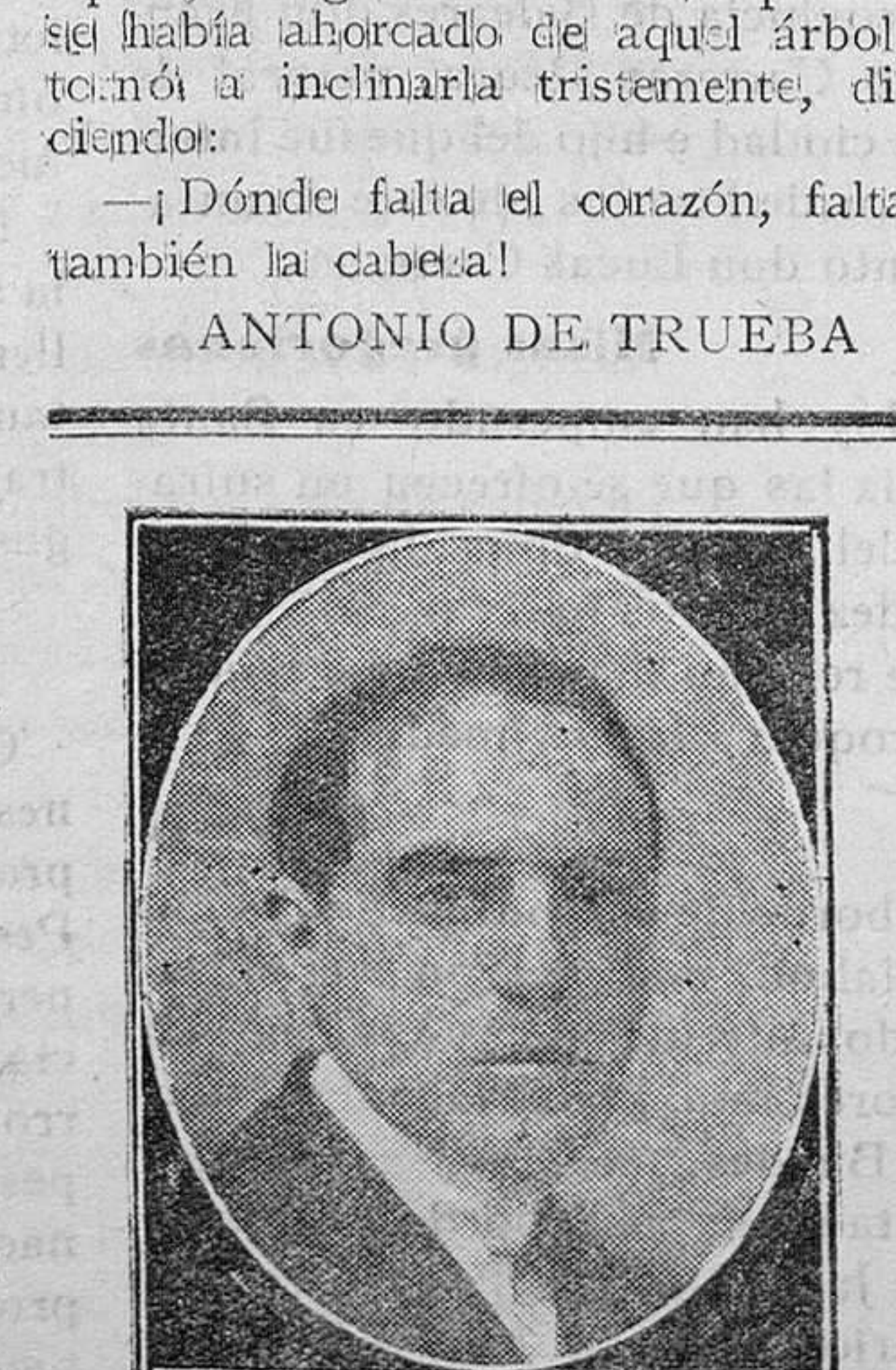
Don Marcelino Domingo, ministro de Instrucción Pública