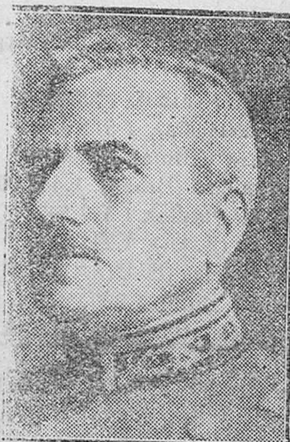
El general argentino Delleplane, que fue ministro de la Guerra con el presidente Irigoyen, al que se acusaba de una intencionalidad contra Urriburu, habiéndose desmentido.