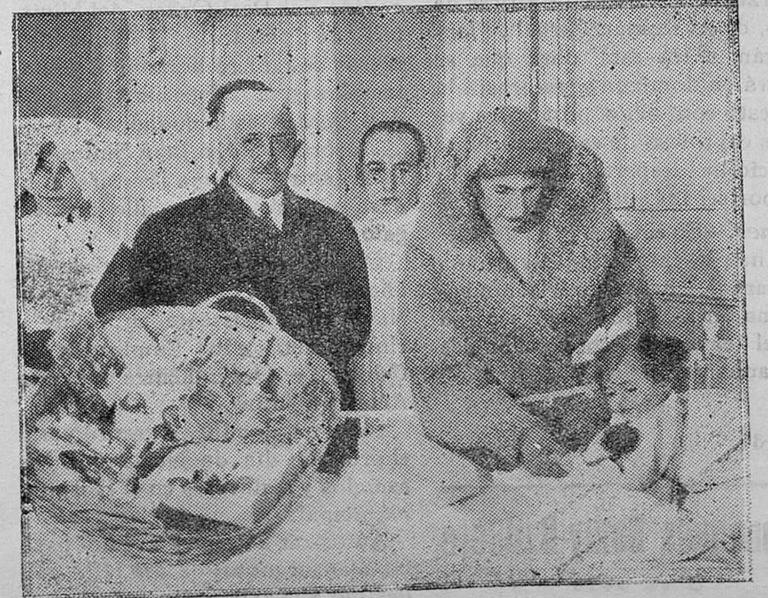
MADRID. — Su Majestad la Reina distribuye juguetes entre los niños enfermos del Hospital del Niño Jesús