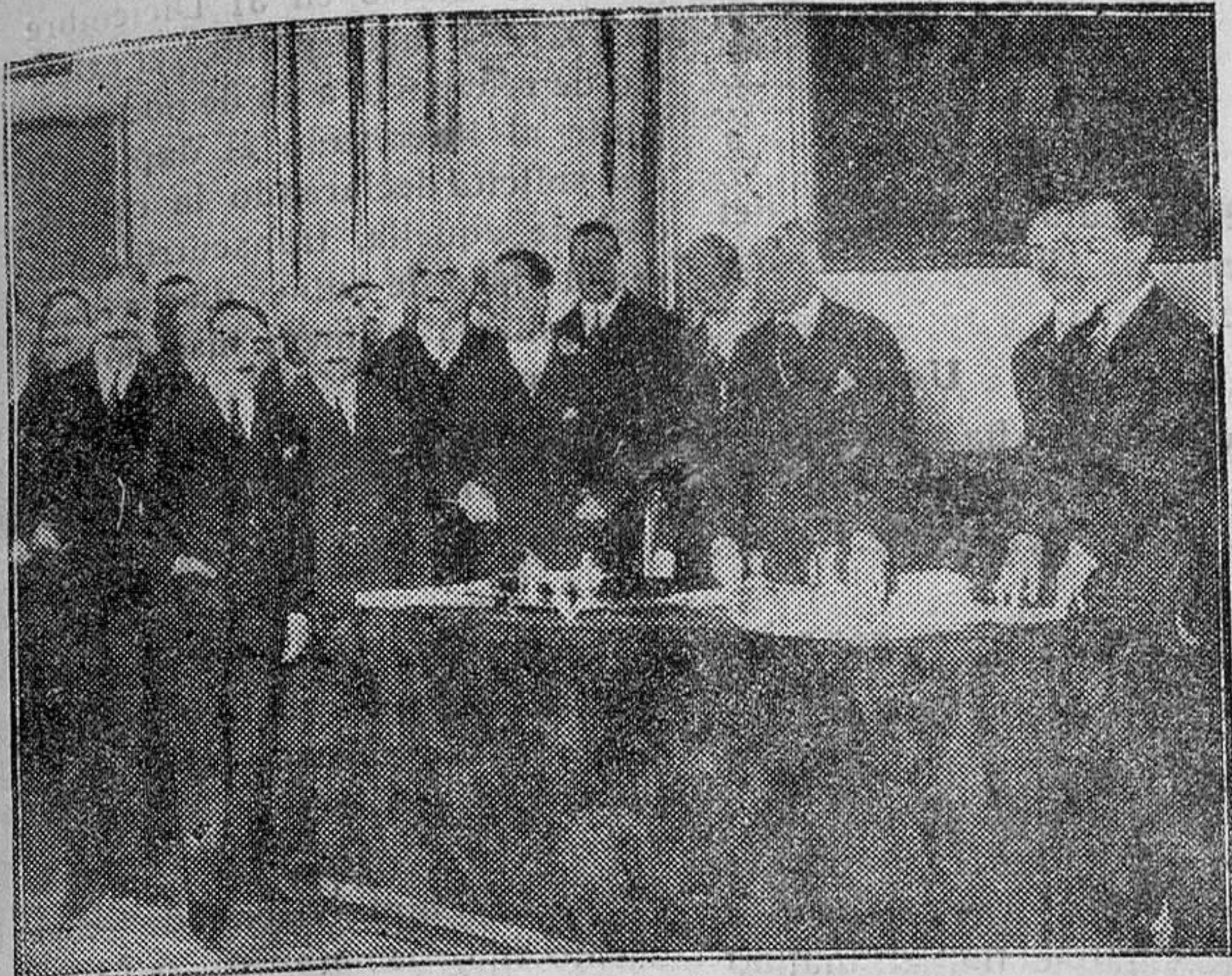
MADRID. — Junta general de la Diputación permanente y Consejo de la Grandeza de España, celebrada en el Palacio Real

se lanzaron y el único que les permite aun seguir con un pie en el estribo, hasta que se decidan a apearse o subir, probablemente lo último.