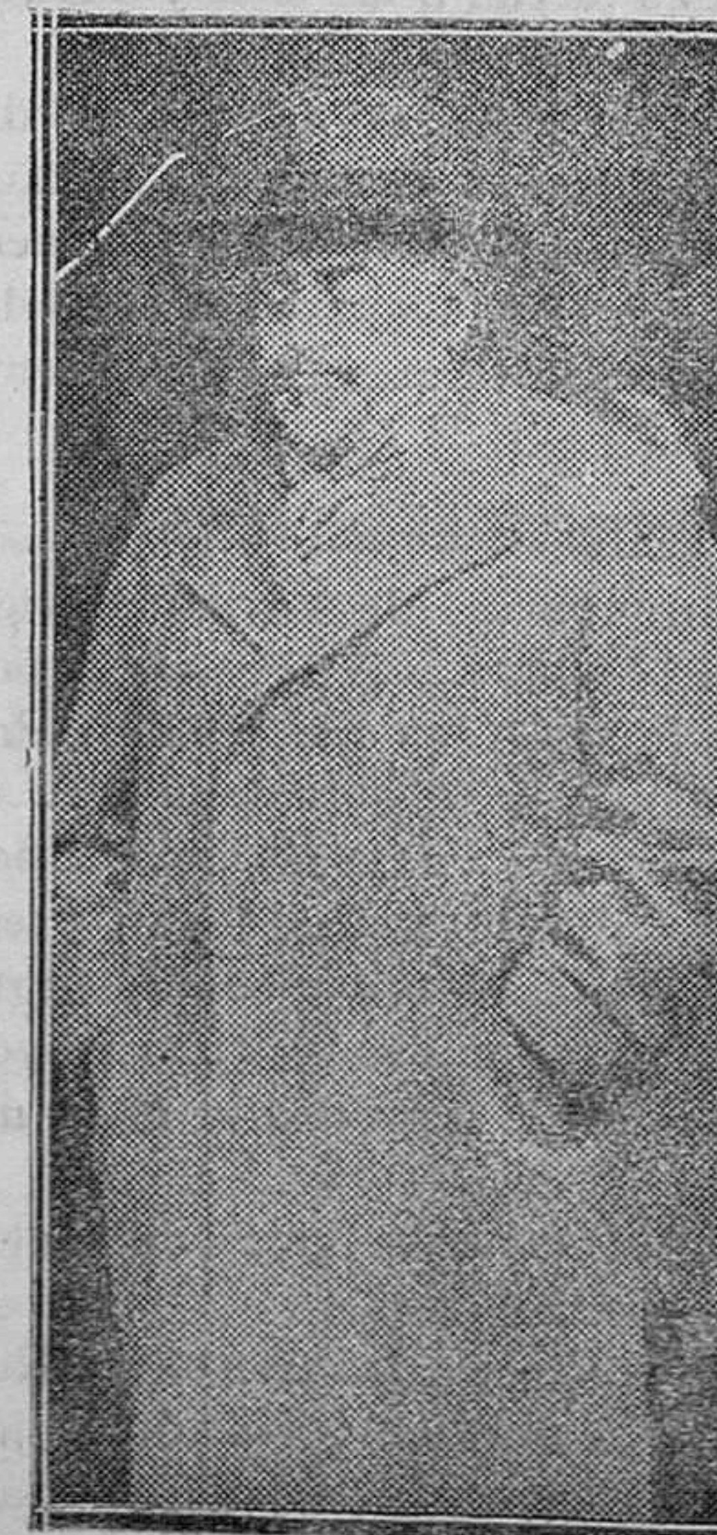
LA CRISIS. — Don Santiago Alba al salir del Palacio Nacional