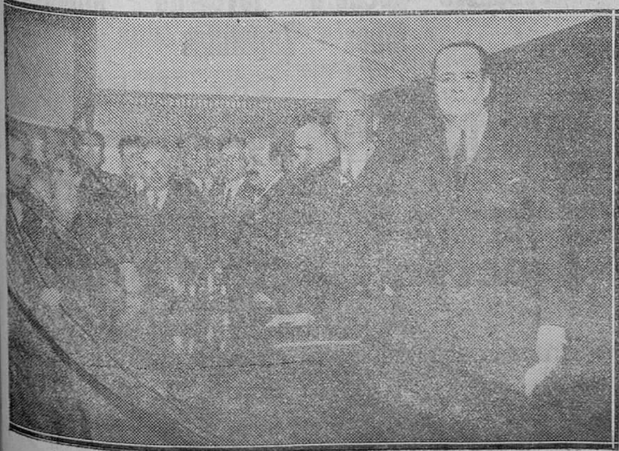
Don Juan de La Cierva, que en el Instituto de Ingenieros civiles, dió una interesante conferencia sobre el autogiro del que es inventor