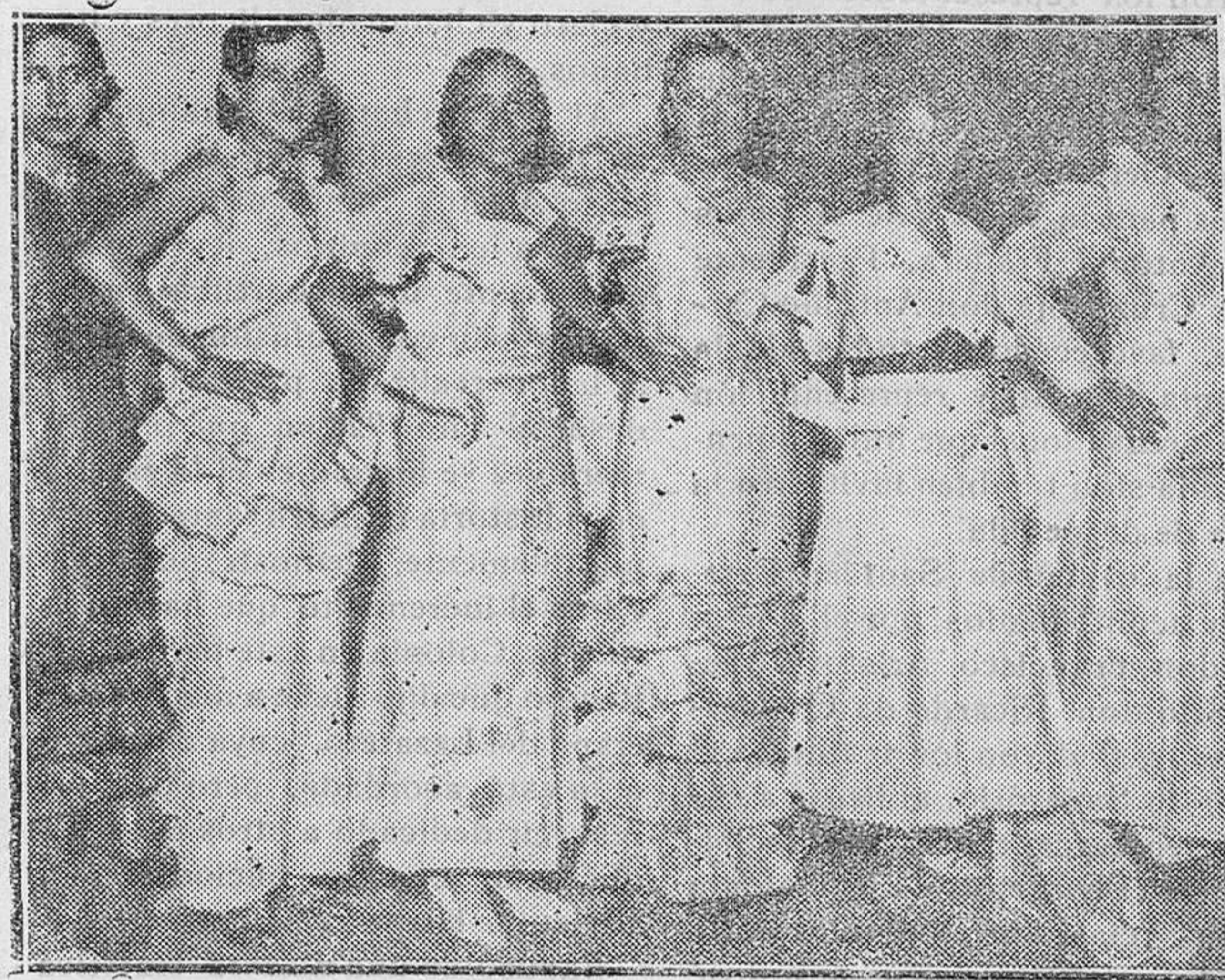
MADRID. — Grupo de concurrentes al concurso de trajes de papel de seda