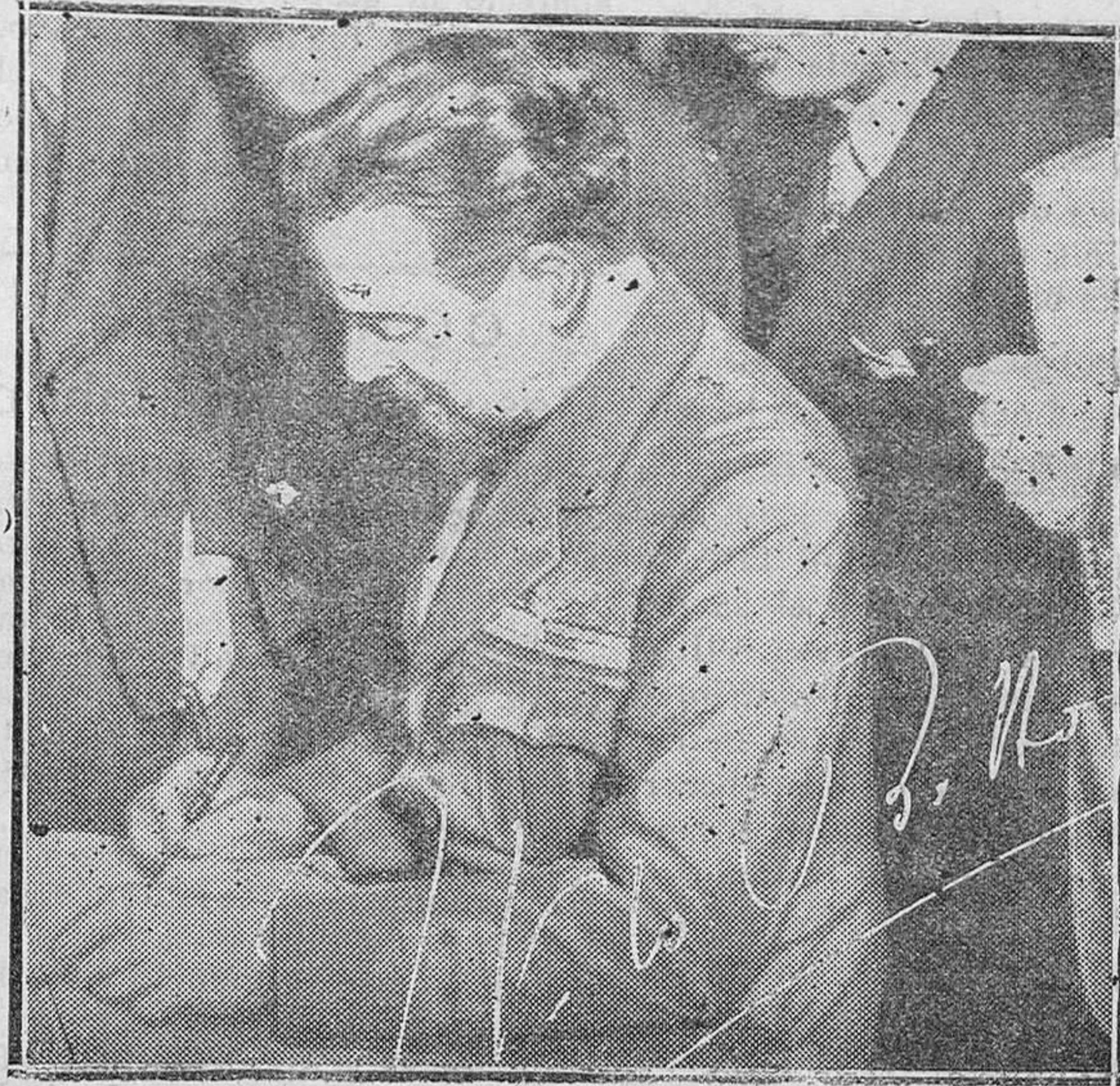
ITALIA. — El general Italo Balbo a su regreso a Roma, después de la notable hazaña del vuelo trasatlántico en escuadrilla, ha sido solicitado por millares de personas que desearían tener un autógrafo suyo. La fotografía representa al ministro del Aire italiano en el momento que dedica una firma, la que se ve en el grabado