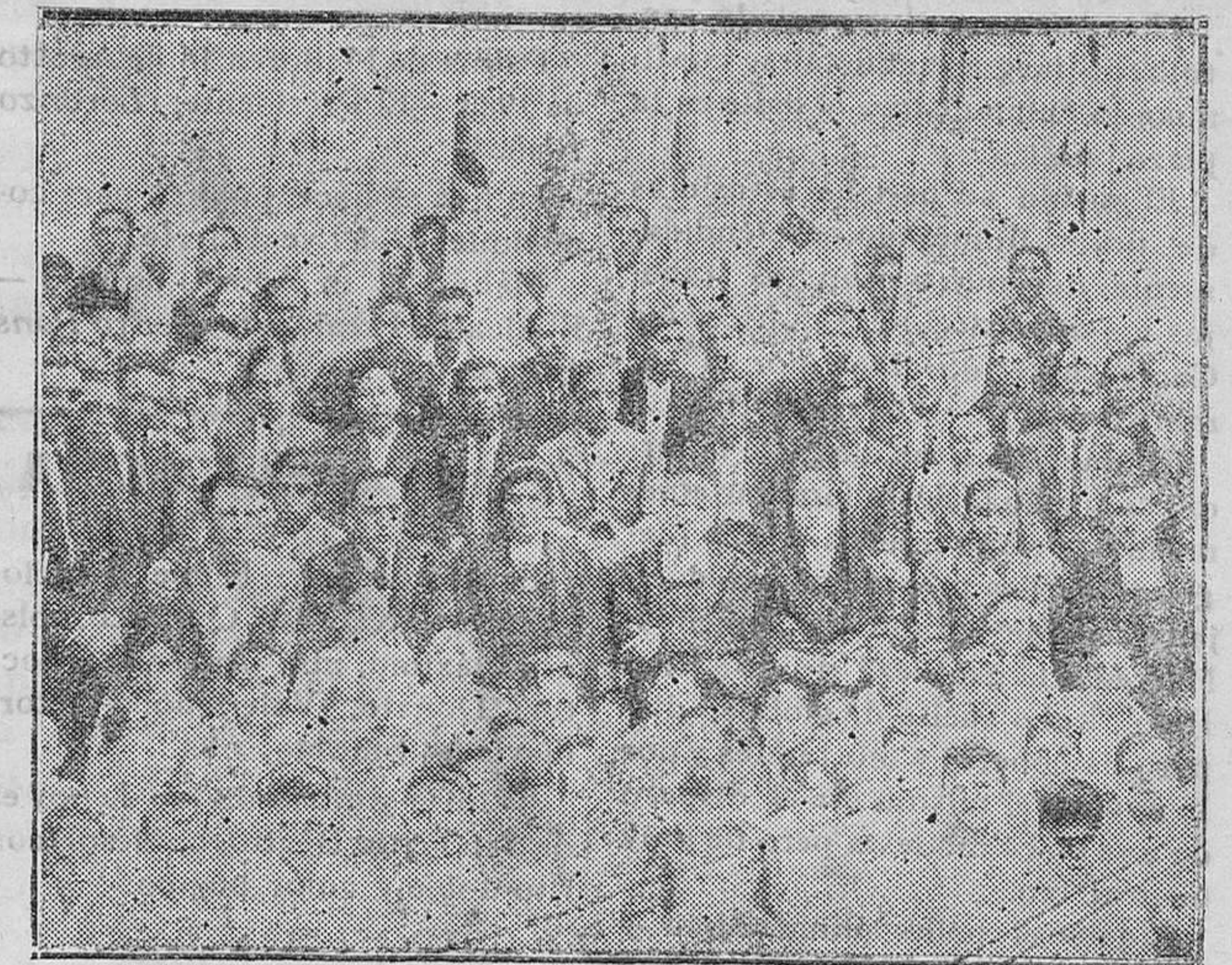
MADRID.—Bendición de banderas del Patronato de Chamberí de la Juventud Católica Española, en la Capilla del Colegio que dirigen los Hermanos de las Escuelas Cristianas en la calle de Raimundo Lullo