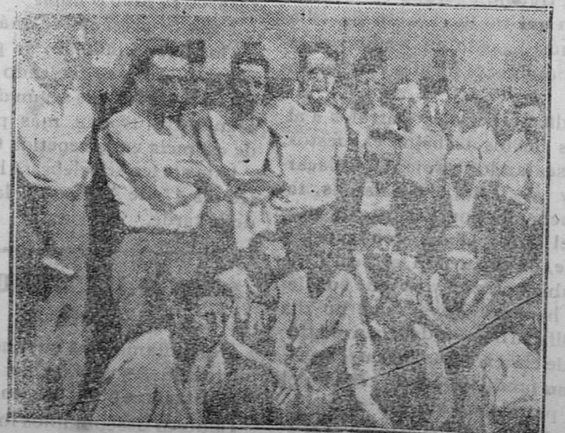
BARCELONA.—Grupo de presos políticos y sociales