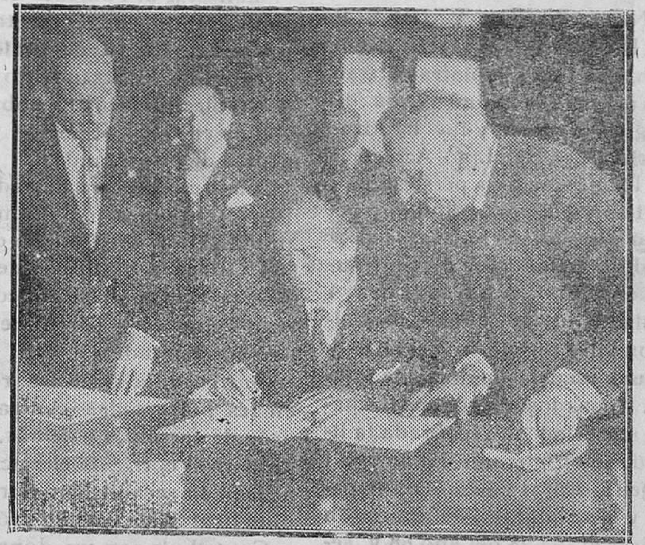
El señor Mussolini en el momento de estampar su firma en el documento del Pacto de los Cuatro

La Revista de Modas más económica que se publica en España. Véndese en la Librería de Manuel Santos Rengar, Plaza de Pablo Iglesias 13, Mahón.